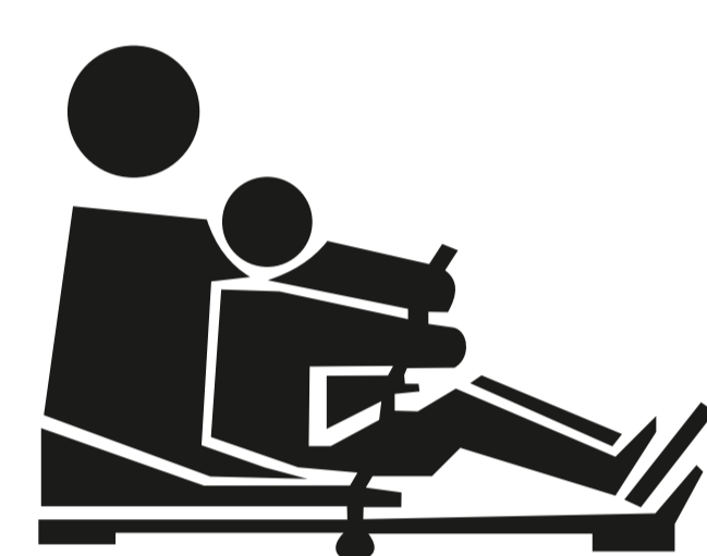
DZIECKO SIEDZI Z PRZODU