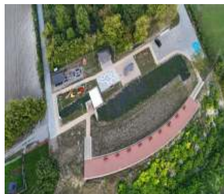
PODSUMOWANIE INWESTYCJI 2024 R. - str. 3