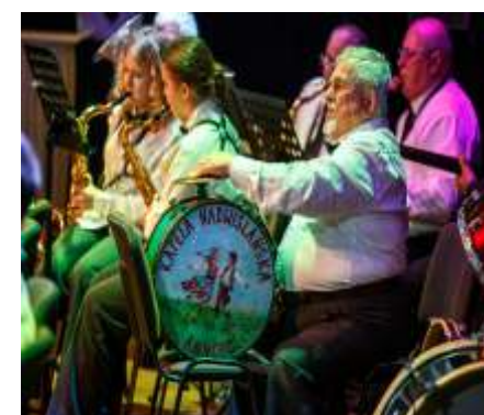
Z ŻYCIA CENTRUM ... - str. 19