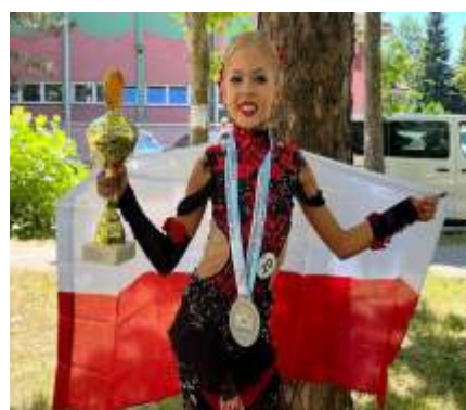
SUKCESY ANNOPOLSKICH SPORTOWCÓW - str. 12