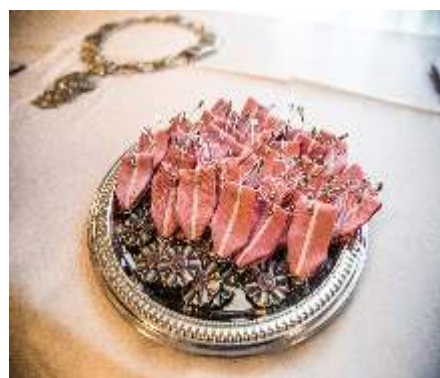
JUBILEUSZ 50 LAT POŻYCIA MAŁŻEŃSKIEGO - str. 2