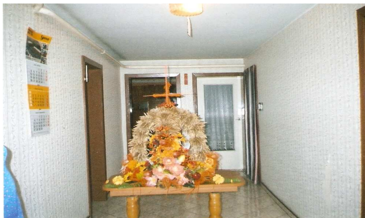
wieńce dożynkowe 2010 i 2011