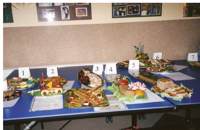
KGW Niemojewiec- wystawa potraw regionalnych