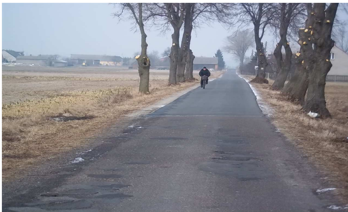
Droga od Walentynowa do Niemojewca

Przez wieś Niemojewiec przechodzą słupy energetyczne wysokiego napięcia, które niszczą nam wizerunek przestrzenny.