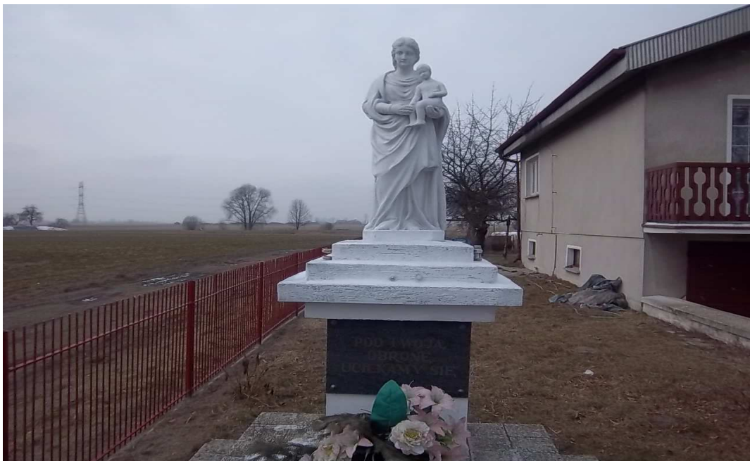
figurka Matki Boskiej