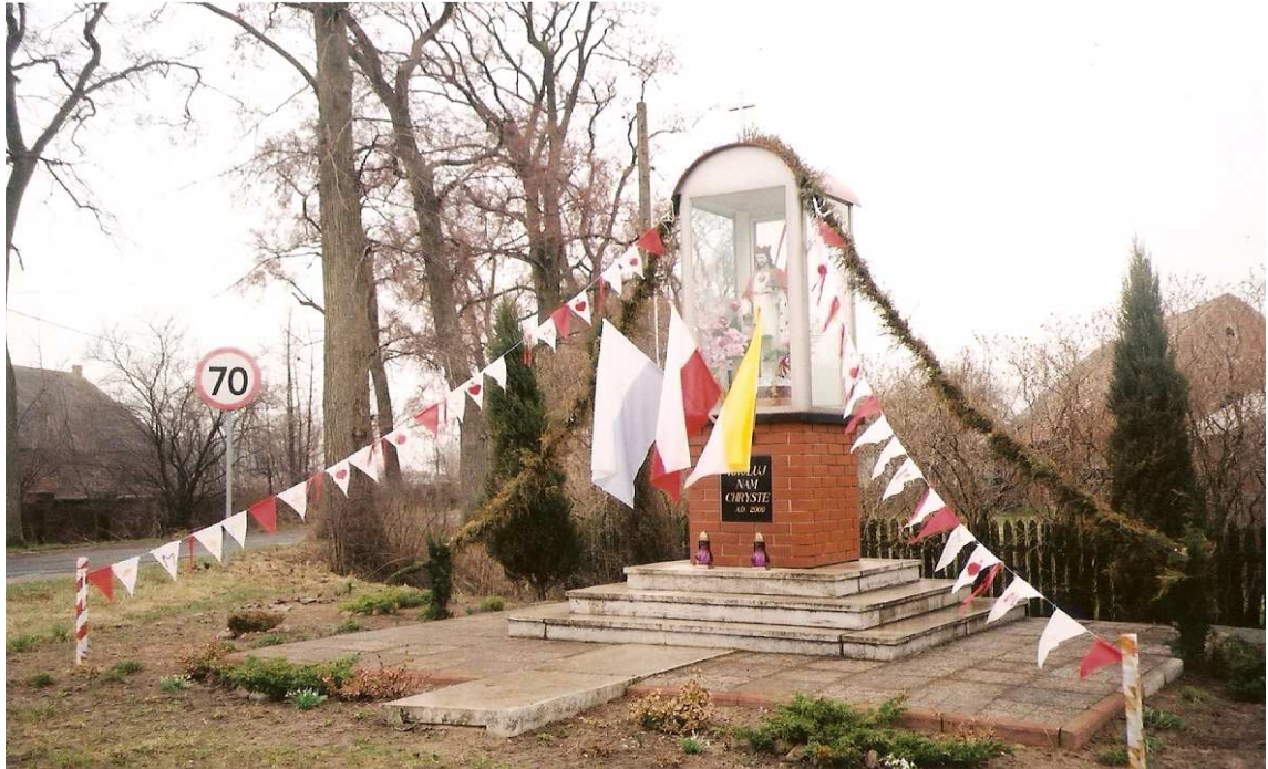
kapliczka Serca Jezusowego