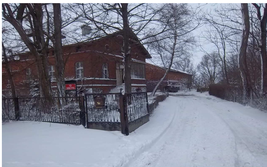
rządcówka z 4 ćw. XIX w.