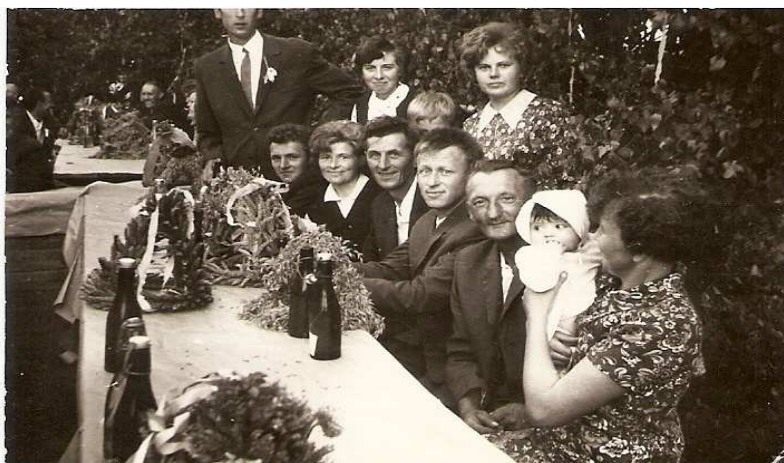
Gminne Dożynki w Niemojewcu 1967r.