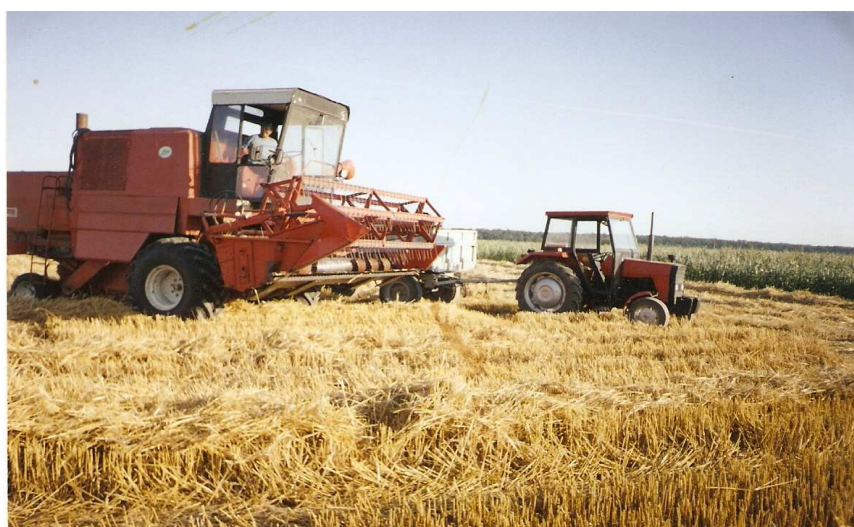
Rolnictwo- główne źródło utrzymania

Mieszkańcy miejscowości Niemojewiec zajmują się głównie rolnictwem . Rozwijają się gospodarstwa rolne, które specjalizują się w hodowli bydła mlecznego i opasowego oraz trzody chlewnej. Istnieje jedno gospodarstwo specjalistyczne „Pod Kasztanami”. W strukturze zasiewów dominują zboża i kukurydza, które są uprawiane ze względów hodowlanych na paszę, w mniejszym stopniu buraki cukrowe i rzepak. Ogólna powierzchnia wsi wynosi 363 ha w tym posiadamy 347 ha użytków rolnych z czego grunty orne to 330 ha, łąki 14 ha, pastwiska 2 ha. Las prywatny zajmuje 0,21 ha. Wody na terenie wsi stanowią powierzchnię 1,81 ha, inne użytki 13 ha. Dla naszych rolników największym problemem jest wysoka cena nawozów, środków ochrony roślin i paliw w stosunku do cen produkcji rolnej. Obecna sytuacja naszych rolników jest niezadowolająca ze względu na małą opłacalność produkcji, skutkiem czego są niskie dochody rolników.