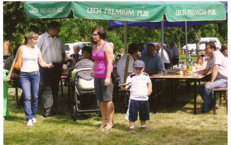
Festyn Rodzinny 2011