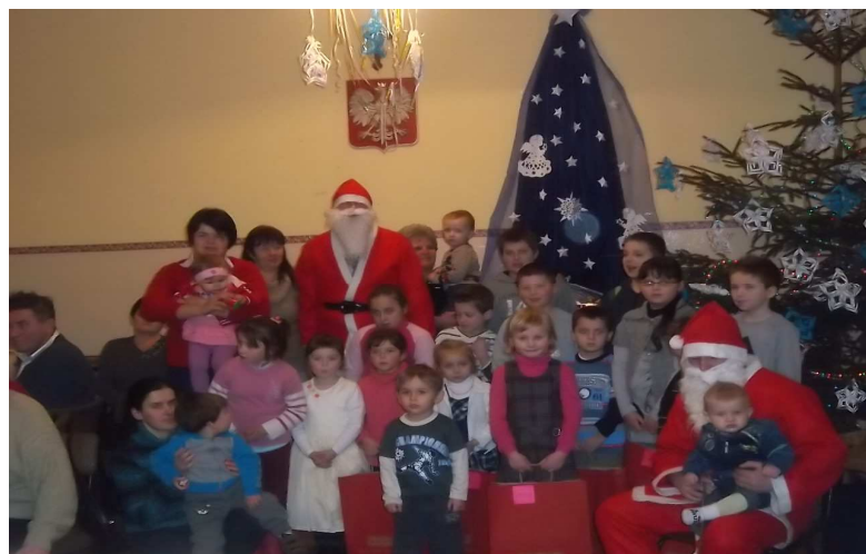
Gwiazdka i Dzień Babci i Dziadka 2012