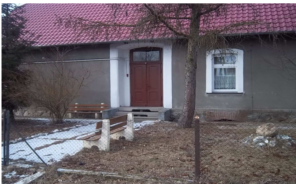
obecna świetlica wiejska

Osobliwościami na terenie wsi w zakresie kultywowania tradycji i religii są: kapliczka ku czci Serca Jezusowego odnowiona w 2000 roku, umiejscowiona na rozdrożu drogi powiatowej z drogą gminną; kapliczka ku czci Matki Boskiej przy posesji nr 14.