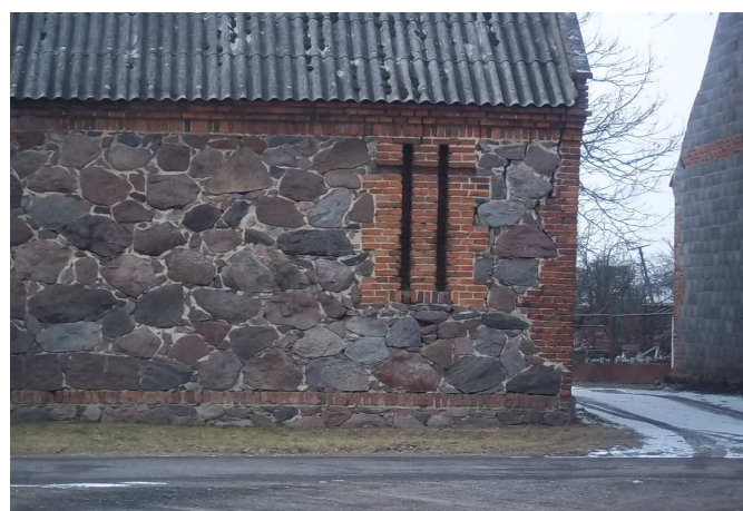
spichlerz i stodoła z końca XIX w.