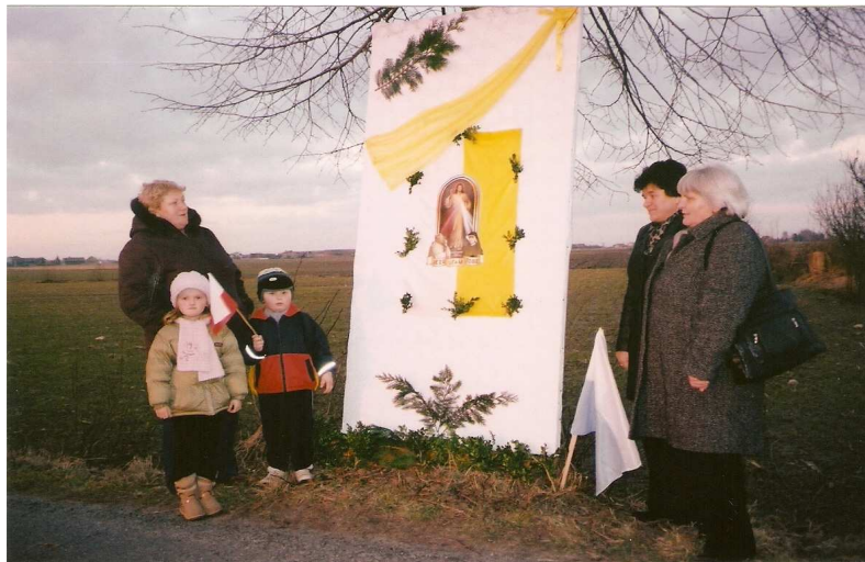
pożegnanie obrazu Miłosierdzia Bożego