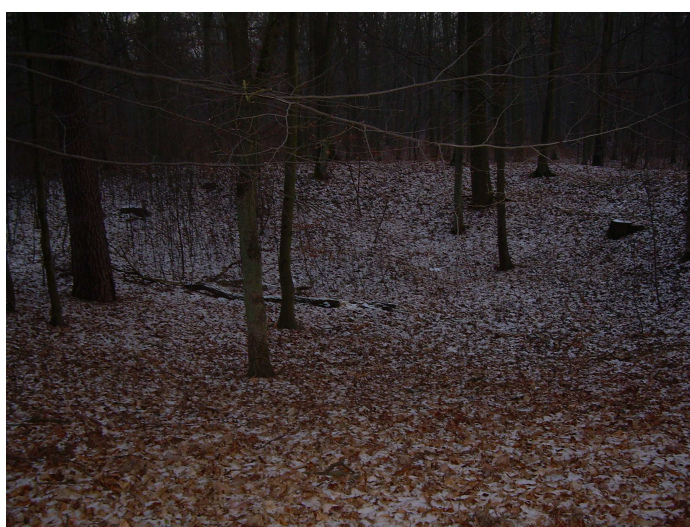
„Okop Szwedzki” w pobliskim lesie