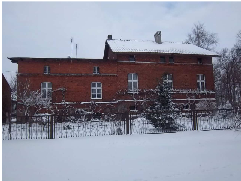
rządcówka z 4 ćw. XIX w.