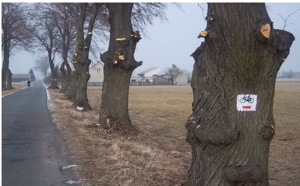
trasa ścieżki rowerowej