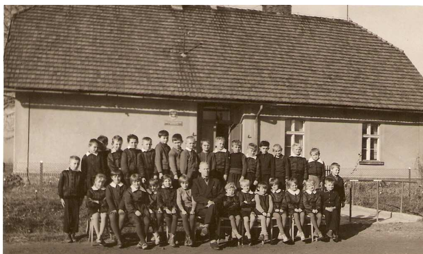
Budynek dawnej szkoły w Niemojewcu wraz z uczniami

W naszej miejscowości znajduje się cmentarz ewangelicki, przydrożna kapliczka, dawny budynek szkoły pierwotnie niemieckiej, później polskiej a obecnie świetlica wiejska i mieszkanie komunalne oraz mała remiza strażacka. W końcu XIX w. została wykupiona część majątku Niemojowskich przez Niemców i założona wieś Waldmar. Wcześniejsze informacje wskazują, iż była to osada należąca do rodziny Niemojowskich - właścicieli pałacu w Przybysławicach. Zachowały się fragmenty zespołu folwarcznego z XIX w. :2 stodoły murowane z kamienia i cegły, murowana chlewnia, spichlerz oraz rządówka. W pobliskim lesie jest grodzisko wczesnośredniowieczne „Szwedzki Okop”.