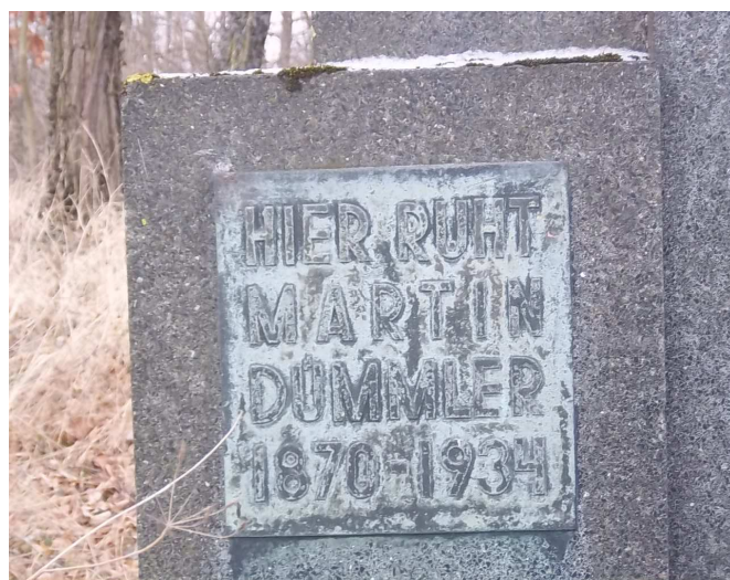
nagrobki na cmentarzu ewangelickim w Niemojewcu