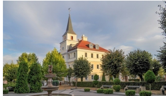
Ratusz - ul. Rynek 32

Urząd Gminy i Miasta Raszków to miejsce, w którym pracuje władza publiczna dla miejscowości Raszków i wiosek z terenu Gminy i Miasta Raszków. W Urzędzie Gminy pracuje burmistrz. Burmistrz to osoba, która rządzi gminą. Burmistrz jest także kierownikiem urzędu. Budynek urzędu znajduje się w miejscowości Raszków ul. Rynek 32 i Przybysławice nr 42. 11.07.2018 roku przyjęty został regulamin. Regulamin ten opisuje jak ma działać urząd i co robić.