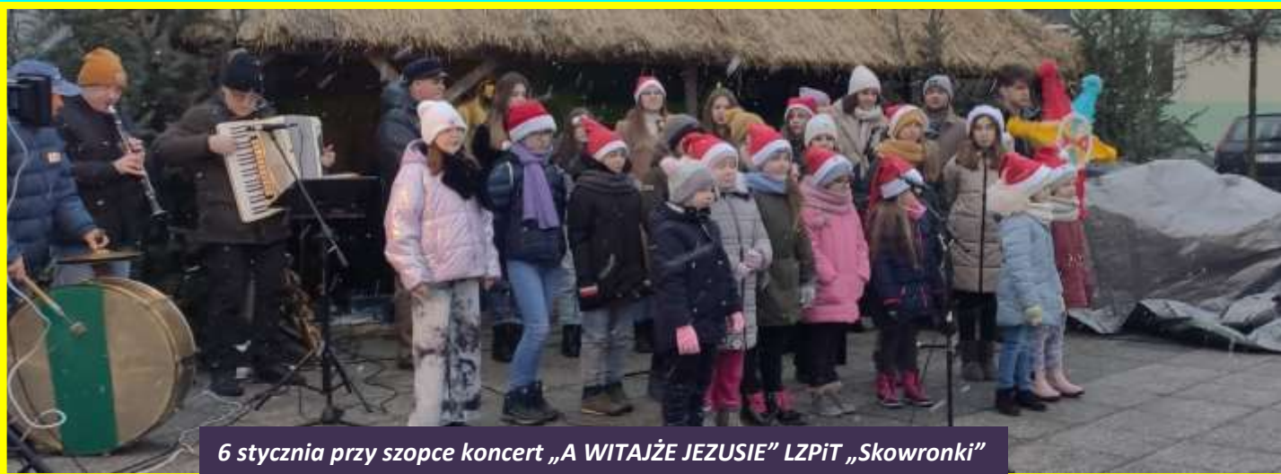
6 stycznia przy szopce koncert „A WITAJŹE JEZUSIE” LZPiT „Skowronki”

W tym wydaniu - pierwszym w 2023 roku - prezentujemy szybki fotograficzny przegląd ważniejszych wydarzeń kulturalnych minionego 2022 roku.