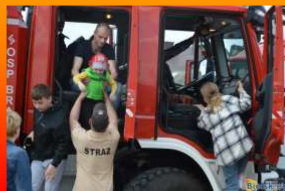
Na zdjęciu akcja wożenia dzieci strażackim samochodem z okazji świętowania Dnia Strażaka.

Do brańskiej OSP należy 40 druhow, a regularnie udział w akcjach bierze udział 24 z nich.