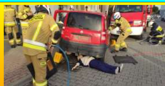
Brańscy strażacy podczas pokazu akcji ratowniczej na 41 Brańskie Dni Kultury.

W ramach projektu „Mikroinstalacje OZE na terenie Miasta Brańsk – projekt grantowy” mieszkańcy Brańska mogli składać wnioski na sfinansowanie inwestycji z zakresu budowy nowych jednostek wytwarzania energii elektrycznej i/lub ciepłej wykorzystujących energię słoneczną polegających na instalacji ogniw fotowoltaicznych lub kolektorów słonecznych. Z grantów skorzystało ponad 40 rodzin, którym wypłacono ponad 778 000zł .