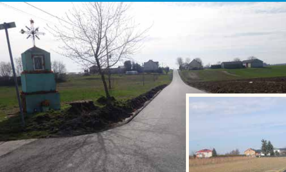
Nowa nawierzchnia w Bogucinie (105951L)