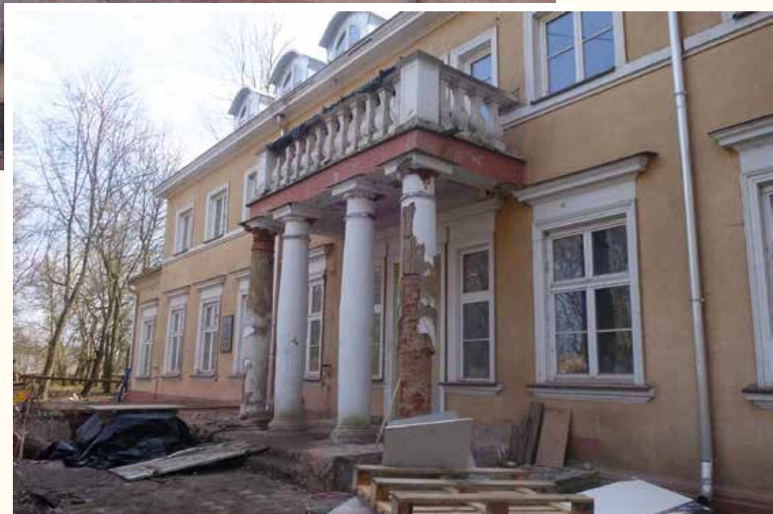
Prace budowlane przy rewitalizacji budynku dawnego Domu Dziecka w Przybysławicach