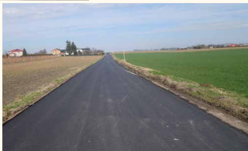
Nowa nawierzchnia w Przybysławicach (105911L)

Czynimy przygotowania do przetargu na „ Budowę Gminnej Oczyszczalni Ścieków w Zagrodach ” w systemie „Zaprojektuj i wybuduj”. W tym celu został opracowany Program Funkcjonalno- Użytkowy za kwotę 59.655zł. Przetarg powinien zostać ogłoszony jeszcze w marcu tego roku. Na tę inwestycję pozyskaliśmy dofinansowanie 7.980.000 zł z Funduszu „Polski Ład”.