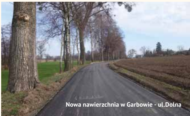
Nowa nawierzchnia w Garbowie - ul. Dolna

Po przyjęciu porządku obrad głos zabral wójt składając sprawozdanie z działalności gminy między sesjami tj. 29.11.2023 - 28.12.2023. W toku dalszych obrad rada podjęła uchwałę w sprawie zmiany wieloletniej prognozy finansowej gminy Garbów na lata 2023-2026 oraz w sprawie zmiany uchwały budżetowej na 2023 r. Zostały zmniejszone planowane dochody o kwotę 6.642.828 zł, do kwoty 47.836.021 zł. Z tego dochody bieżące wyniosły 45.585.718 zł, a dochody majątkowe 2.254.302 zł.