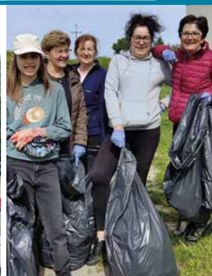
Sprzątanie świata w sołectwach gminy Garbów