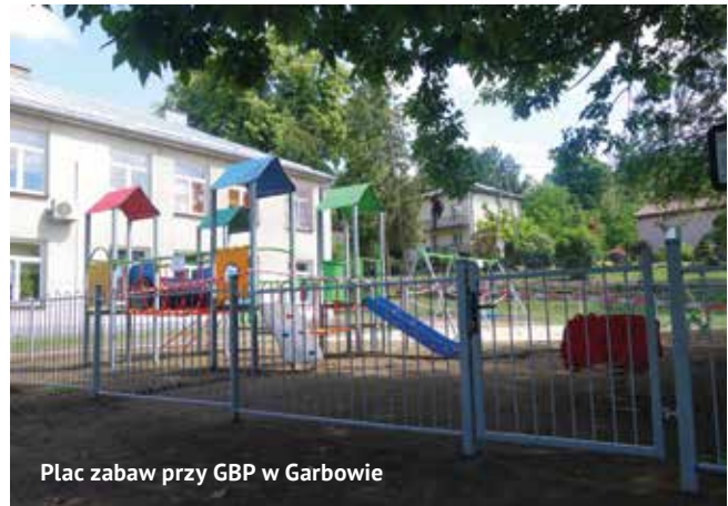
Plac zabaw przy GBP w Garbowie

Został rozstrzygnięty przetarg na budowę sieci i przyłączy kanalizacji sanitarnej ul. Malinowa i ul. Tatarakowa. Najkorzystniejsze oferty złożyła firma Prohouse z Jaroszewic w kwocie 448.950 – ul. Malinowa, 264.455 – ul. Tatarakowa. Najdroższe oferty wynosiły odpowiednio 1.141.120 oraz 697.492.