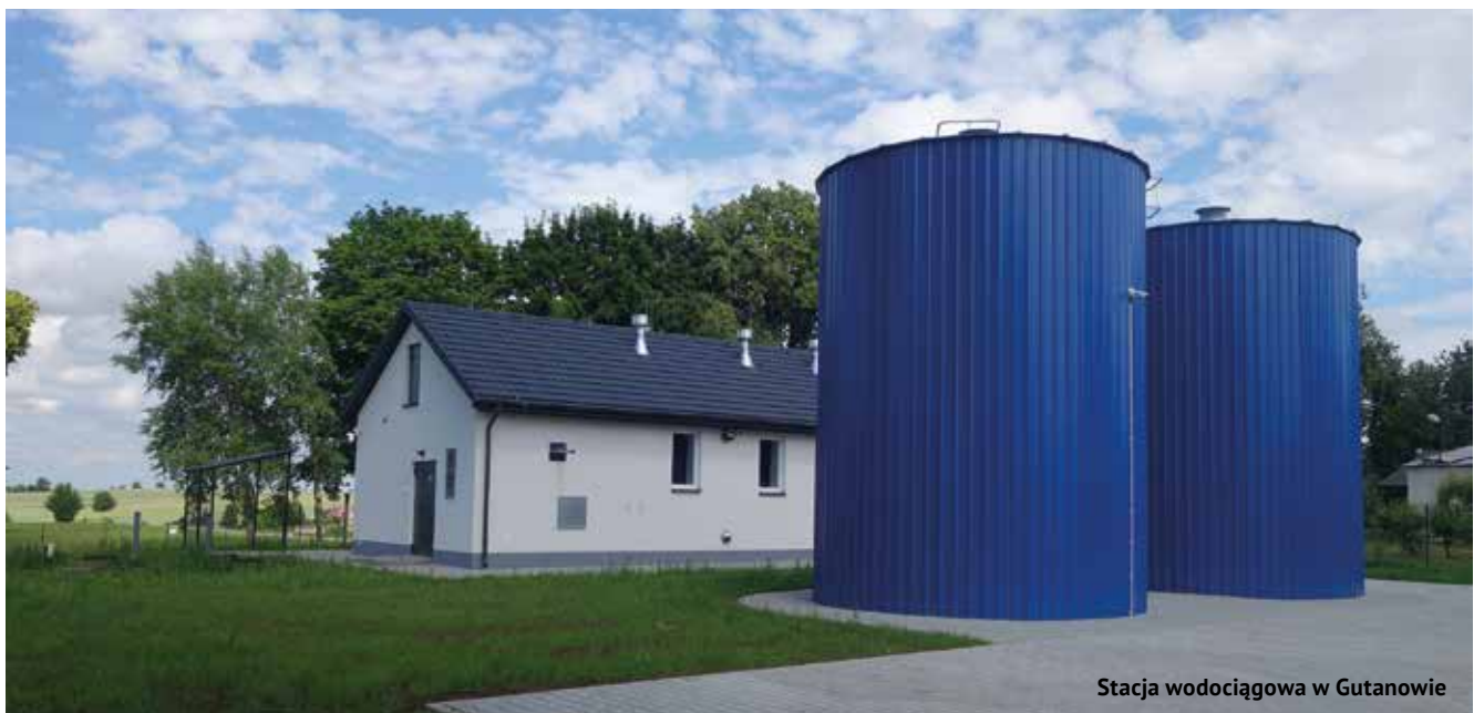
Stacja wodociągowa w Gutanowie

Trwają prace przy budowie oświetlenia drogowego przy ulicach Szkolnej i Łąkowej w Garbowie.