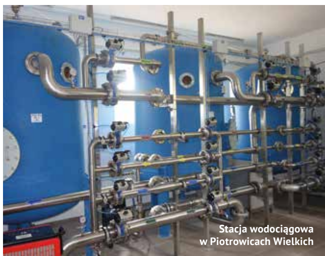
Stacja wodociągowa w Piotrowicach Wielkich

Został rozstrzygnięty przetarg na budowę chodnika o długości 165m wraz z przejściem dla pieszych na ulicy Szkolnej w Garbowie. Wpłynęło 5 ofert. Najkorzystniejszą złożyła firma LS Complex z Lublina -149.445. Najdroższa oferta opiewała na 209.161.