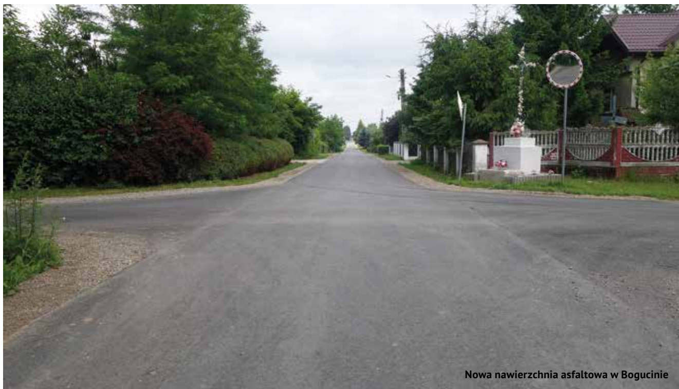
Nowa nawierzchnia asfaltowa w Bogucinie

Wykonawcą prac jest firma EL-MAZUR z Lublina. Wartość prac wynosi 138.787. Budowa oświetlenia powinna być zrealizowana do końca czerwca 2024.