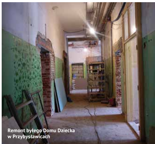
Remont byłego Domu Dziecka w Przybysławicach

Został rozstrzygnięty przetarg na budowę dróg w Gutanowie. Droga wewnętrzna o długości 318m oraz droga gminna o długości 470m. Wpłynęło 9 ofert. Najkorzystniejsza firma Rolbud z Chodla opiewa na 498.591, najdroższa to 823.449.