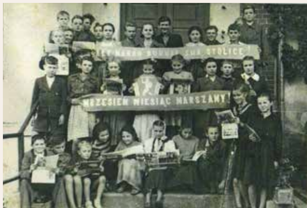
Szkolne Koło Odbudowy Warszawy 1954 r.