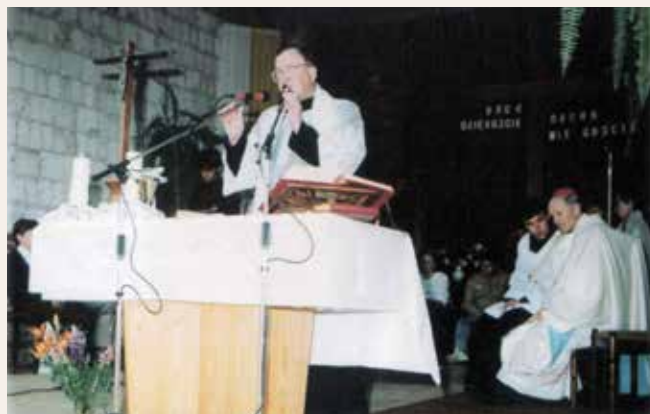
16.06.1991r . Wbudowanie kamienia węgielnego