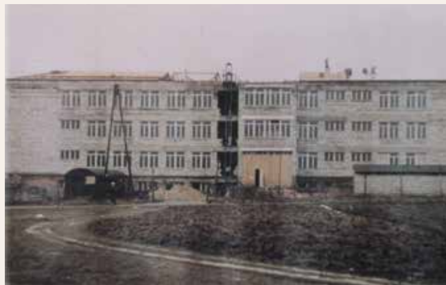
Budowa nowej szkoły