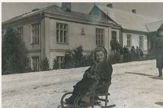
Zimą przy Garbowskiej szkole