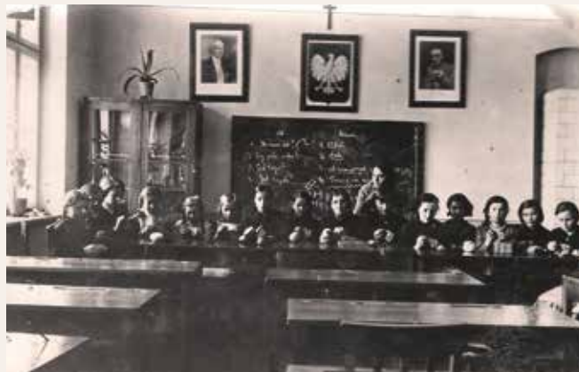
Sala lekcyjna – 1934 r.