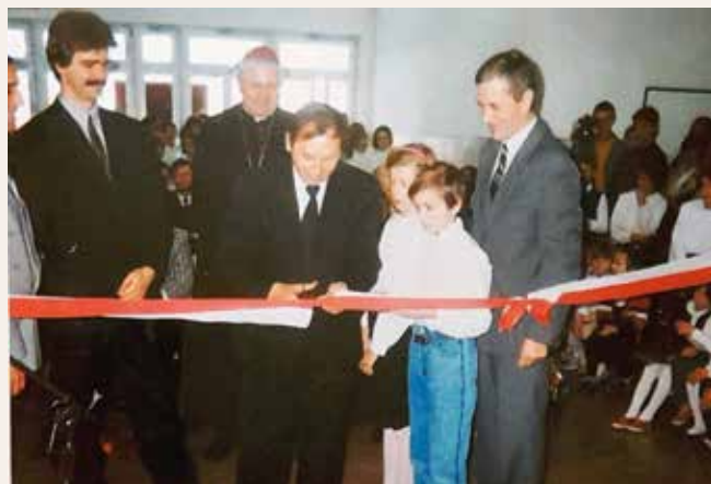
Otwarcie Nowej Szkoły 23.11.1993 r.