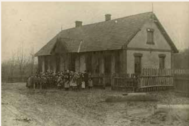
Budynek szkoły zdjęcie z 1915r.