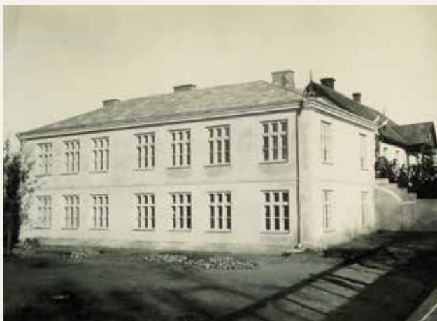
Otwarcie nowego budynku szkoły - 1934 r.