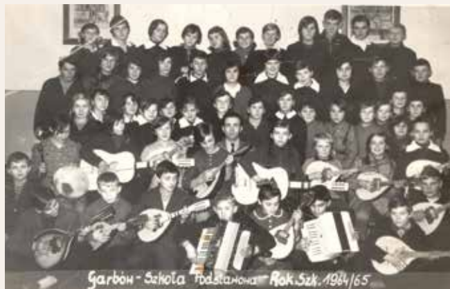
Ognisko muzyczne 1964/65