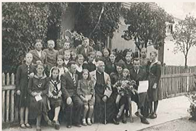
Absolwenci szkoły, kl VII - 1940r.