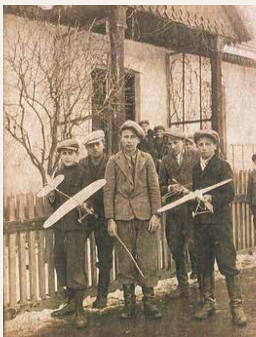
Uczniowie z modelami samolotów 1939r