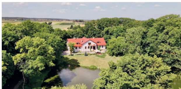
FOT. MADE SP.ANE

Z satysfakcją informujemy, że w Łopienniku, w miejscu dawnego dworu Kochanowskich powstaje prywatny dom opieki nad osobami starszymi. Ma to być miejsce o podwyższonym standardzie, oferujące bezpieczeństwo, komfort, całodobową, profesjonalną opie-