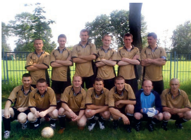
Drużyna rok 2005