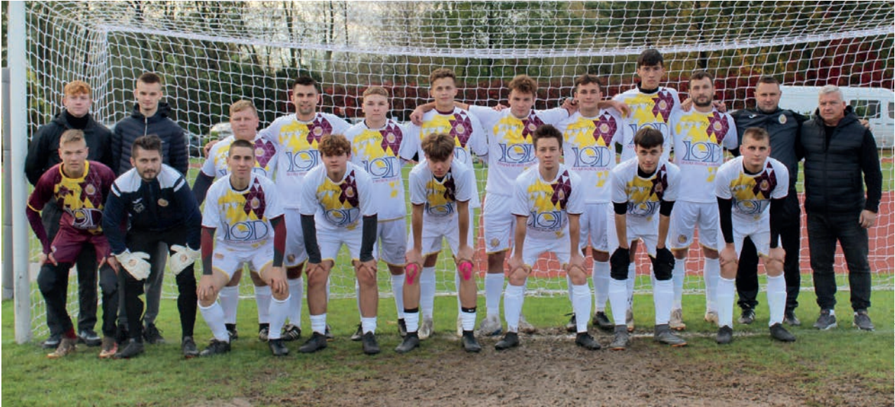
Obecna kadra w nowych strojach

Gminny Klub Sportowy „PERŁA” Borzechów ma już 20 lat. Uroczystości jubileuszowe odbyły się we wrześniu 2023 roku.