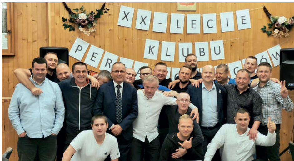
Byli zawodnicy i trenerzy teraz