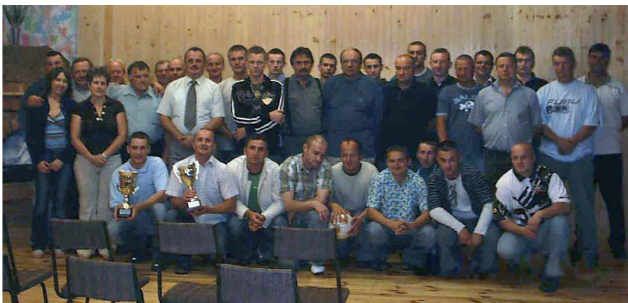
Rok 2006 zawodnicy kibice i działacze klubu