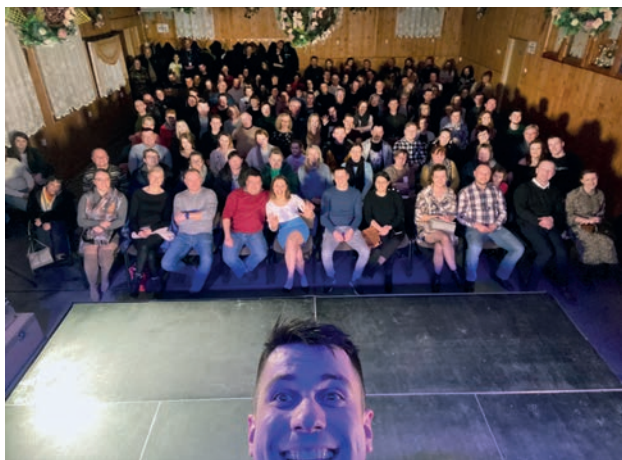
FOT. KABARET FIFRA-RAFA

Przez dwa wieczory program kabaretowy „Rodzina Plus” obejrzało łącznie około 250 osób. Na widowni zasiadli przede wszystkim widzowie z Borzechowa i okolic, ale widowisko przyciągnęło również widzów z Kraśnika,