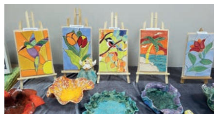
FOT. MATERIAŁ ORGANIZATORA