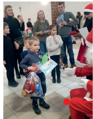
FOT. AGNIESZKA KŁOCZ/WATERBURY ORGANIZATORZY