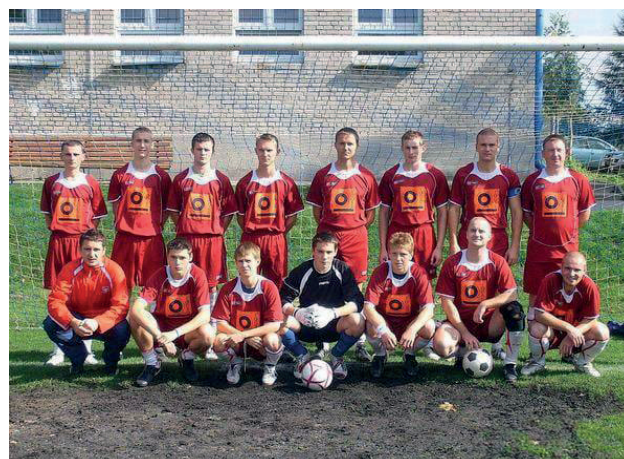
Drużyna rok 2008