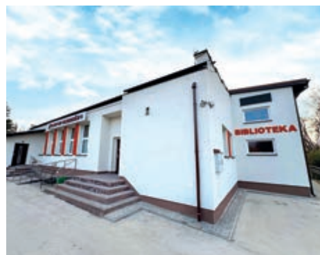
Gminna Biblioteka Publiczna w Borzechowie