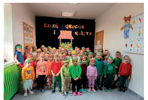
Dzień warzyw i owoców- Przedszkole w Łuszczowie