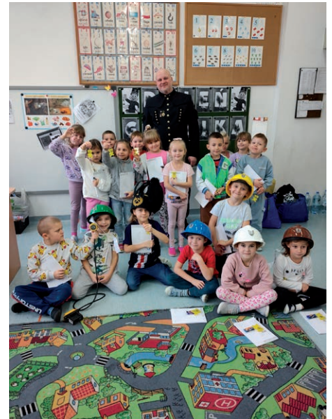
Barbórka - Przedszkole ZSP w Pliszczynie