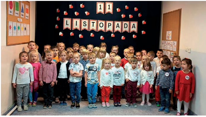
11 listopada- Przedszkole w Łuszczowie