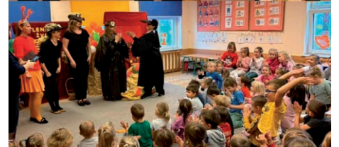
Dzień Jeża - Samorządowe Przedszkole Marysienka w Turce