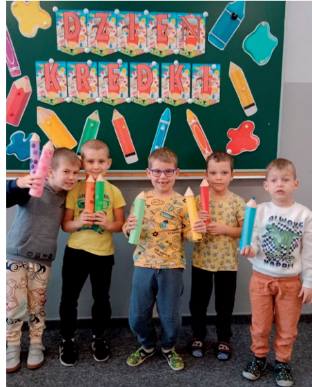
Dzień Kredki w Skrzatach w ZSP w Świdniku Małym