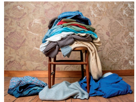
Co zrobić z odzieżą i tekstyliami?

Zmiany te mają na celu zwiększenie recyklingu i zmniejszenie ilości odpadów trafia-