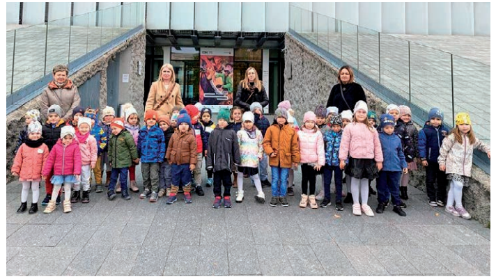
Wyjazd do teatru- Przedszkole w Łuszczowie