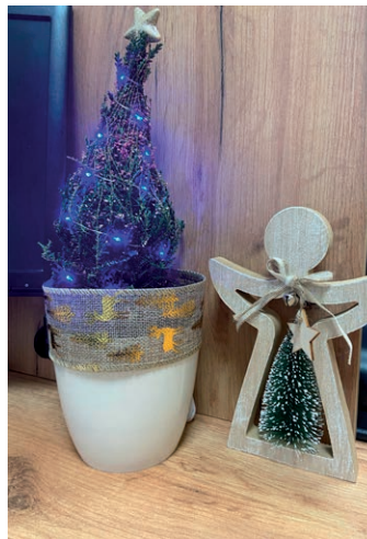
Autor: Anna Batyra