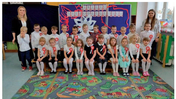
Święto Niepodległości- Przedszkole ZSP w Pliszczynie