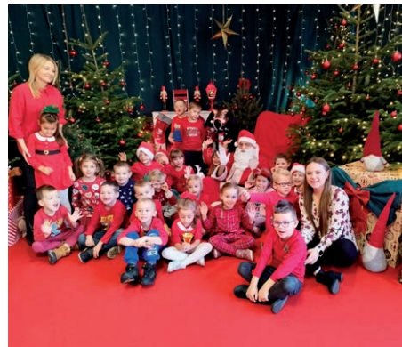
Mikołajki- Przedszkole ZSP w Pliszczynie