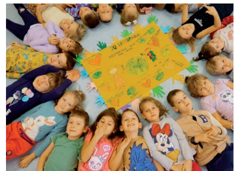
Międzynarodowy Dzień Praw Dziecka - Przedszkole ZSP w Pliszczynie