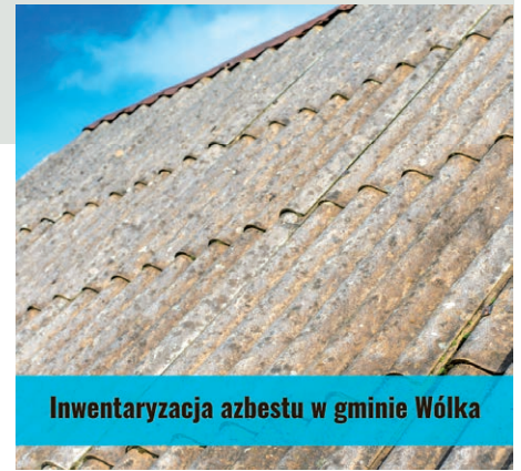
Inwentaryzacja azbestu w gminie Wólka

Zgodnie z „Programem Oczyszczania Kraju z Azbestu na lata 2009–2032”, do końca 2032 roku wszystkie wyroby zawierające azbest muszą zostać usunięte i unieszkodli-