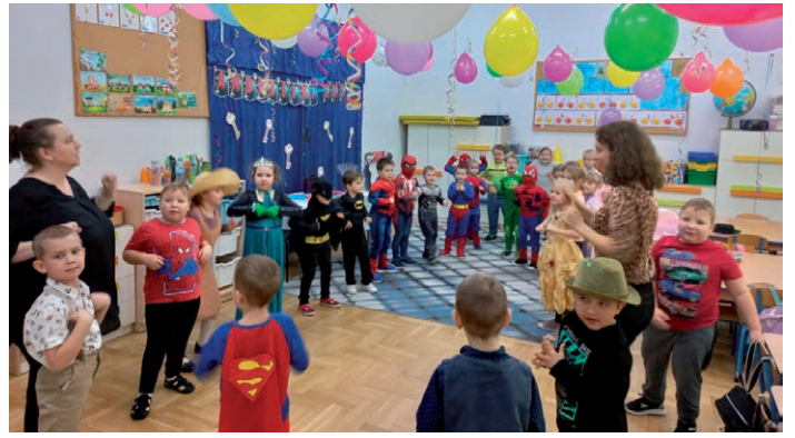
Andrzejki w Przedszkolu w ZSP w Świdniku Małym