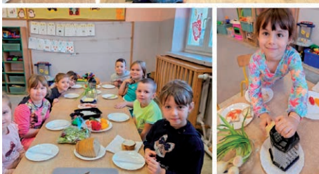
Smacznie-zdrowo-kolorowo - Samorządowe Przedszkole Marysienka w Turce