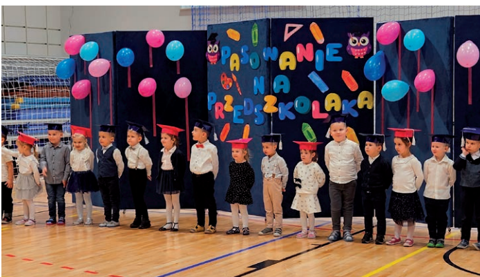
Pasowanie na przedszkolaka- Przedszkole w Łuszczowie