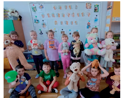
Dzień Pluszowego Misia w Przedszkolu w ZSP w Świdniku Małym