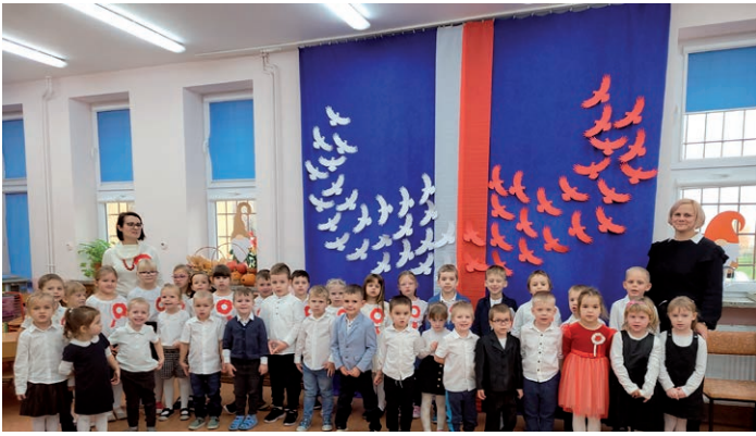
szkoła do hymnu - Zerowka, Stokrotki ZSP Sobianowice