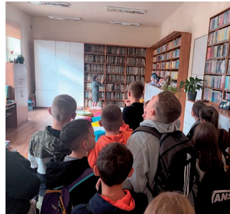
Poczytajka biblioteka ZSP w Turce

uczniowie złożyli uroczyste ślubowanie i zostali pasowani na czytelników. Każdy otrzymał dyplom, zakładkę i słodki upominek.