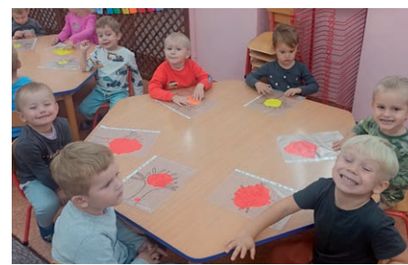
Małe Stopy ZSP Sobianowice Projekt edukacyjny - SenoSmyki