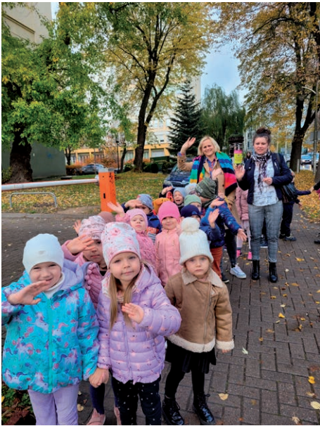
Wycieczka do teatru - Stokrotki ZSP Sobianowice