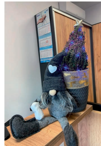
Autor: Anna Batyra