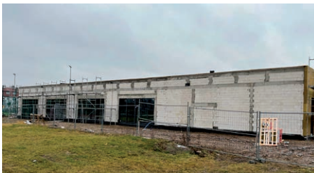
Modernizacja kompleksu sportowego „Moje Boisko – ORLIK 2012” w Turce

Realizowana jest budowa żłobka gminnego na osiedlu Borek. Wykonane zostały ściany zewnętrzne budynku, większość prac przy ściankach działowych oraz dach. Trwają końcowe prace przy wykonywanej stolarce zewnętrznej budynku. Realizowane są m.in. przyłącza sanitarne do budynku oraz początek robót przy instalacjach wewnętrznych. Docelowo ma powstać budynek parterowy na 60 dzieci wraz z placem zabaw i infrastrukturą towarzyszącą. Wartość inwestycji to około 7 mln złotych. Inwestycja realizowana w ramach Programu rozwoju instytucji opieki nad dziećmi w wieku do lat 3 Aktywny Maluch 2022-2029.