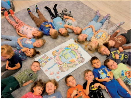
Dzień Praw Dziecka - Samorządowe Przedszkole Marysienka w Turce