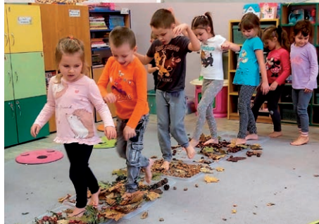
Niezwykłe jesiennie zajęcia sensoryczne - Samorządowe Przedszkole Marysienka w Turce