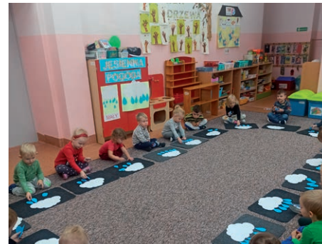
Małe stopy ZSP Sobianowice-20 minut dla matematyki i