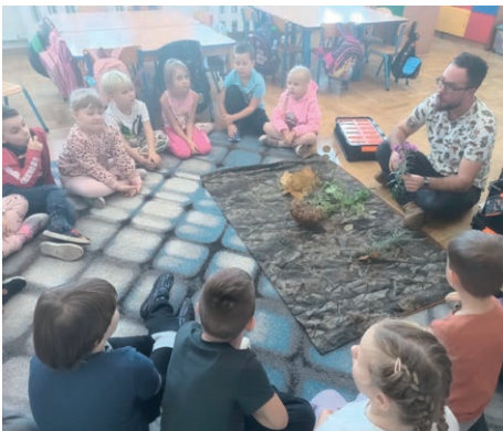
Inspektor Bywak w Przedszkolu w ZSP w Świdniku Małym