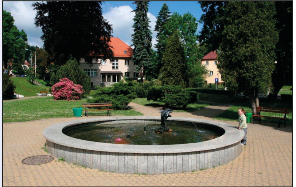
Plac przed Urzędem Miasta

- uporządkowanie ścieżek spacerowych kamieniołomu przy ul. Wałbrzyskiej i wykonanie tras do narciarstwa biegowego;