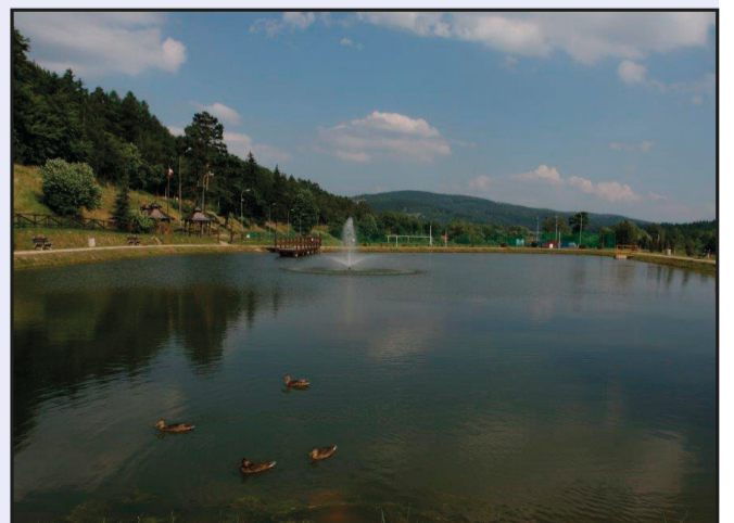
Zalew przy Promenadzie Słonecznej