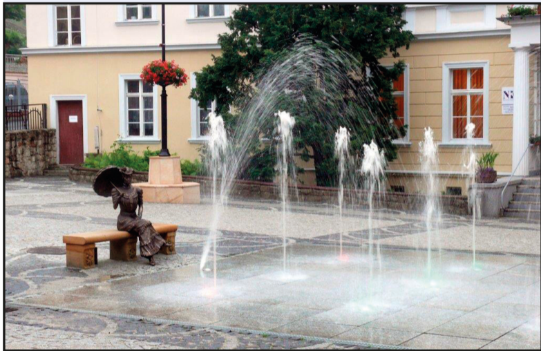
Remont nawierzchni Placu Zdrojowego, nowa fontanna i rzeźba Charlotty