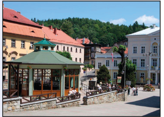
Pijalnia Wód Mineralnych i odnowione Centrum Uzdrowiska

W obrębie ulic: Moniuszki, Zakopiańskiej i Dolnej wybudowany został kolektor sanitarny wraz z przyłączami. Wartość zadania wyniosła 1,5 mln zł, a dofinansowanie około 900 tys. zł. Wykonano rewitalizację 13 budynków wielorodzinnych, w których wyremontowano dachy, klatki schodowe, ocieplenie i nowe elewacje. Prace przy tej inwestycji pochłonęły ponad 1,1 mln zł, a gmina otrzymała dofinansowanie w wysokości ponad 600 tys. zł.