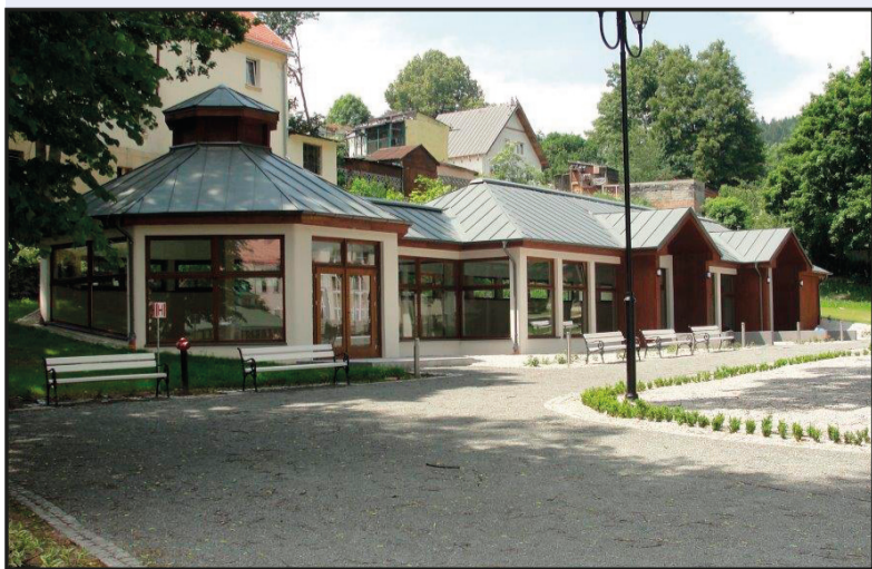
Modernizacja Parku Uzdrowskiego i budowa hali spacerowej