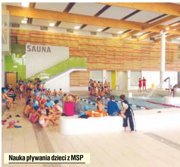
Nauka pływania dzieci z MSP