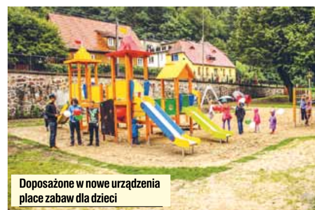
Doposażone w nowe urządzenia place zabaw dla dzieci