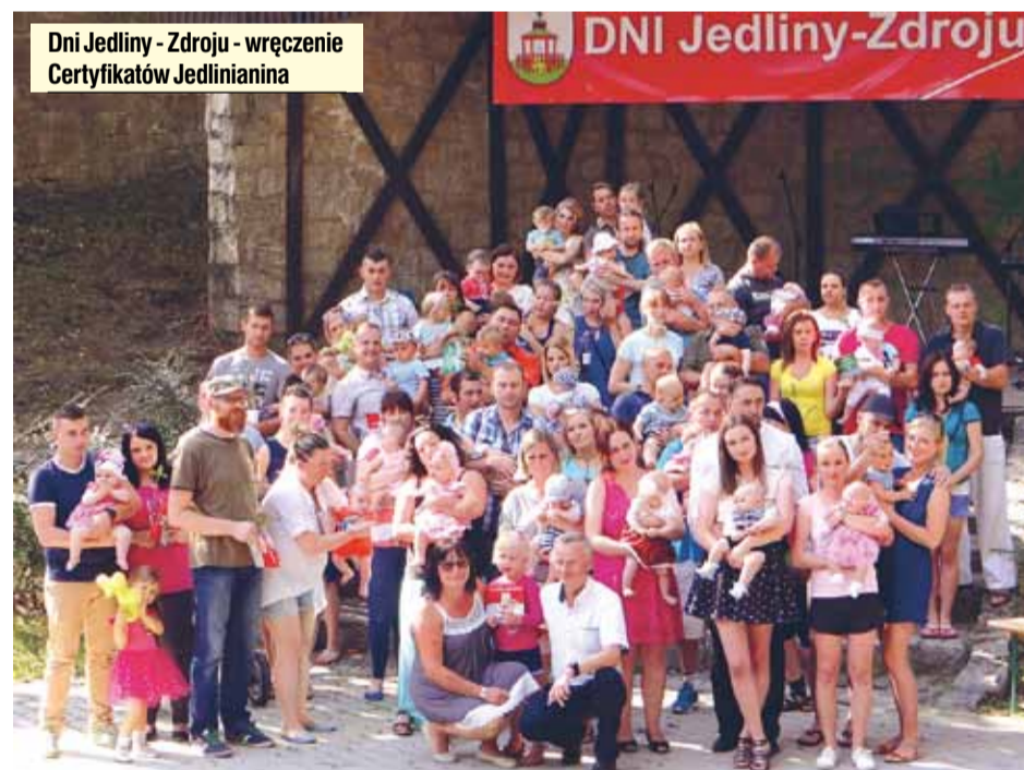
Dni Jedliny - Zdroju - wręczenie Certyfikatów Jedlinianina