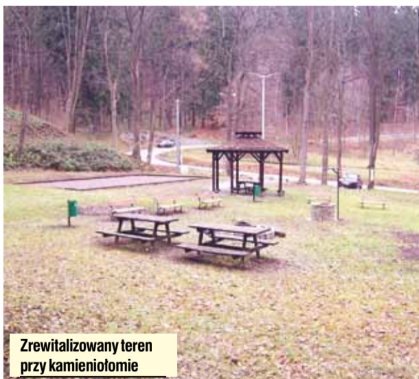
Zrewitalizowany teren przy kamieniołomie