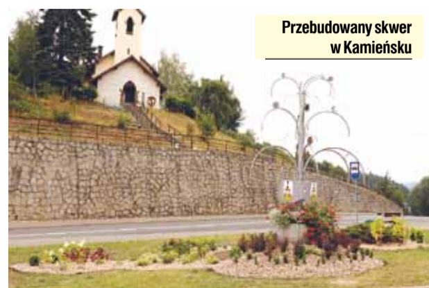
Przebudowany skwer w Kamieńsku