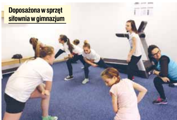
Doposażona w sprzęt siłownia w gimnazjum