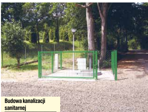
Budowa kanalizacji sanitarnej