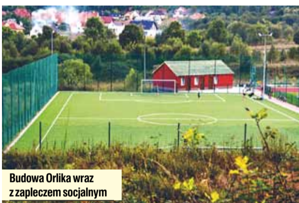
Budowa Orlika wraz z zapleczem socjalnym