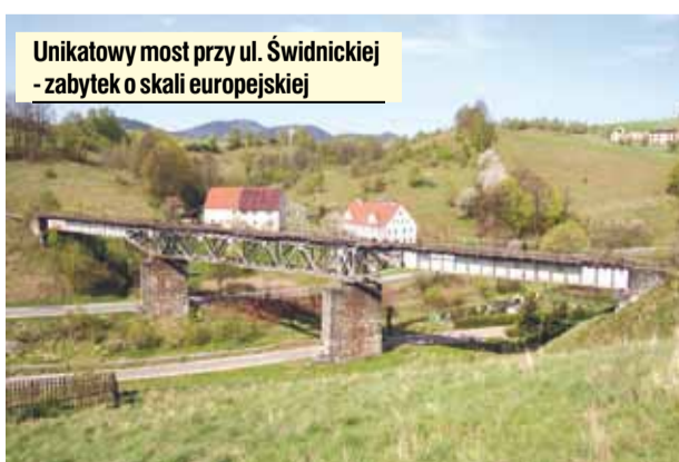
Unikatowy most przy ul. Świdnickiej - zabytek o skali europejskiej