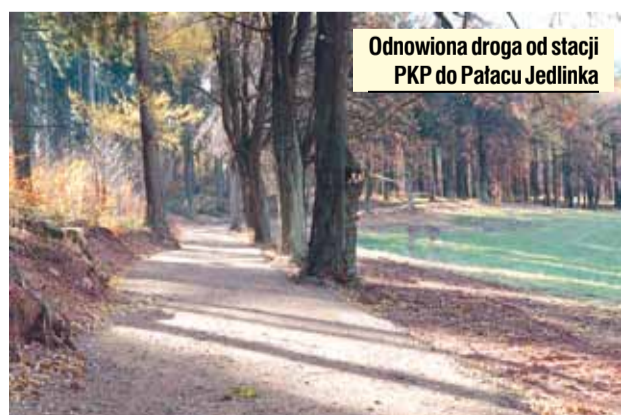
Odnowiona droga od stacji PKP do Pałacu Jedlinka