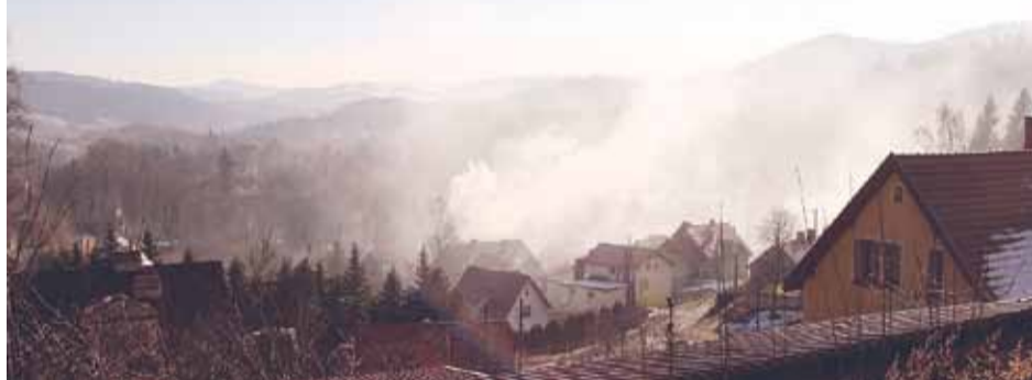
Jedlina-Zdrój przed paleniem błękitnym węglem