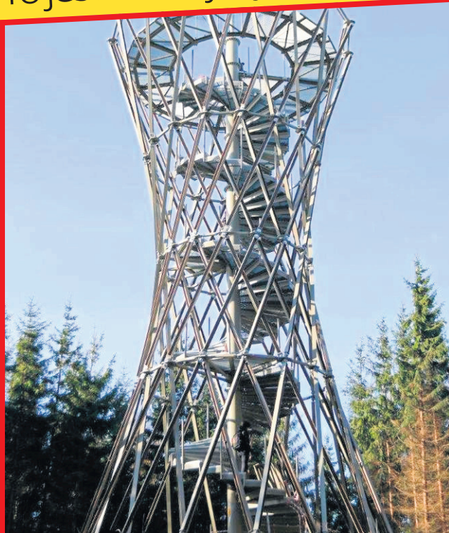
Największa atrakcja turystyczna Gór Wałbrzyskich - wieża widokowa na Borowej