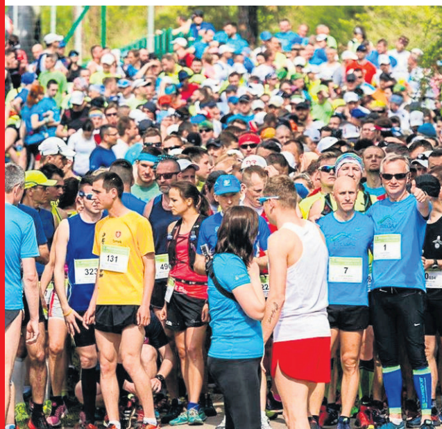
Nagrodzony wieloma medalami Półmaraton Górski to impreza, która przyciąga biegaczy z całej Polski