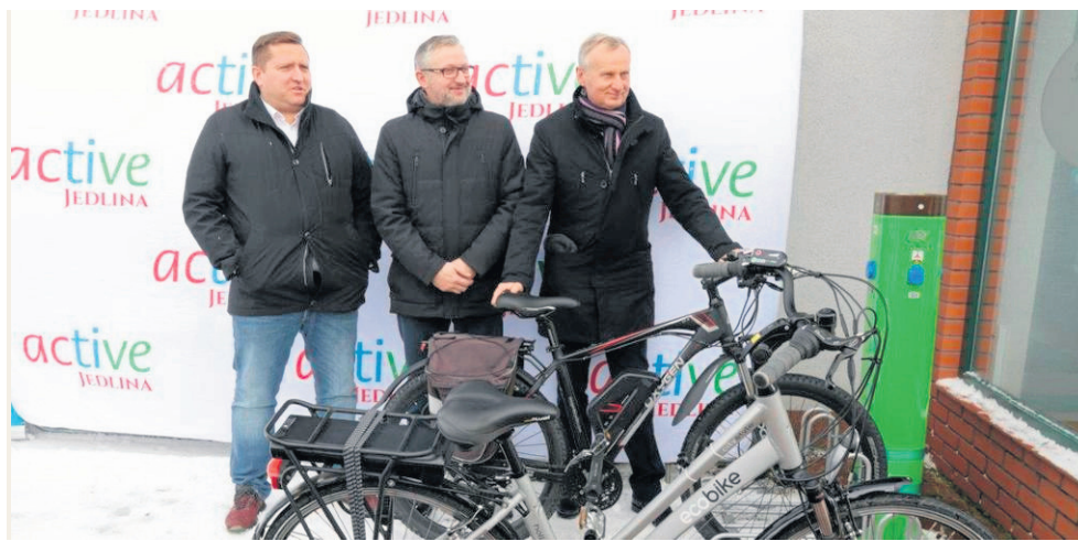
Burmistrzowie prezentują nowoczesne rowery, które zachwyciły już mieszkańców Świeradowa

bom fizycznym, które zdecydują się taki rower kupić. Gminy wystąpią m.in. do Funduszu Ochrony Środowiska, czy też będą pozyskiwać środki z projektów w ramach współpracy przygranicznej Euroregionu.