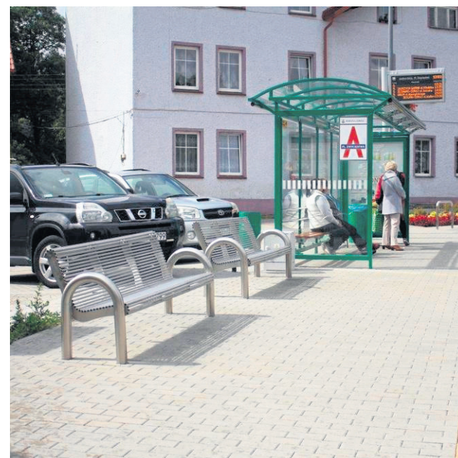
Wymienione zostały wszystkie przystanki autobusowe, powstały także nowoczesne centra przesiadkowe