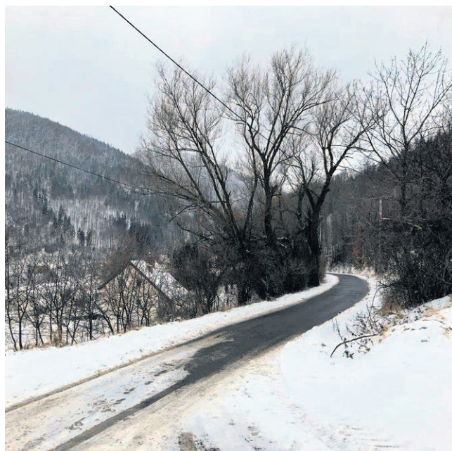
Będziemy modernizować pierwszy odcinek ul. Pokrzywianki, na której wybudujemy nowe miejsca postojowe i tzw. mijanki