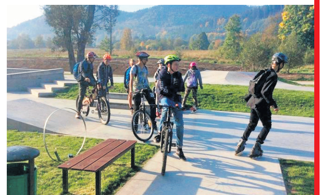
W dalszym ciągu modernizowany będzie kompleks sportowo-rekreacyjny. W okolicach Skateparku wybudujemy siłownię terenową i rowerowy tor przeszkód (pumptrack). Zadaszymy część trybun na boisku sportowym