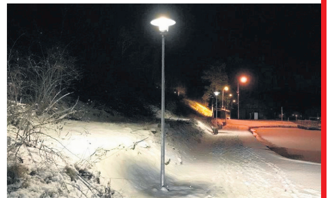
Modernizacja oświetlenia ulicznego to wymiana ponad 300 opraw na energooszczędne typu LED. Nowoczesne oświetlenie zyska także osiedle domów jednorodzinnych przy ulicach: Herberta, Norwida, Miłosza, Sikorskiego, Andersa i Zakopiańskiej