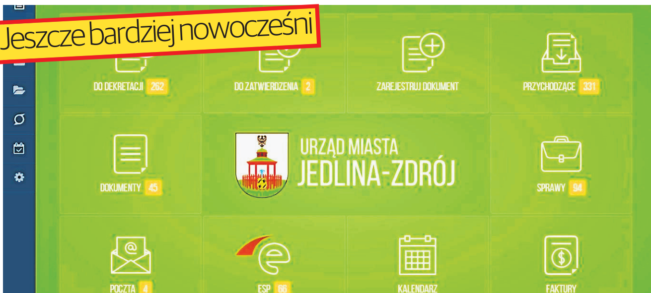
Zakończymy realizację programu E-usługi. Droga elektroniczną klienci Urzędu będą mogli załatwiać sprawy urzędowe. Wdrożona zostanie także aplikacja mobilna dla turystów