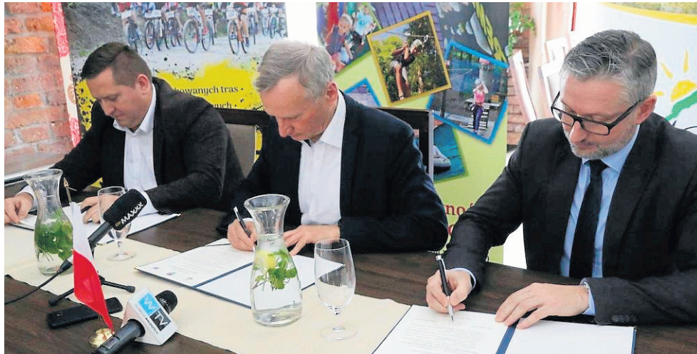
Burmistrzowie Świeradowa-Zdroju, Jedliny-Zdroju i Głuszycy podpisują Deklarację współpracy

Gminy będą też starały się pozyskać środki zewnętrzne, które pozwolą na dopłaty oso-