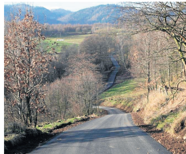
Połączyliśmy ul. Zagórską z ul. Chałubińskiego. Jest to przepiękna trasa pieszo - rowerowa