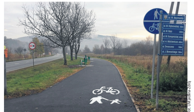
Mieszkańcy mogą już korzystać z wygodnego połączenia z centrum miasta. Można tutaj także odpocząć na ławeczkach