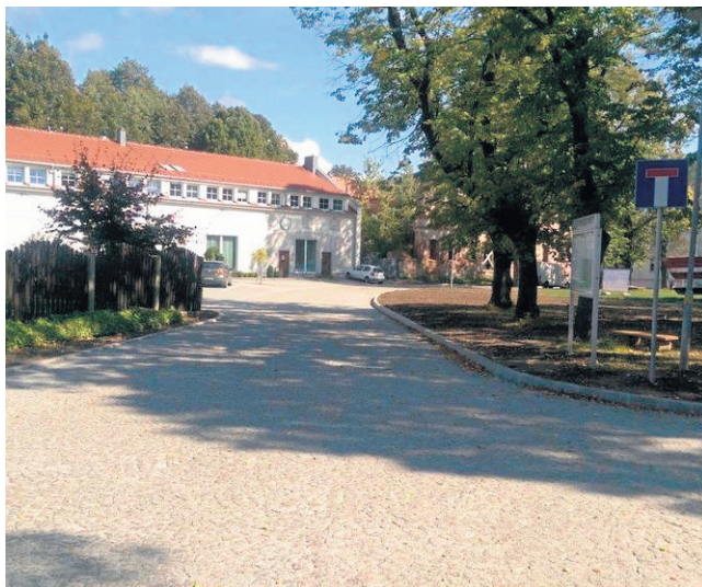
Przebudowana droga gminna ze środków unijnych wpisuje się w zabytkowy charakter kompleksu pałacowo - hotelowego