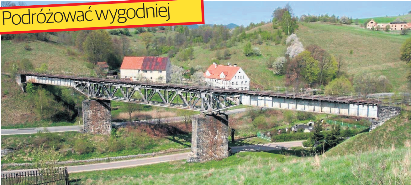
PKP PLK planuje rozpoczęcie modernizacji 1 km linii kolejowej: Jedlina – Zdrój – Zagórze Śląskie – Świdnica