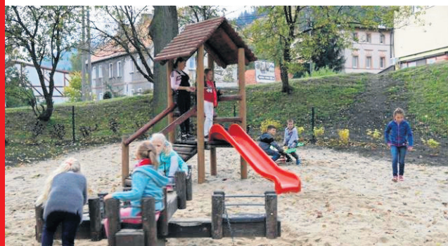
Nowocześnie wyposażony plac zabaw i siłownia terenowa przy ul. Moniuszki ucieszyła nie tylko dzieci, ale i rodziców