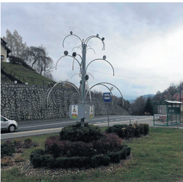
Modernizowana będzie ul. Kłodzka, od ul. Moniuszki w kierunku Kamieńska