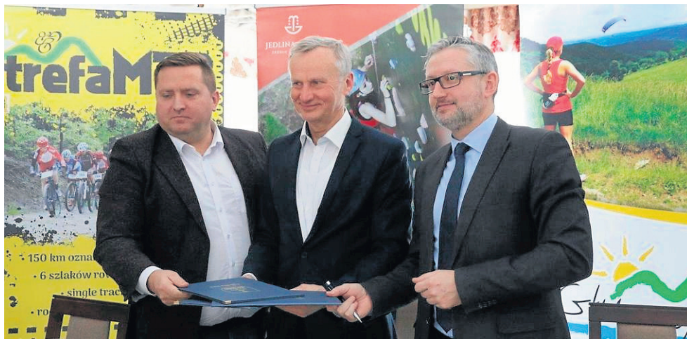
Z gotowym Listem intencyjnym w sprawie współpracy m.in. na rzecz promowania aktywności