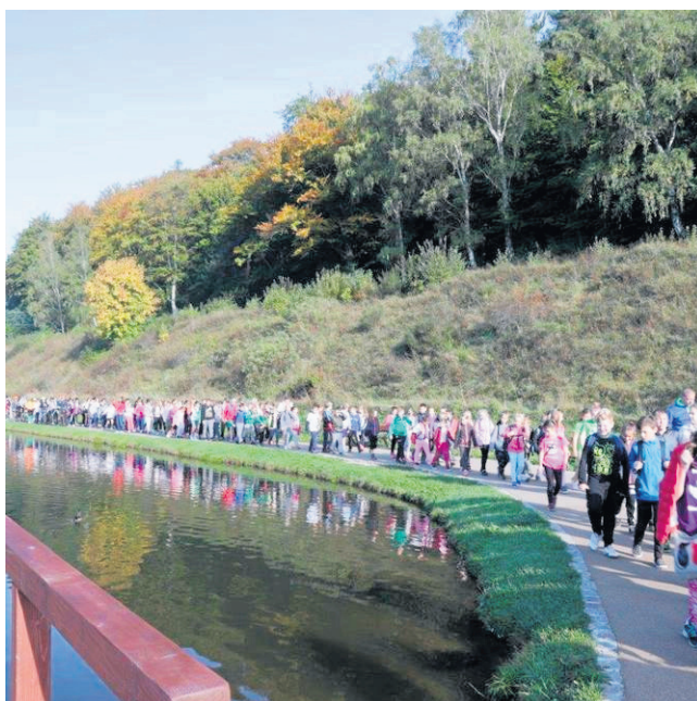
Ciąg pieszo - rowerowy - Bulwar przy ul. Kłodzkiej to także miejsce sportowo - rekreacyjne