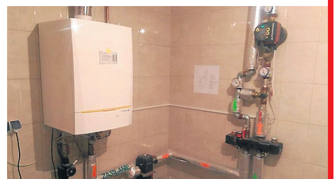
Kontynuować będziemy dopłaty do wymiany pieców centralnego ogrzewania na paliwa ekologiczne