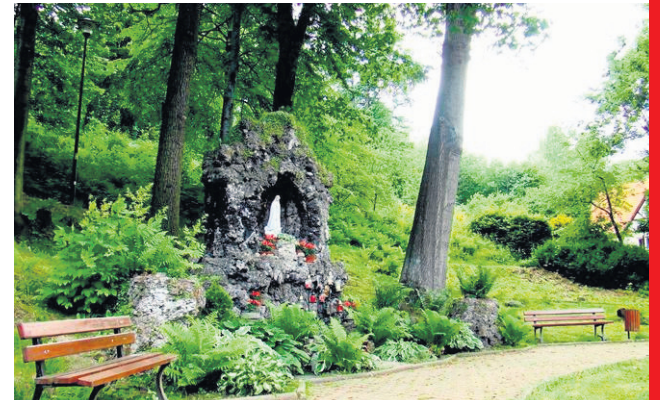
Po wygranym konkursie na rewitalizację miejsc publicznych, w Al. Niepodległości i w okolicach ul. Sienkiewicza uporządkujemy zieleni, posadzimy krzewy i kwiaty, postawimy ławki i kosze na śmieci. W centrum uzdrowiska uporządkujemy podwórkę