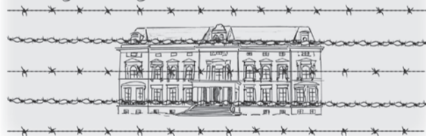
Polenlager 82 Pogrzebienie 1942 - 1945