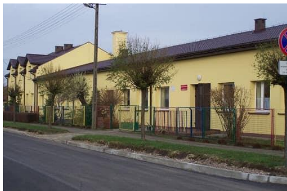
Miejskie Przedszkole w Krośniewicach