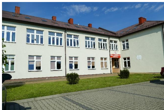
Szkoła Podstawowa nr 1 w Krośniewicach (wejście do ul. Łęczyckiej)