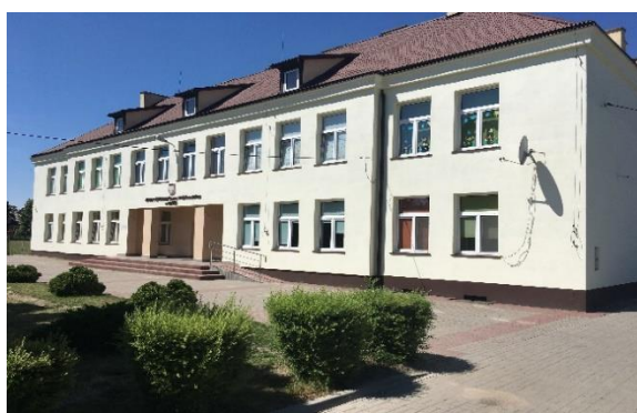
Szkoła Podstawowa w Nowem