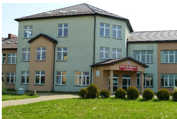
Szkoła Podstawowa nr 1 w Krośniewicach (wejście do ul. Kwiatowej)