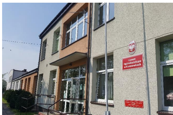
Liceum Ogólnokształcące w Krośniewicach