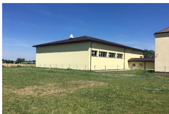
Szkoła Podstawowa w Nowem – sala gimnastyczna

Dodatkowo w 2019 r. w gminie działalność edukacyjną (w budynku użyczonym od Gminy Krośniewice) prowadziła Szkoła Podstawowa Fundacji Elementarz z Oddziałem Przedszkolnym w Jankowicach, Jankowice 32, w której funkcjonowały oddziały przedszkolne.