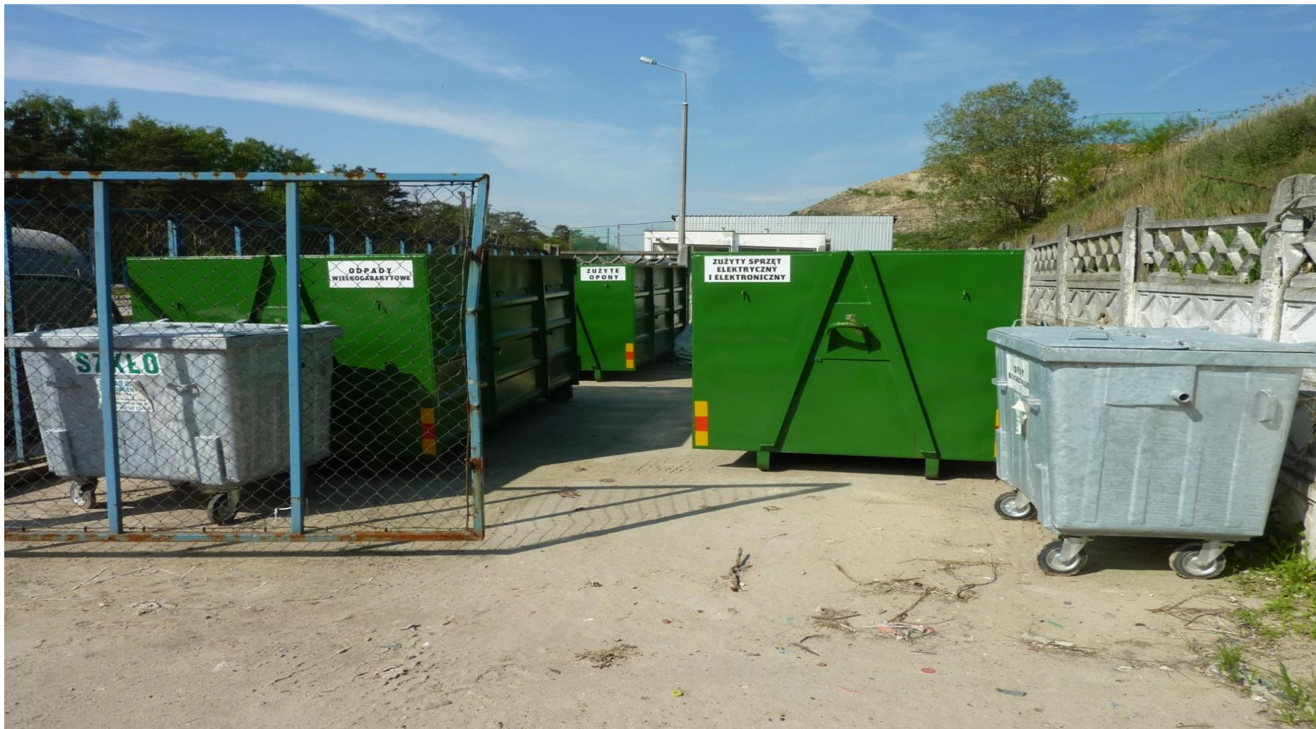
Zdjęcie 2 Punkt Selektywnej Zbiórki Odpadów Franki