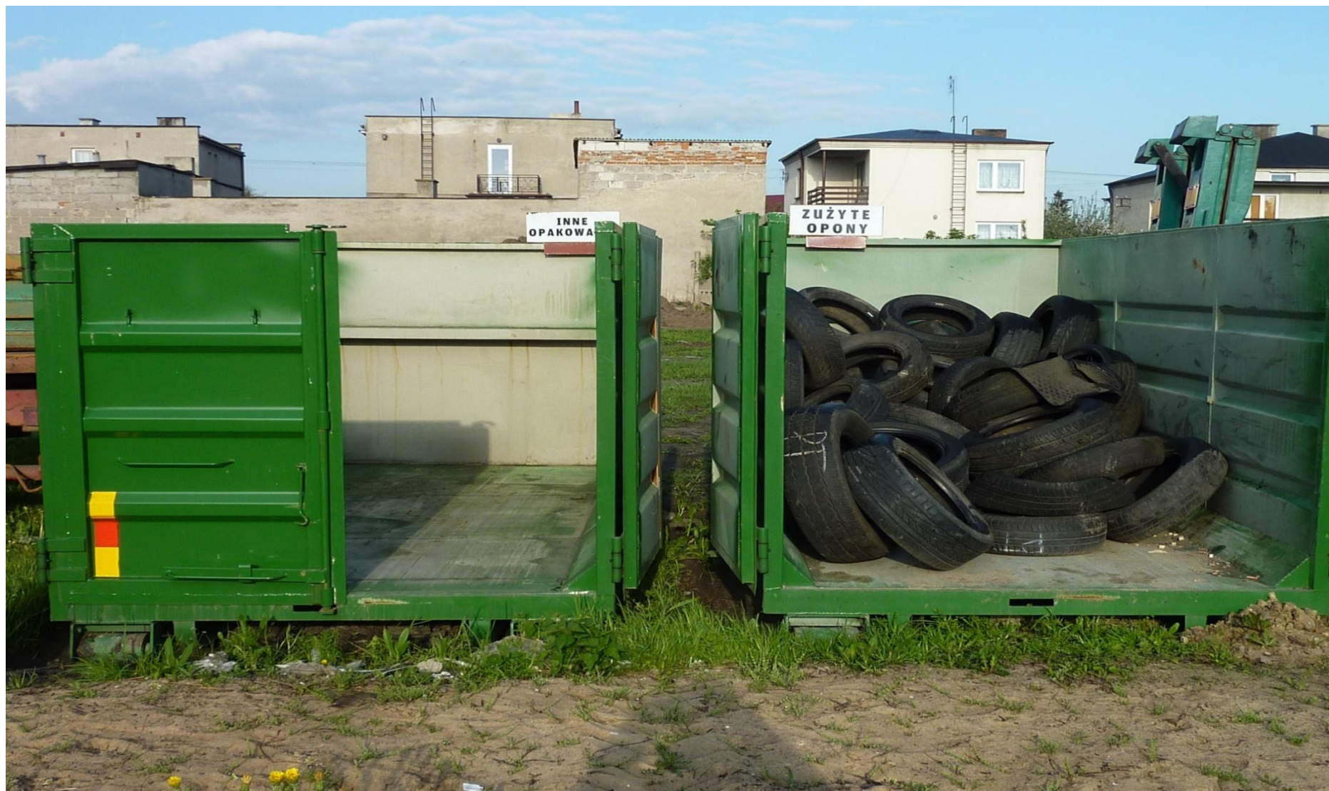
Zdjęcie 1 Punkt Selektywnej zbiórki odpadów - Krośniewice, ul. Paderewskiego 3