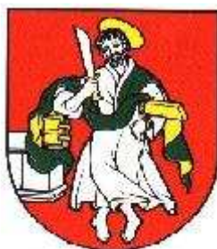
Selec - herb

Na czerwonym tle pola herbowego umieszczona jest srebrna postać świętego. Jego prawa dłoń uniesiona do góry trzyma długi, srebrny nóż ze złotą rękojeścią. Święty opiera się łokciem o spiętą, grubą, złotą księgę (Pismo Święte?) stojącą na srebrnej podstawie (prawdopodobnie bryła budynku kościoła). Spod lewego ramienia wystaje kawałek złotego ramienia krzyża do którego ze spodu jest przywiązany złotym sznurem nadgarstek lewej ręki świętego. Głowę lekko nachyloną w prawą stronę otocza złota gloria. Nogi stojącej postaci świętego skrzyżowane, jak gdyby w tańcu lub ślaniającego się. Całość uzupełnia zielony, nicowany złotem, płaszcz umieszczony z przodu postaci.