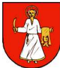
Nová Lesná - herb

Miejscowość znana jest z organizowania corocznych, tradycyjnych (od 1995 r.) zawodów sportowych – Memoriału Jána Stilla w biegu górskim na trasie Nová Lesná–Hrebienok o długości 9570 m z pokonaniem różnicy wysokości 533 m.