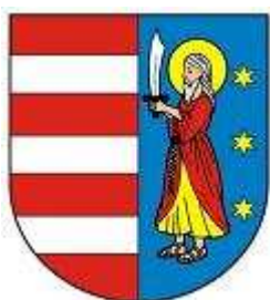
Herb powiatu opoczyńskiego

Opisane historyczne herby wykorzystane zostały przy opracowaniu herbu reaktywowanego administracyjnie od 1 stycznia 1999 roku powiatu opoczyńskiego.