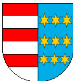
Herb Ziemi Sandomierskiej

Sandomiriensis terra tercia in ordine, que tres pro prima parte barras glaucas et rubeas portat, in secunda triplicem ordinem stellarum, et quolibet ordine quatuor stellas, in campo celestino defert.