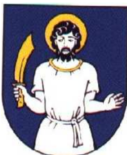
Herb miejscowości Vricko

Postać św. Bartłomieja umieszczoną w herbie miejscowości Vricko (pow. Martin, woj. Žilina) miałem okazję ujrzeć aż podczas przeglądania wraz z rodzicami, ekspozycji twórczości współczesnej heraldyki słowackiej prezentowanej w jednej z sal zamku w Trenčine (Trenczynie) w dniu 8 lipca 2000. I to niestety tylko w formie czarnobiałej odbitki pieczęci gminnej. Później jednak w jednej ze słowackich publikacji turystycznych natrafiłem przypadkowo na kolorowy herb miejscowości i dlatego mogłem opisać jego wygląd.