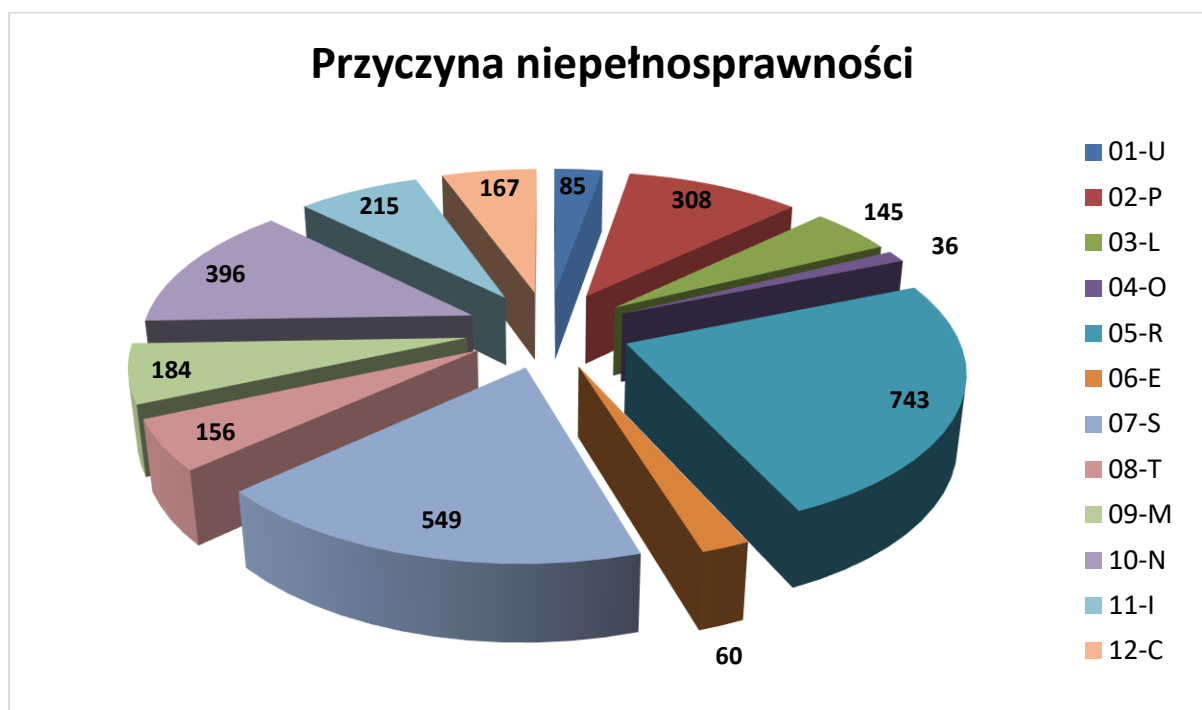
Wykres nr 1. Liczba wydanych orzeczeń z podziałem na przyczynę niepełnosprawności.