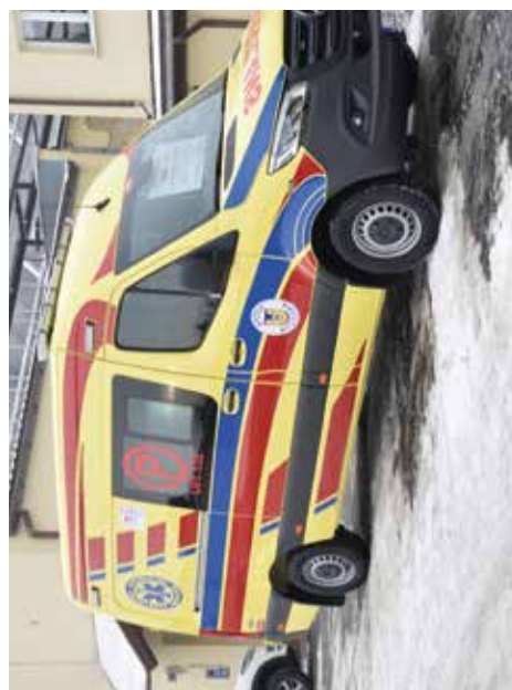
Nowy Ambulans w SPZOZ w Bychawie