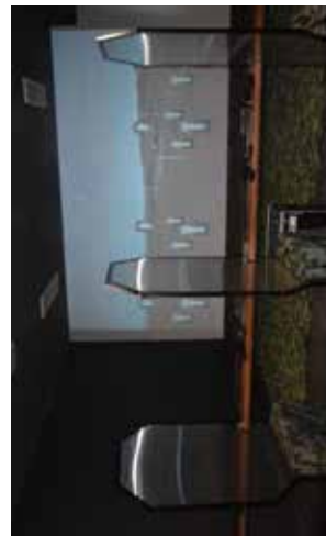
Strzelnica Wirtualna w Bychawie