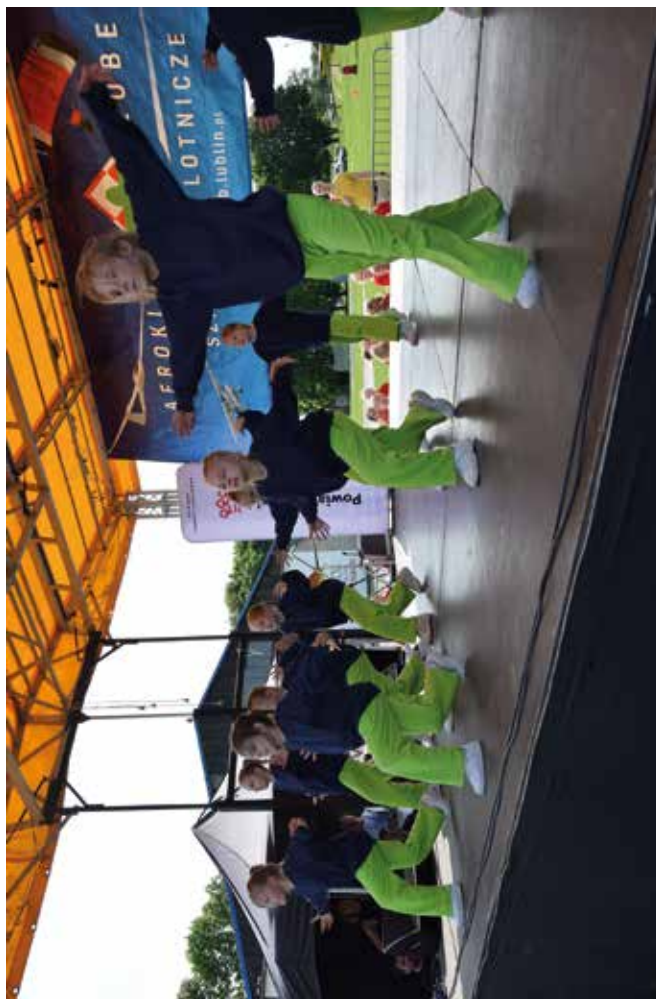
Lotniczy Dzień Dziecka w Radawcu