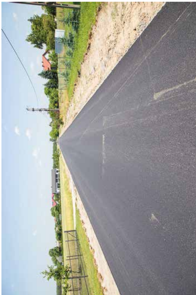
Otwarcie drogi w miejscowości Niedrzwica Duża