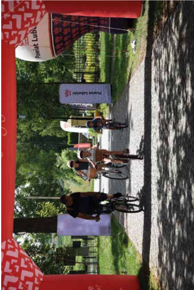
Rajd rowerowy pn. „Tour de Lubelskie” w Jastkowie