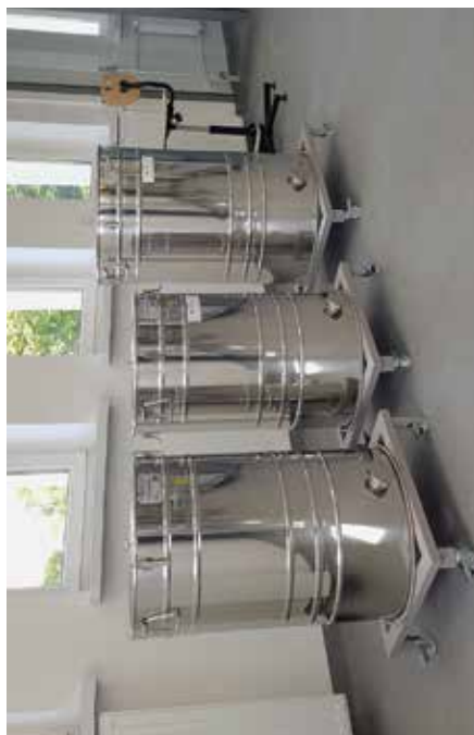
Inkubator Pszczelarstwa w Pszczelnej Woli