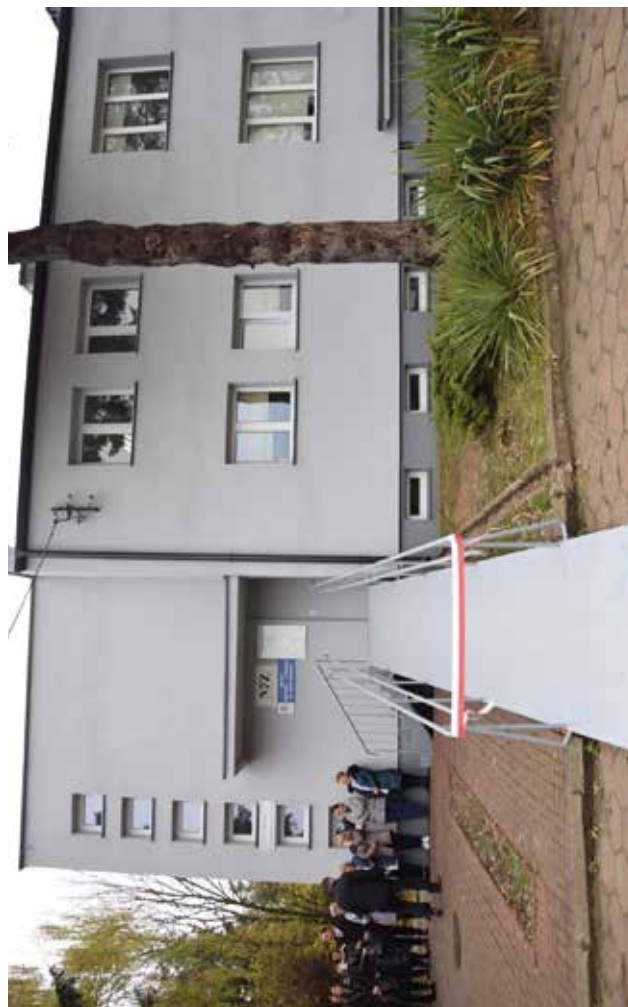
Ośrodek Zdrowia w Krzczonowie