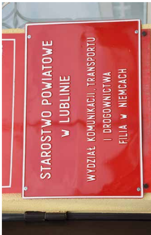
Otwarcie Filii Wydział Komunikacji, Transportu i Drogownictwa w Niemcach