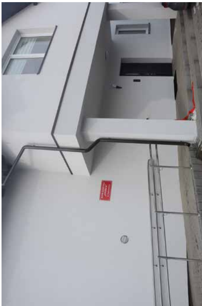
Przebudowa i rozbudowa budynku Domu Dziecka w Dąbrowicy