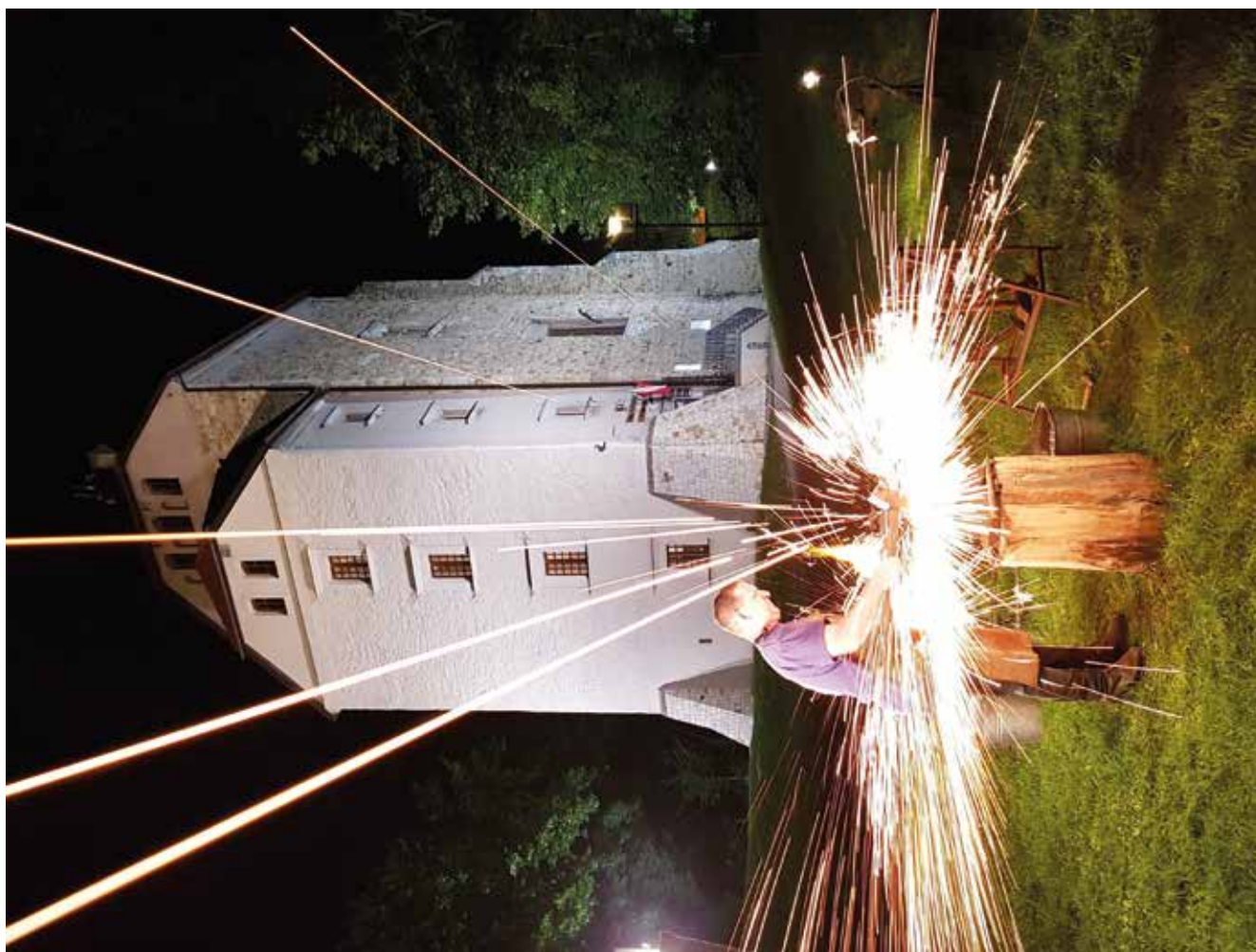
Ogólnopolskie Spotkania Kowali w Wojciechowie