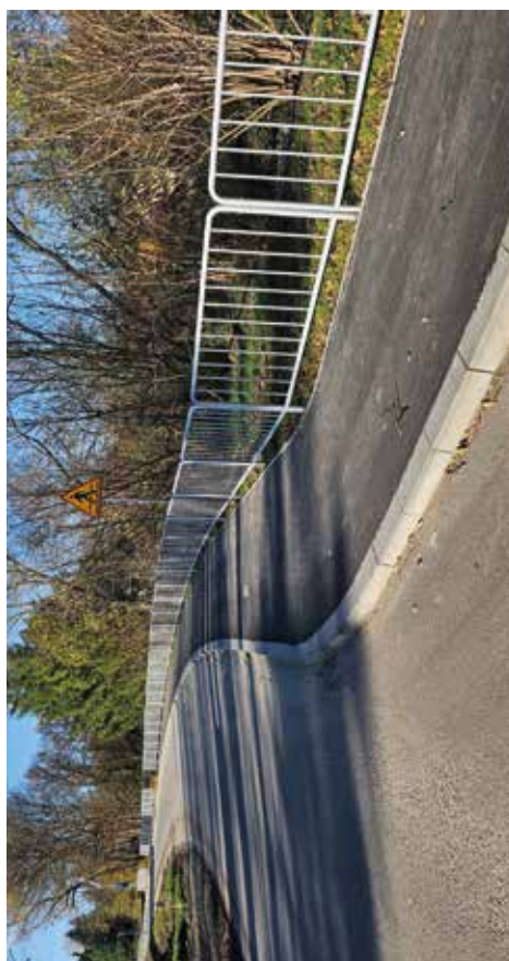
Budowa chodnika w miejscowości Gietrzew Pierwsza gmina Wysokie w ciągu drogi powiatowej nr 2129L