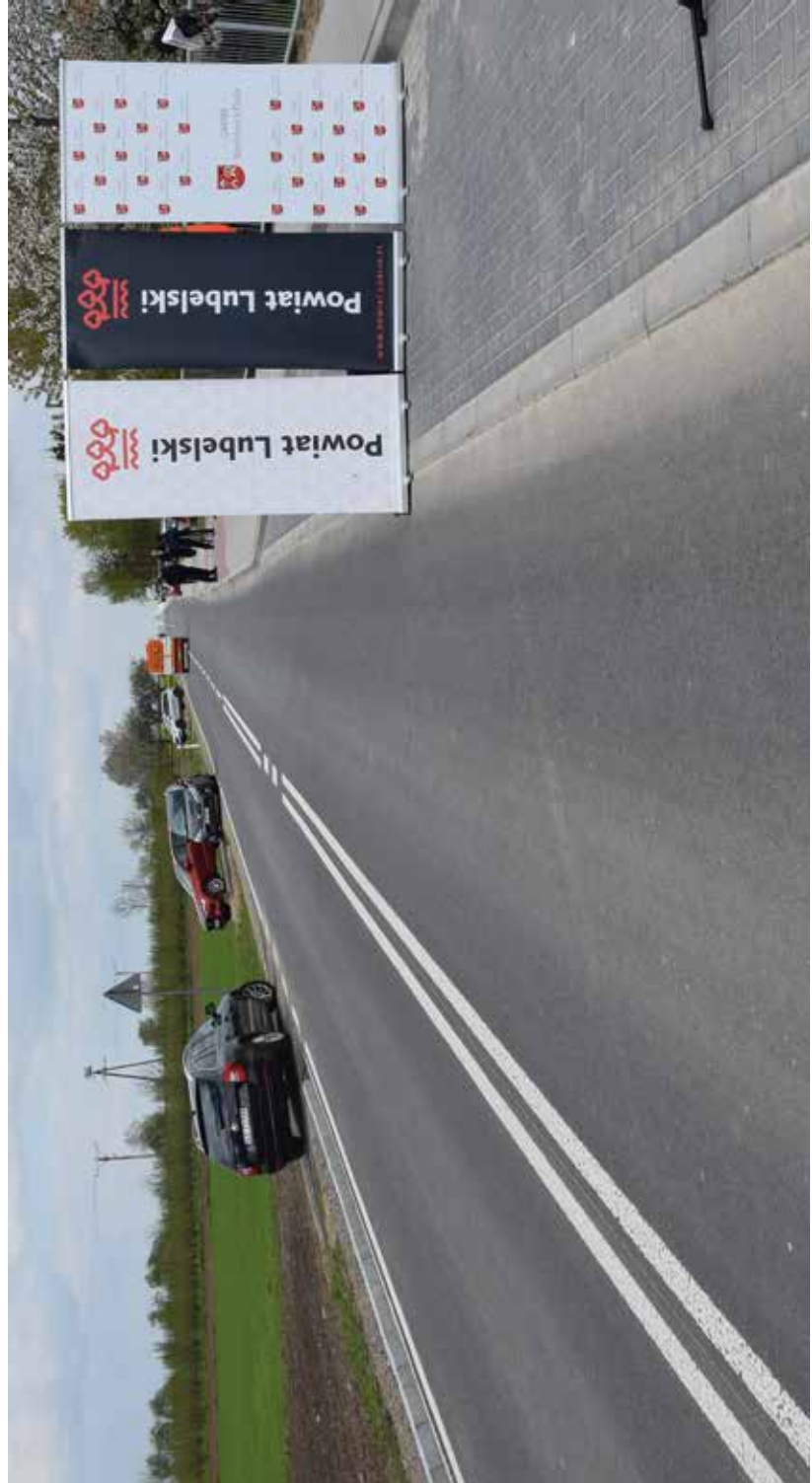
Otwarcie drogi w miejscowości Osina