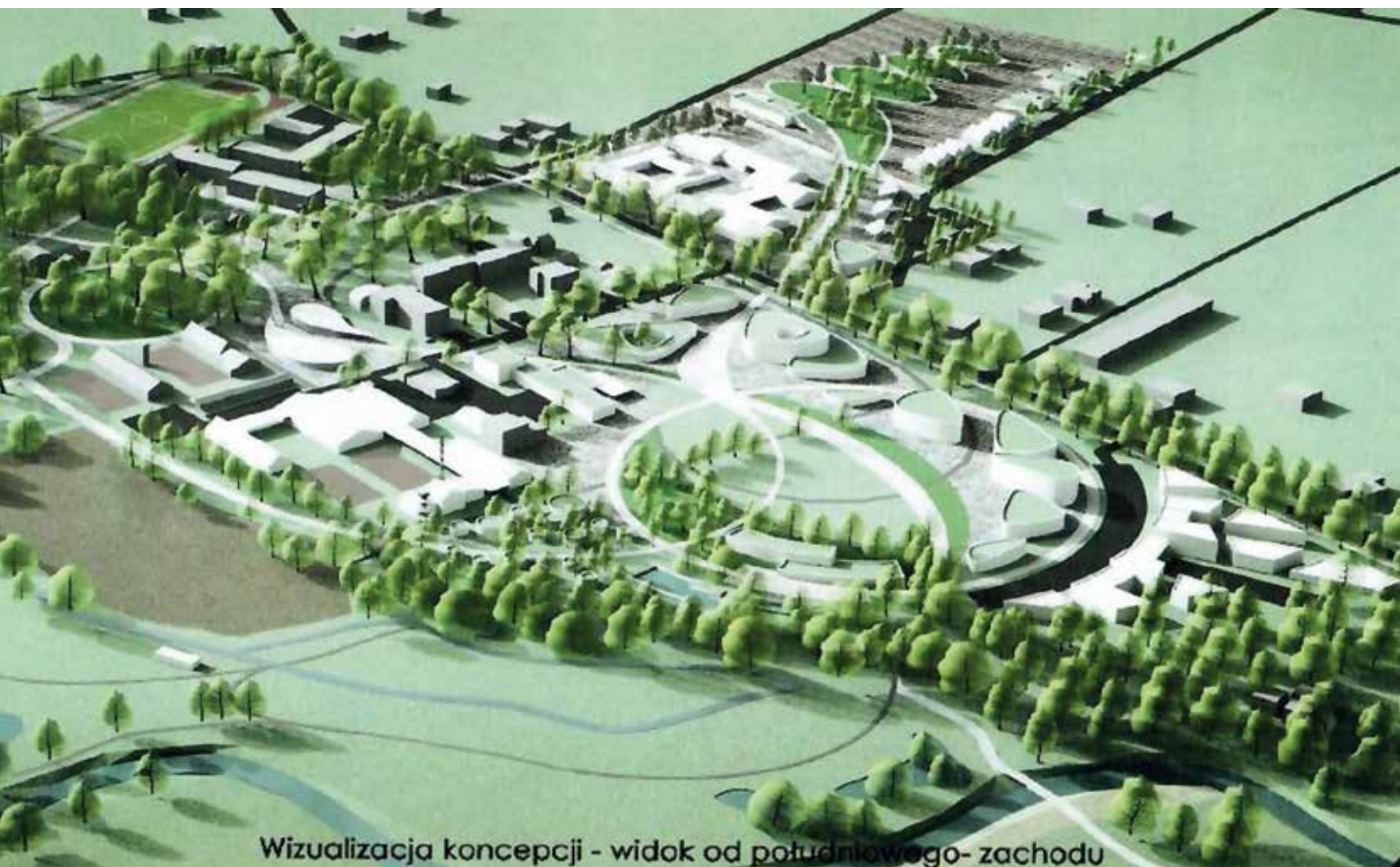
Wizualizacja koncepcji - widok od południowego zachodu

„Prawdziwy patriotyzm nie tylko polega na tym, ażeby kochać jakąś idealną ojczyznę, ale – ażeby kochać, badać i pracować dla realnych składników tej ojczyzny, którymi są ziemia, społeczeństwo, ludzie i wszelkie ich bogactwa”.