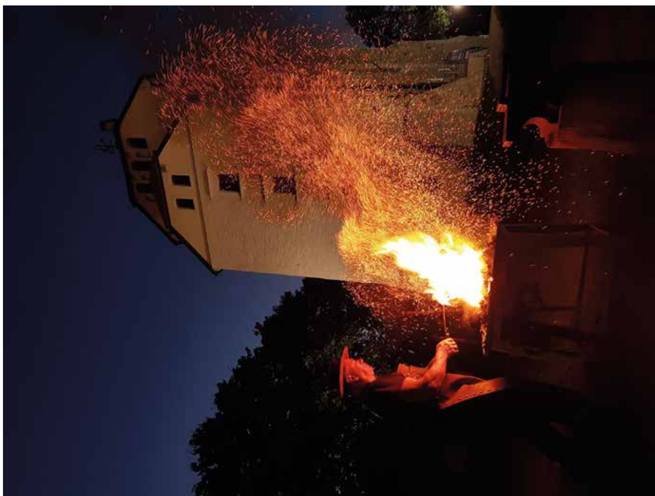
Ogólnopolskie Spotkania Kowali w Wojciechowie