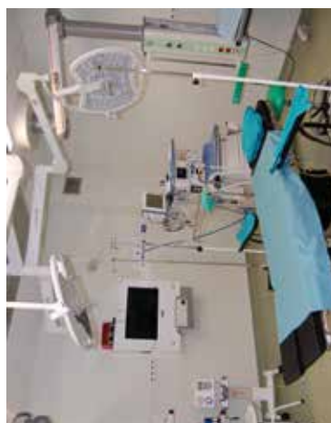
Blok operacyjny w SPZOZ Nr 1 w Bełżycach