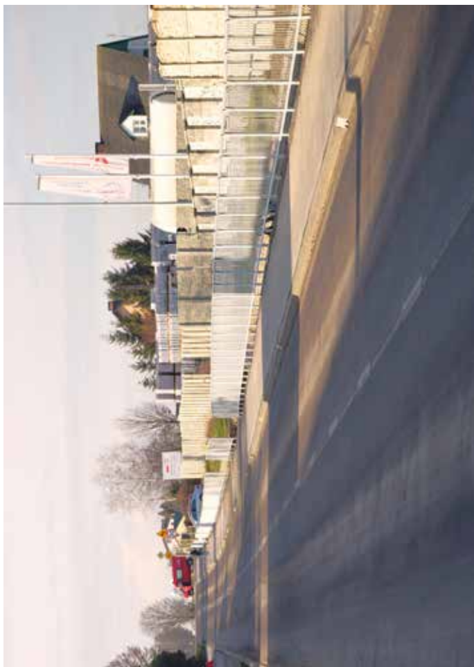
Otwarcie drogi w miejscowości Niedrzwica Duża