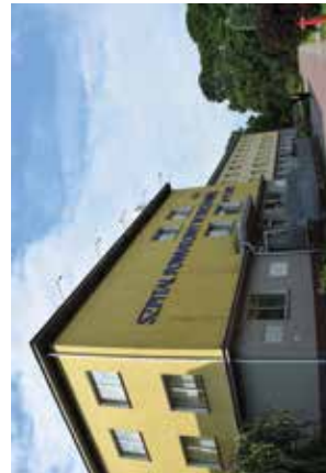
SPZOZ w Bychawie