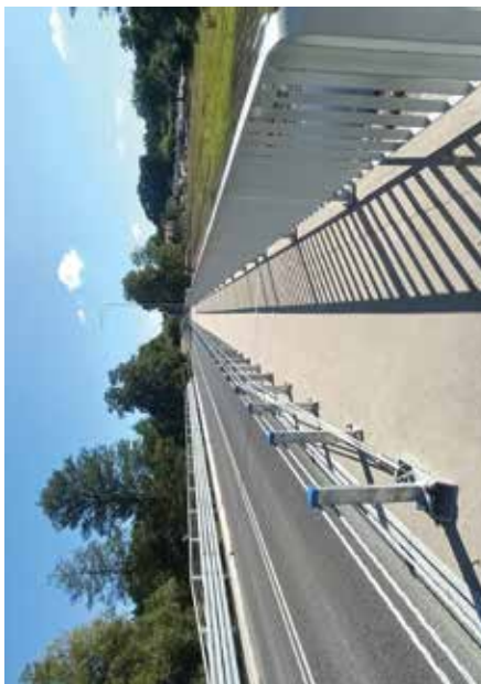
Most w Osmolicach