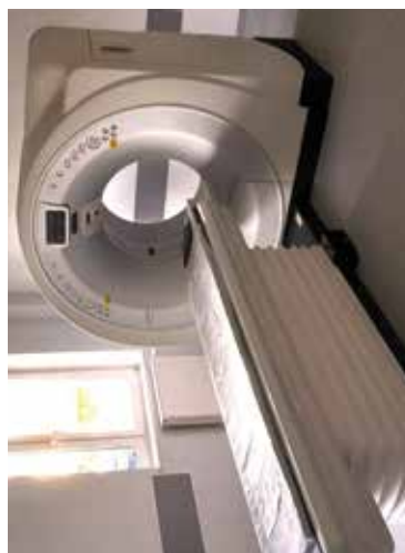
Tomograf w SPZOZ Nr 1 w Bełżycach