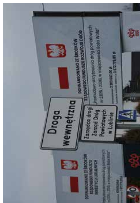
Przebudowa skrzyżowania dróg powiatowych w miejscowości Boża Wola