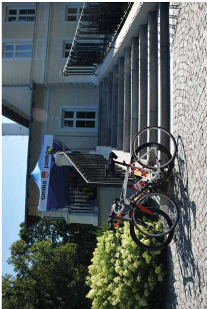
Rajd rowerowy pn. „Tour de Lubelskie” w Jastkowie