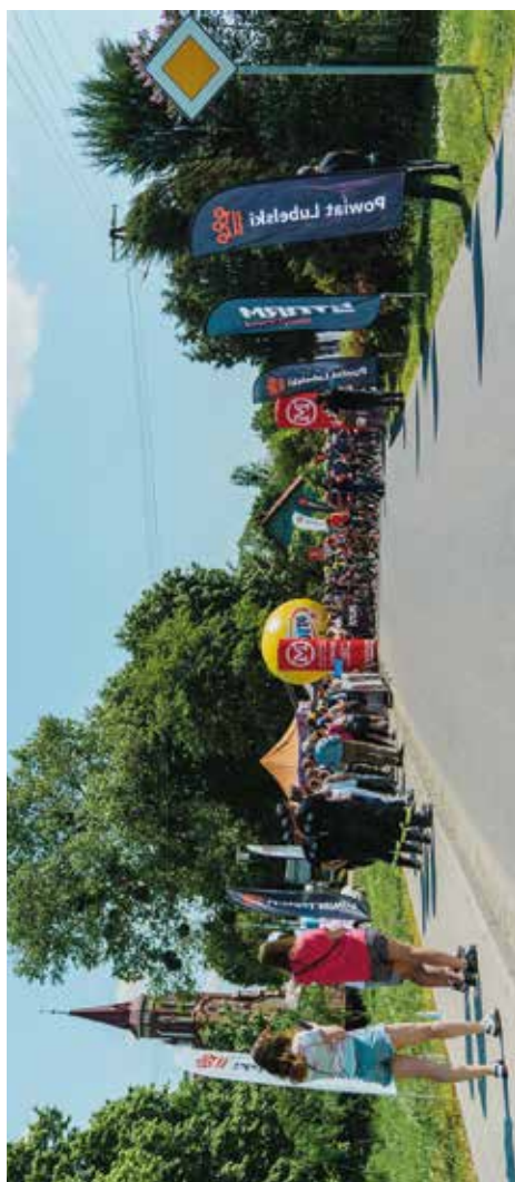
Mazovia MTB Marathon „O puchar Starosty Lubelskiego Wysokie - Zakrzew”; Gmina Wysokie