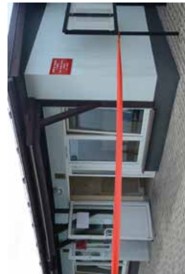
Otwarcie Filii Wydział Komunikacji, Transportu i Drogownictwa w Dominowie