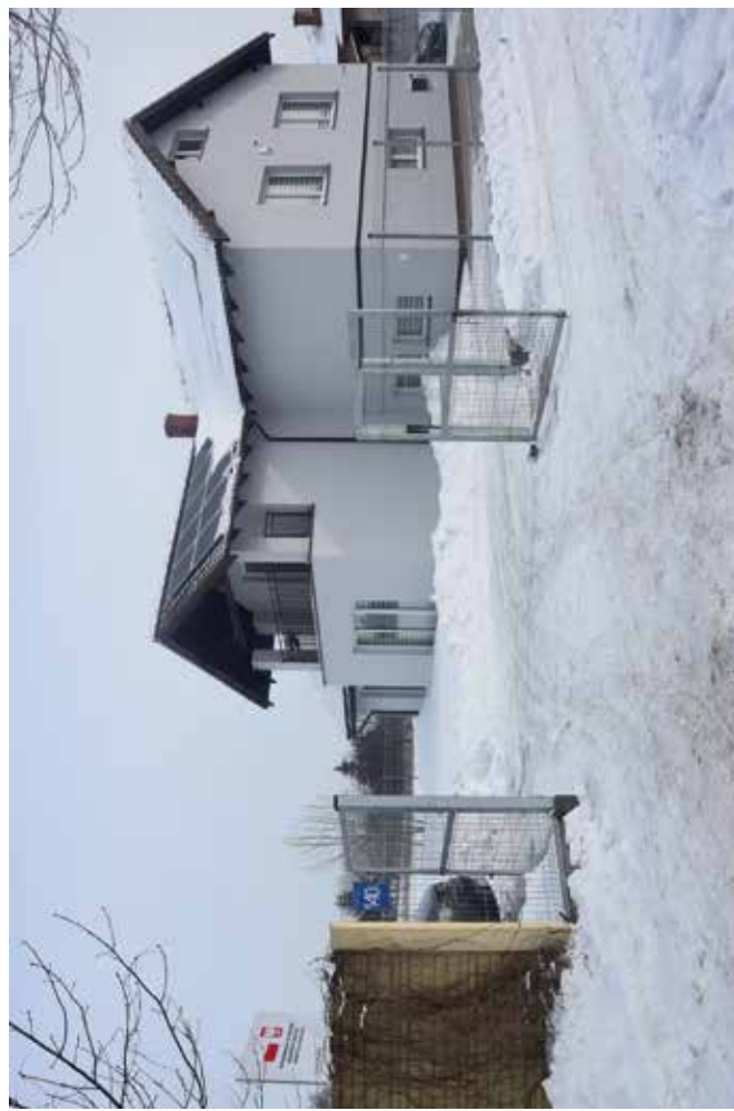
Przebudowa i rozbudowa budynku Domu Dziecka w Dąbrowicy