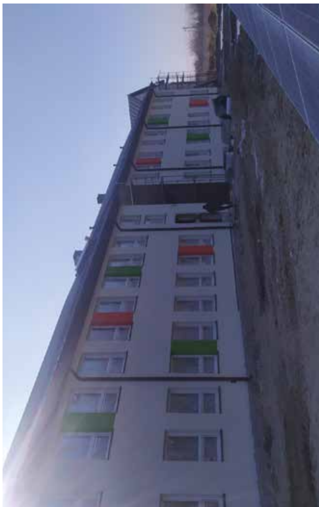
Budowa nowego Ośrodka Szkolno-Wychowawczego w Bystrzycy