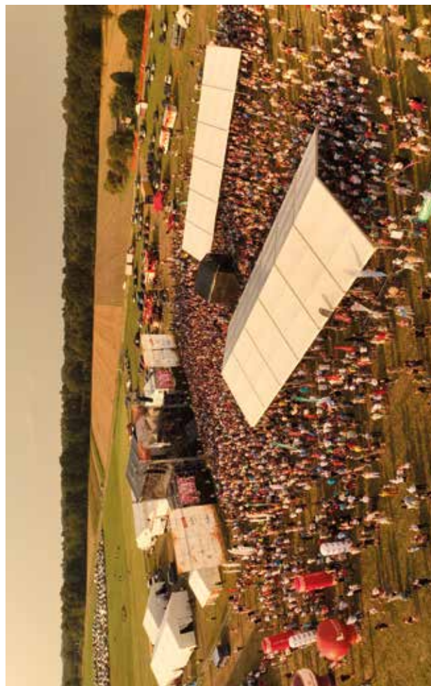
Dożynki w Radawcu