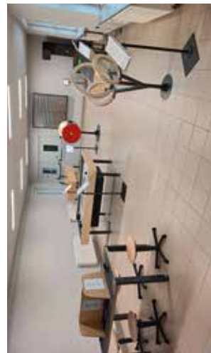
Mate Centrum Nauki SOWA w Bychawie