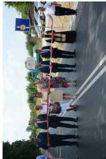
Otwarcie drogi Dominów - Głusk