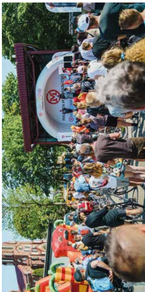
Mazovia MTB Marathon „O puchar Starosty Lubelskiego Wysokie - Zakrzew”; Gmina Wysokie