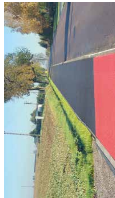
Budowa Chodnika w miejscowości Chmiel Pierwszy w ciągu drogi powiatowej nr 2272L