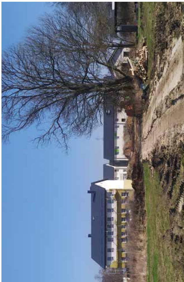
Nowy Ośrodek Szkolno-Wychowawczy w Bystrzycy