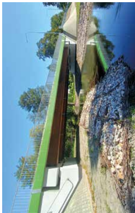
Most w Osmolicach