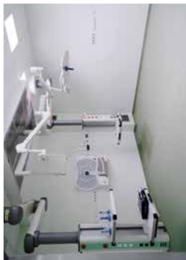
Pracownia diagnostyczna w SPZOZ Nr 1 w Bełżycach