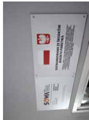
Mate Centrum Nauki SOWA w Bychawie