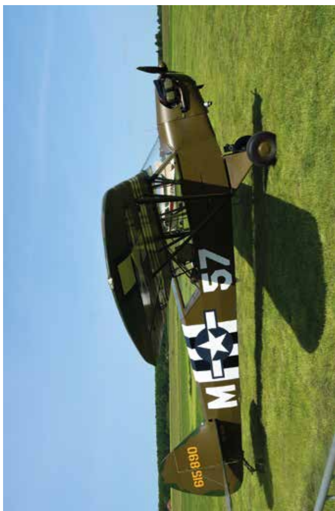
Lotniczy Dzień Dziecka w Radawcu