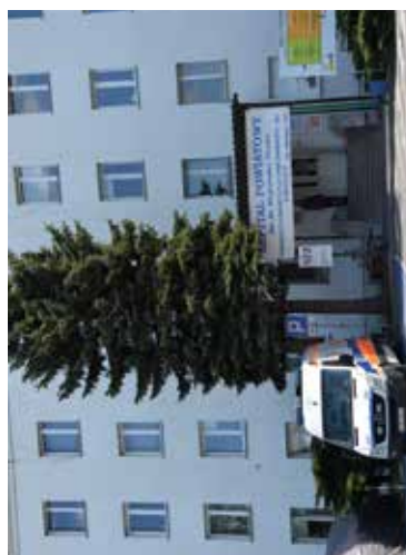
SPZOZ Nr 1 w Bełżycach