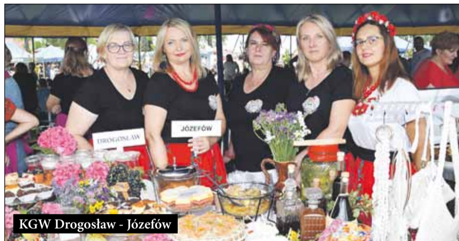
KGW Drogosław - Józefów

nie stoiska otrzymało od burmistrza dofinansowanie w kwocie 1 tys. zł.