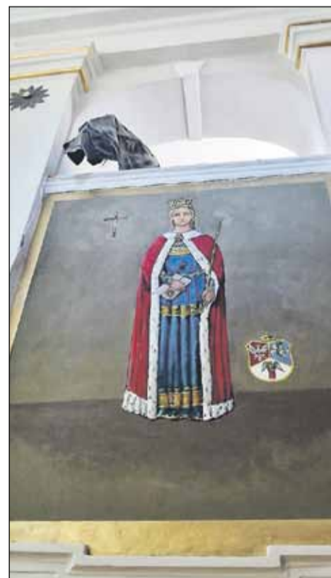
Zdjęcia z kościoła pw. Katarzyny Aleksandryjskiej w Pogrzebowie