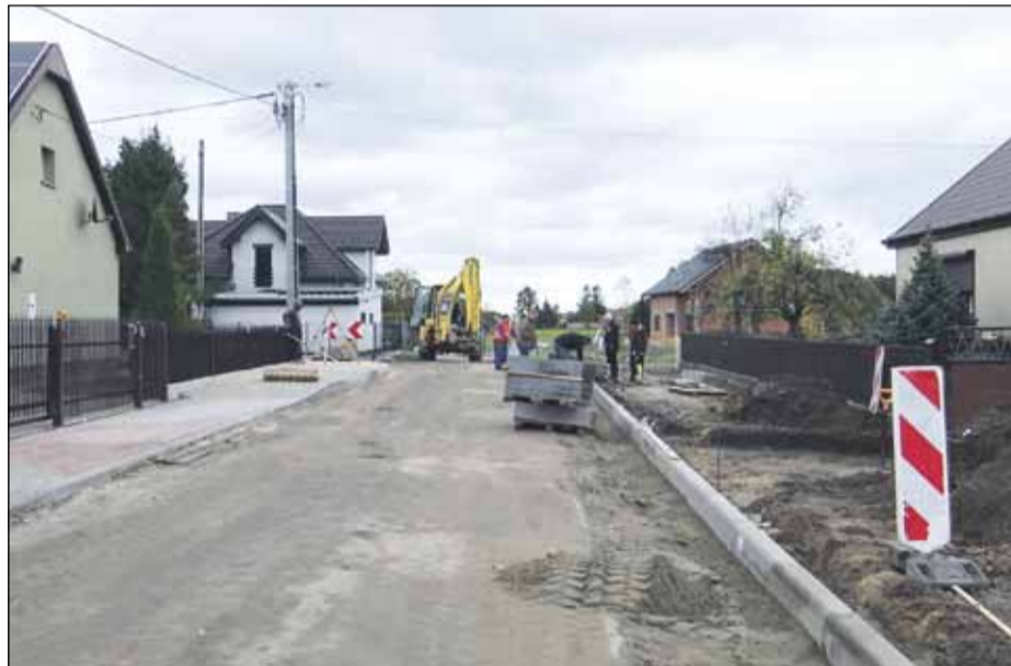
Budowa drogi w Jaskółkach

W tym roku pozyskano także 8 mln zł z programu Polski Ład Program Inwestycji Strategicznych edycja 8. Kwota 6 mln zł wesprze prace związane z przebudową drogi wraz z budową kanalizacji deszczowej na ul. Krotoszyńskiej w Ligocie.