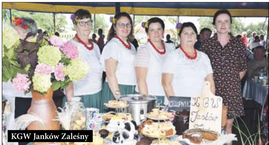
KGW Janków Zalesny