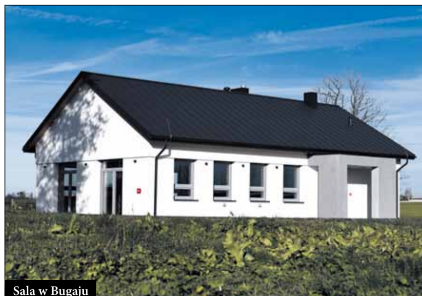
Sala w Bugaju