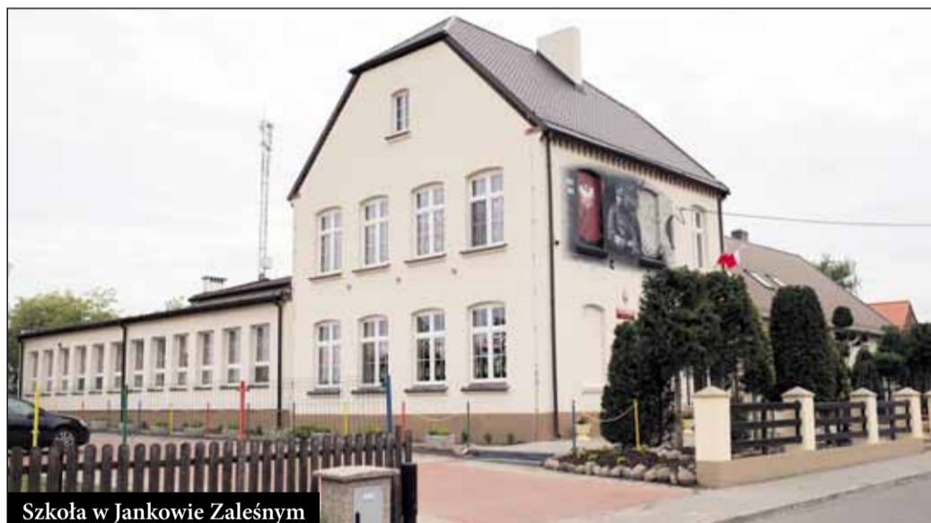
Szkoła w Jankowie Zaleśnym