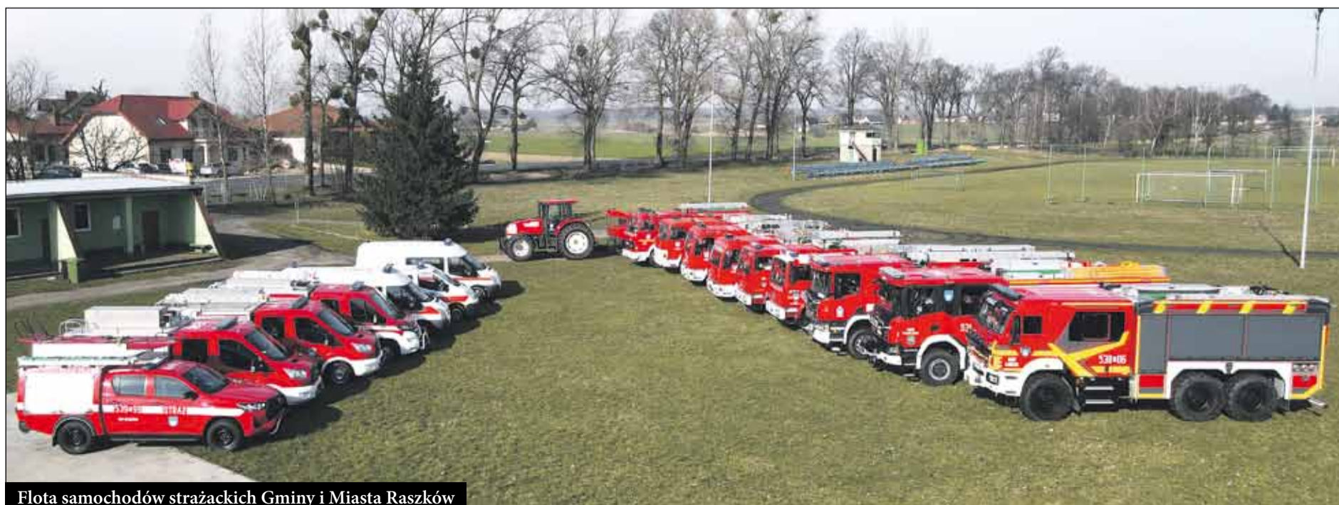
Flota samochodów strażackich Gminy i Miasta Raszków

W Gminie Raszków od lat realizowane są programy wsparcia: dla rodzin poprzez Wyprawkę Niemowlaka oraz dla uzdolnionych uczniów poprzez stypendia za dobre wyniki w nauce. W ostatnich latach wprowadzono także coroczne nagrody finansowe dla osób, które osiągają wybitne osiągnięcia w dziedzinie sportu i kultury.