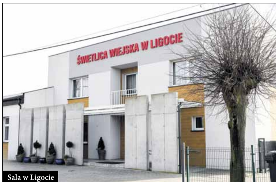
Sala w Ligocie