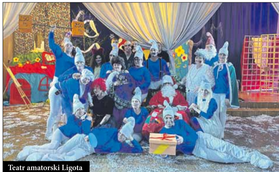
Teatr amatorski Ligota