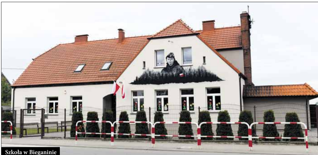
Szkoła w Bieganinie

Placówki oświatowe na terenie Gminy są nieustannie modernizowane, wyposażane w interaktywny sprzęt, doskonale spełniają rolę edukacyjną na miarę XXI wieku. Rozszerzana jest także przyszkolna baza sportowa. Obok istniejących już obiektów sportowych, wybudowanych wcześniej - hali w Raszkowie, sali gimnastycznej w Korytach, boiska wielofunkcyjnego w Radłowie i Raszkowie, dołączyły w minionej kadencji kolejne placówki oświatowe, w których wybudowano boiska ze sztuczną nawierzchnią - w Grudzielcu, Ligocie, Jankowie Zaleśnym i Jaskółkach. Ponadto w ubiegłym roku przy szkole podstawowej w Radłowie Gmina zakupiła ziemię za 900 tys. zł pod budowę w przyszłości hali sportowej. Na stronie prezentujemy obiekty szkolne i ich otoczenie, odnowione i wyremontowane w ostatnich latach.