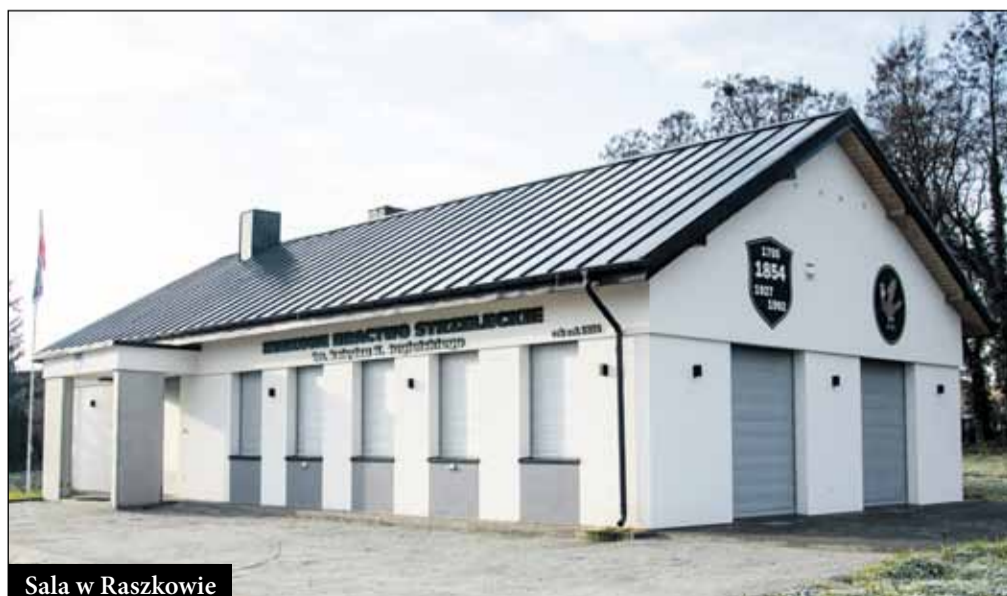
Sala w Raszkowie