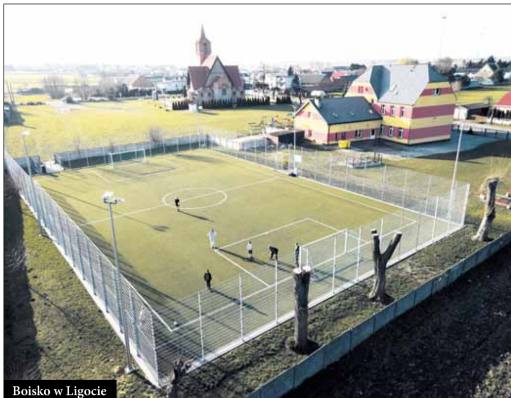
Boisko w Ligocie