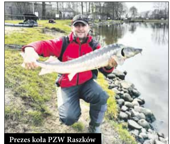
Prezes koła PZW Raszków