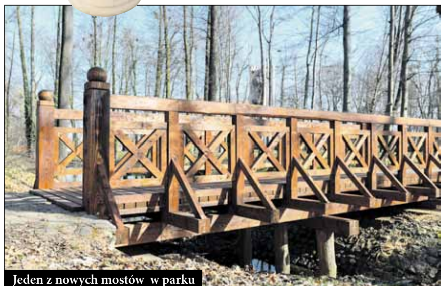
Jeden z nowych mostów w parku