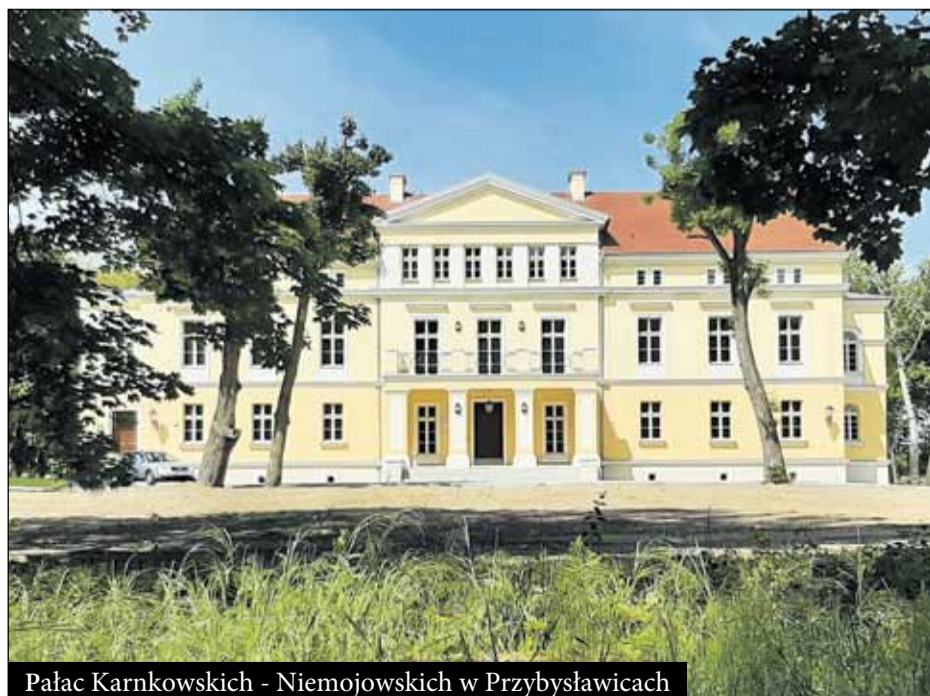
Pałac Karnkowskich - Niemojowskich w Przybysławicach