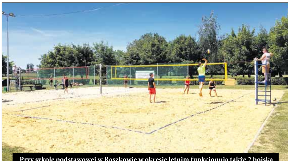
Przy szkole podstawowej w Raszkowie w okresie letnim funkcjonują także 2 boiska do piłki plażowej. Miejsce powstało z inicjatywy klubu Volley Raszków, zrzeszającego pasjonatów piłki siatkowej w naszej Gminie.

Bazę edukacyjną na terenie gminy dopełnia Raszkowska Biblioteka Publiczna im. Adama Mickiewicza, która nie tylko wypożycza książki, ale również rozwija pasję, dyskutuje, organizuje spotkania z nietuzinkowymi osobami. Dużym udogodnieniem jest wdrożony w bibliotece system elektronicznego wypożyczania książek. Czytelnicy mogą korzystać z aplikacji mobilnej Sowa Mobi, dzięki której w smartfonie mają dostęp do katalogu bibliotecznego, mogą