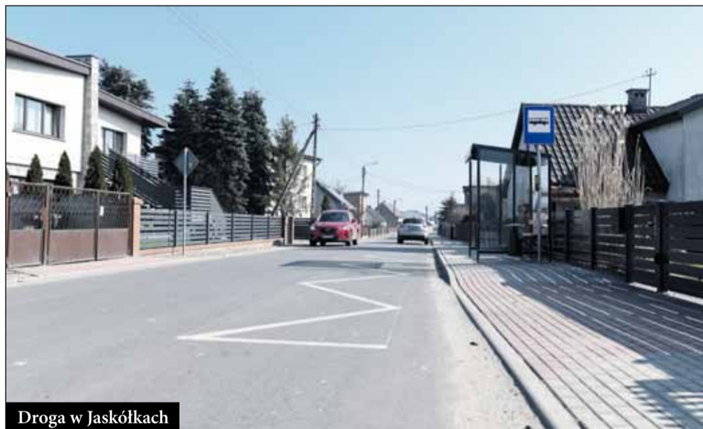
Droga w Jaskółkach