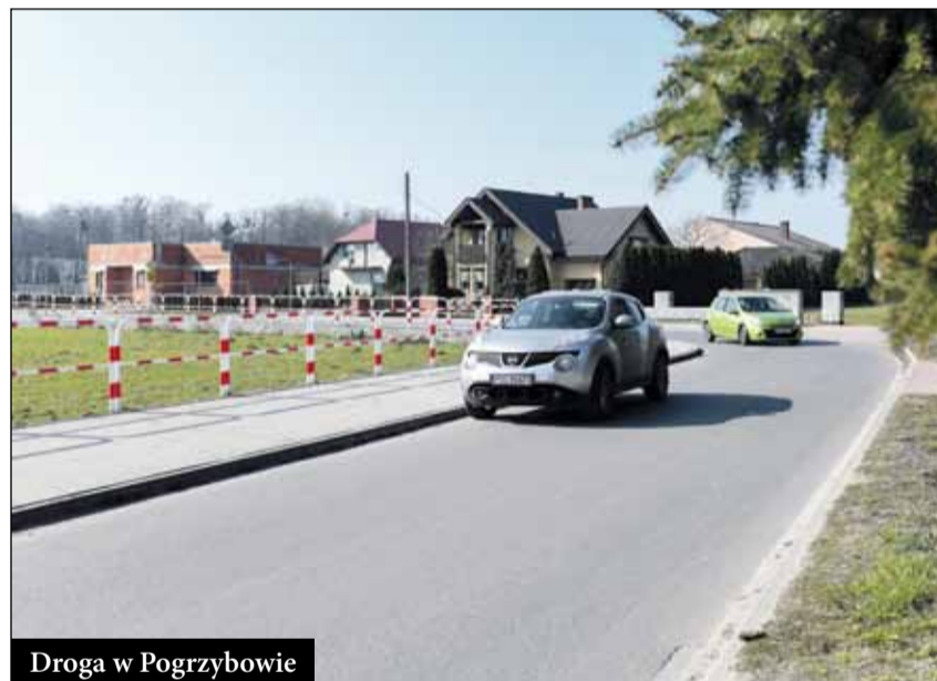
Droga w Pogrzebowie

dłów-Rąbczyn, w Ligocie, Korytach, Raszkowie, na odcinkach dróg Moszczanka – Szczurawice oraz Moszczanka – Bieganin. Dofinansowane zostały również sygnalizacje świetlne na dwóch skrzyżowaniach w Raszkowie na ul. Wałowej.