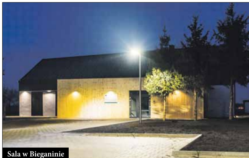
Sala w Bieganinie