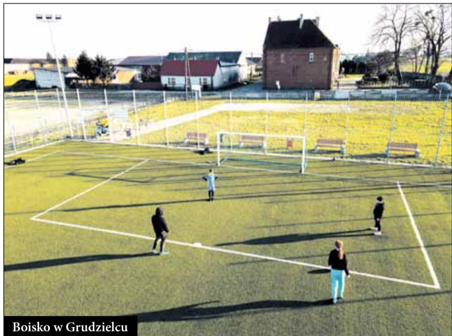
Boisko w Grudzielcu