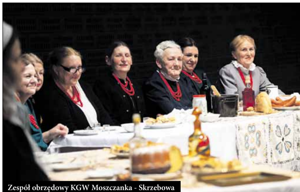
Zespół obrzędowy KGW Moszczanka - Skrzebowa