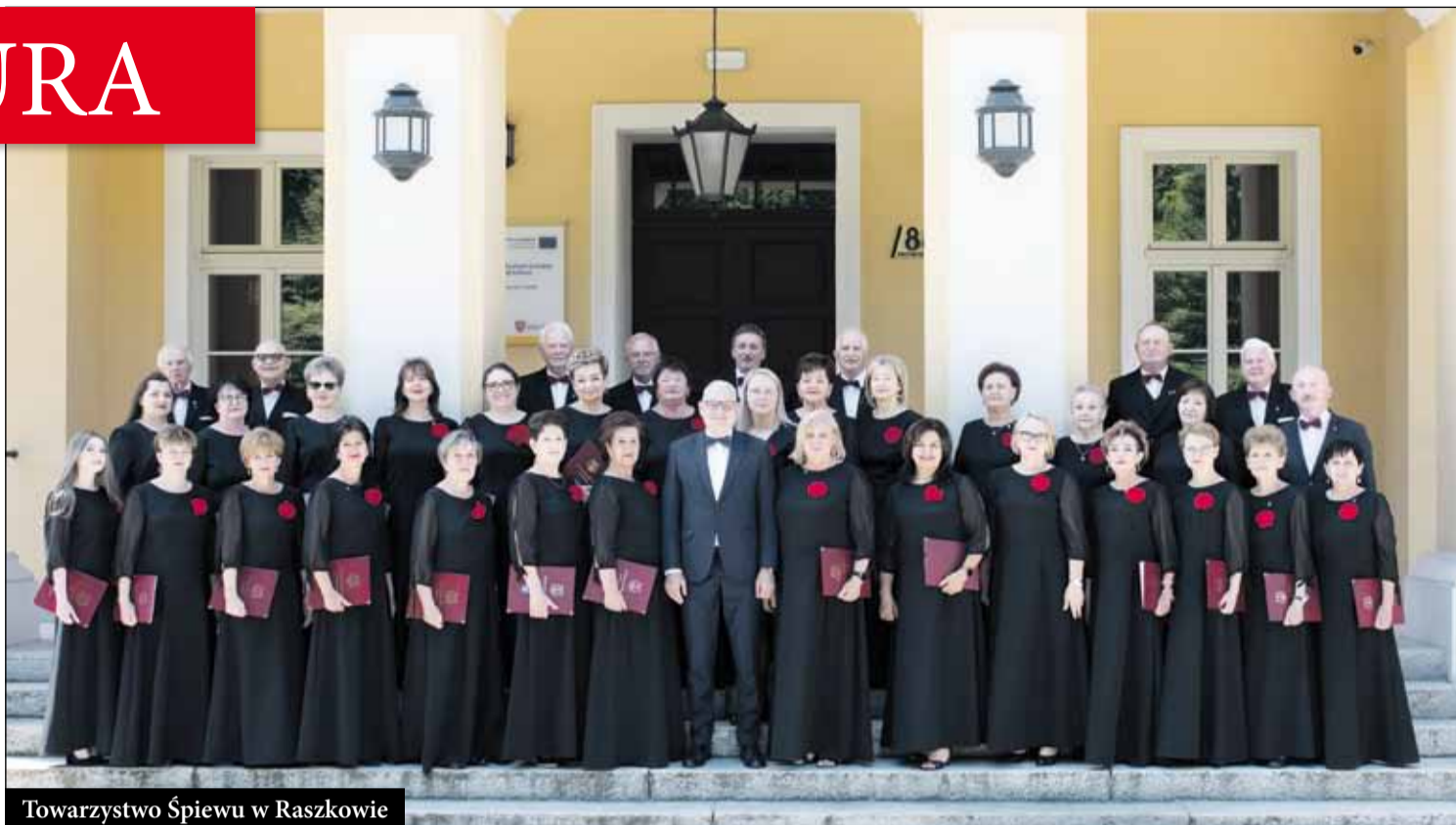
Towarzystwo Śpiewu w Raszkowie

Koordynatorem życia kulturalnego na terenie gminy jest Miejsko-Gminny Ośrodek Kultury w Raszkowie. Pod kierunkiem instruktorów rozwijają swoją działalność zespoły wokalne, taneczne oraz teatry amatorskie. Placówka organizuje również wiele ciekawych zajęć zarówno dla dzieci jak i dla dorosłych. Dzieci, które lubią taniec towarzyski, nowoczesny i muzykę rozrywkową doskonale sprawdzają się na zajęciach rytmicznych, wokalnych i tanecznych. Swoje pasje mogą realizować w zespołach tanecznych: tańca współczesnego Balans, grupie Hip-hop, show dance oraz grupie wokalne TREMA. Młodzi akrobaci mogą rozwijać swoje umiejętności w Akademii Sztuki Cyrkowej. W domu kultury działa także klub szachowy dla dzieci, organizowane są różnego rodzaju kursy artystyczne, zajęcia plastyczne w pracowni „Handmade”,