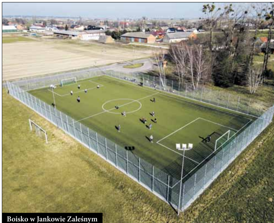
Boisko w Jankowie Zależnym