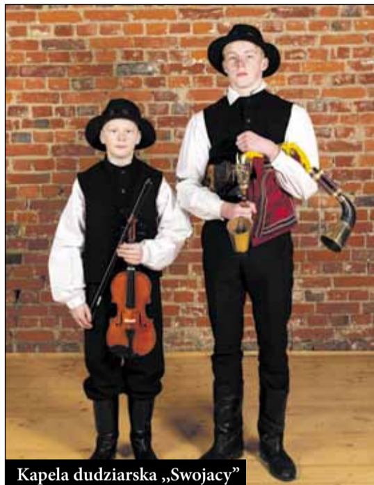
Kapela dudziarska „Swojacy”