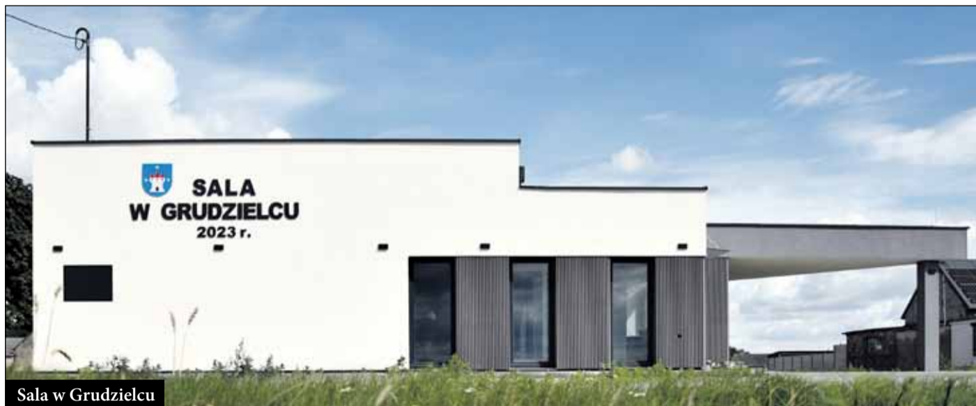
Sala w Grudzielcu

W miarę potrzeb, remontowane są również pozostałe sale (obecnie remontowana jest sala w Sulisławiu). Ponadto w ostatnich latach powstało wie-