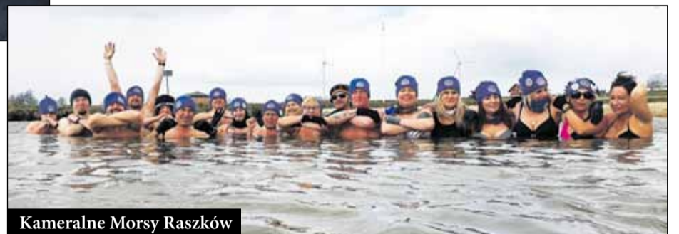
Kameralne Morsy Raszków