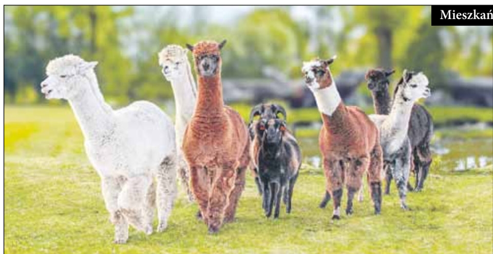
Mieszkańcy mini zoo