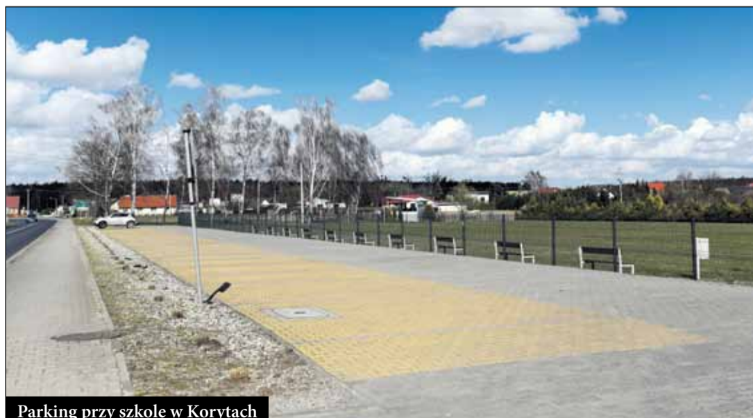
Parking przy szkole w Korytach