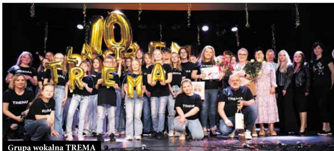
Grupa wokalna TREMA