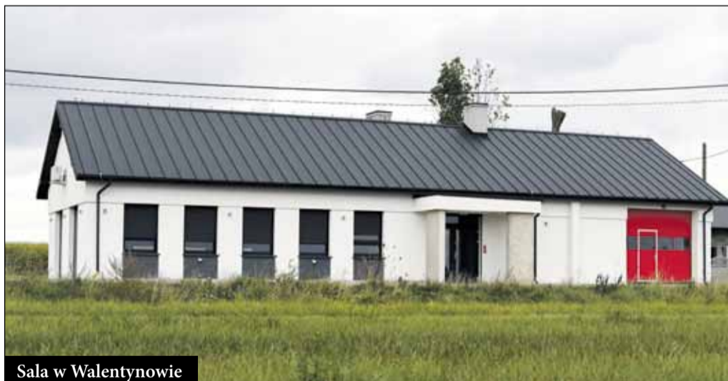
Sala w Walentynowie