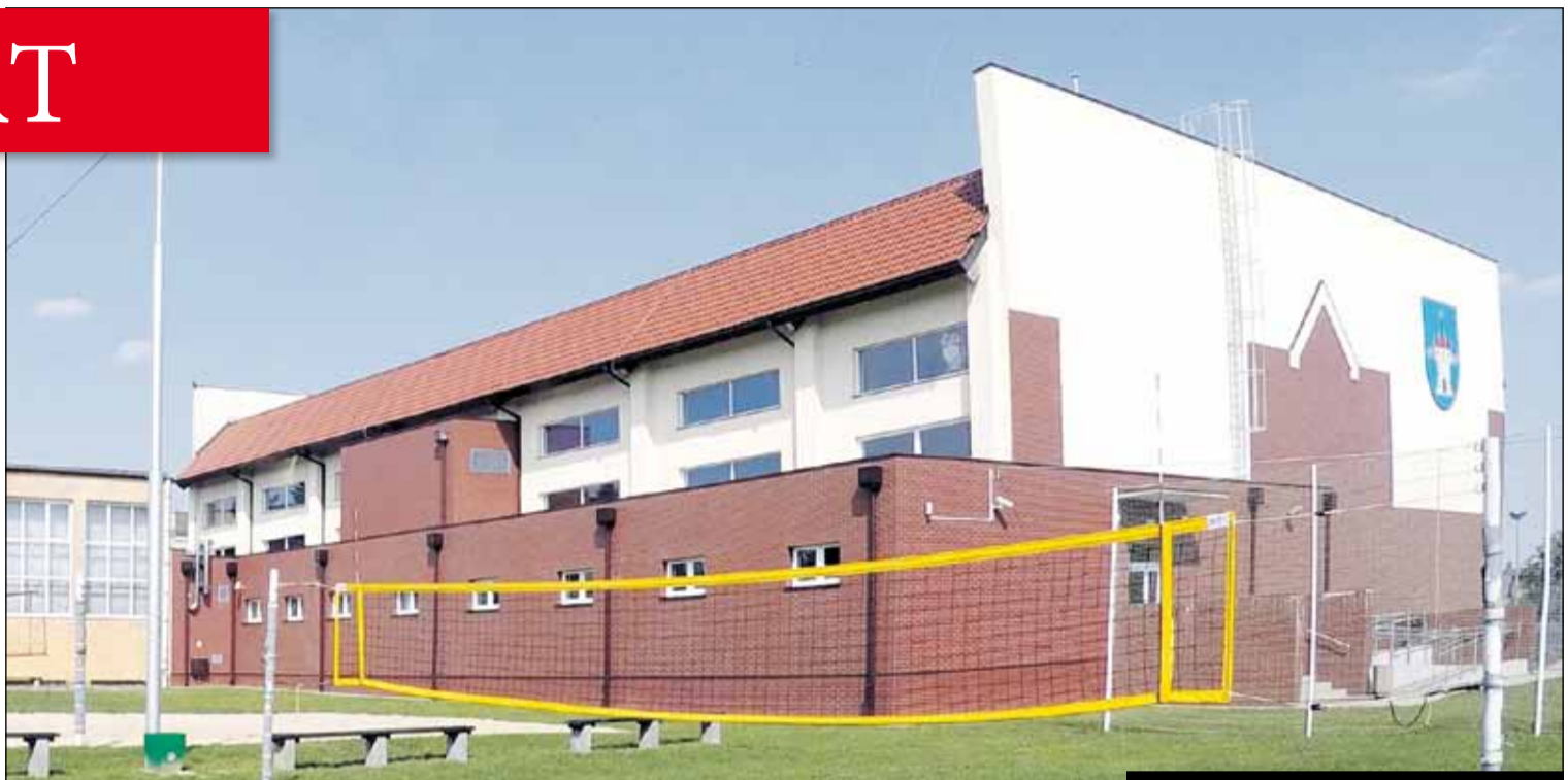
Największa hala sportowa w Gminie

Rozwój kultury fizycznej i sportu to kolejne ważne zadania, jakie stawiają przed sobą władze Gminy. Stwarzanie dobrych warunków do uprawiania sportu daje możliwość pożytecznego spędzania wolnego czasu przez młodzież. Wszystkie działania podejmowane w tej dziedzinie także promują Gminę i Miasto Raszków. Trzeba podkreślić znaczenie klubów sportowych działających na terenie naszej gminy, które są prawdziwą kuźnią talentów. Wielu mistrzów i mistrzyń Polski w kolarstwie zaczęło swoją karierę w raszkowskim klubie kolarskim. To właśnie dla nich w ubiegłym roku zmodernizowano pawilon sportowy, remontując część budynku przeznaczoną dla kolarzy. Jedną z największych