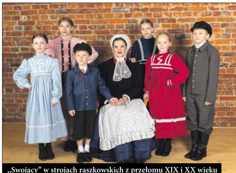
„Swojacy” w strojach raszkowskich z przełomu XIX i XX wieku