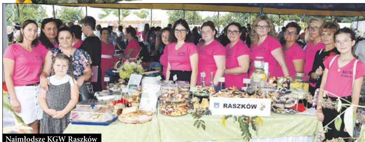
Najmłodsze KGW Raszków