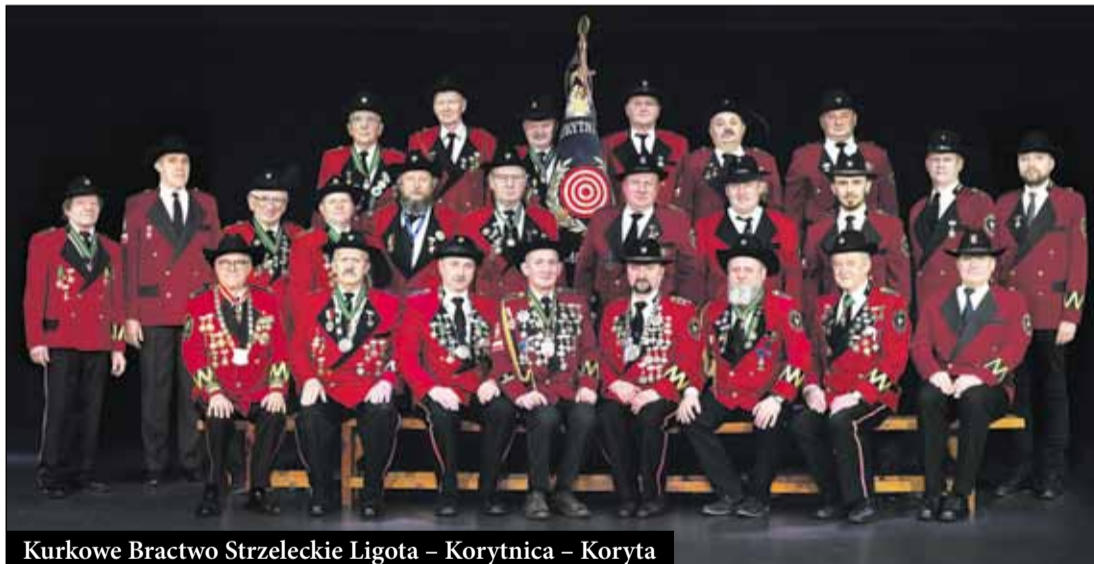
Kurkowe Bractwo Strzeleckie Ligota - Korytnica - Koryta