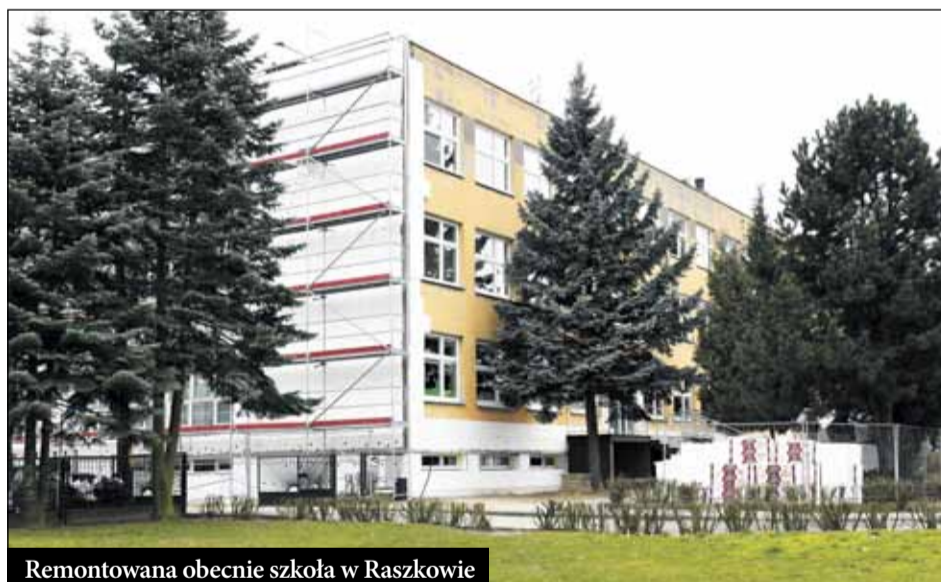
Remontowana obecnie szkoła w Raszkowie