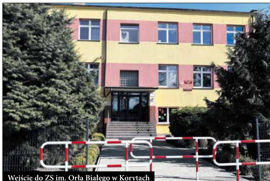
Wejście do ZS im. Orła Białego w Korytach