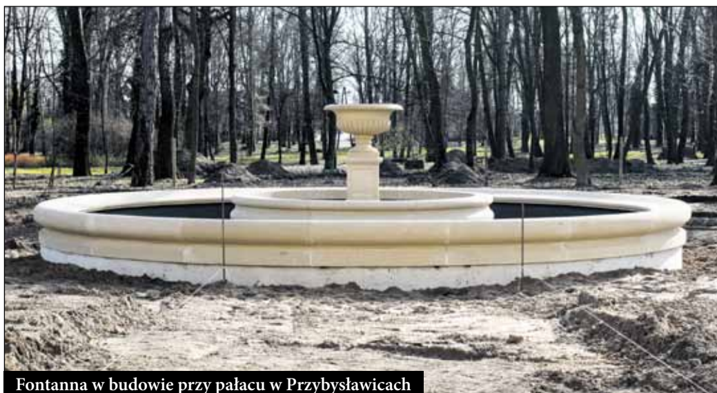
Fontanna w budowie przy pałacu w Przybysławicach