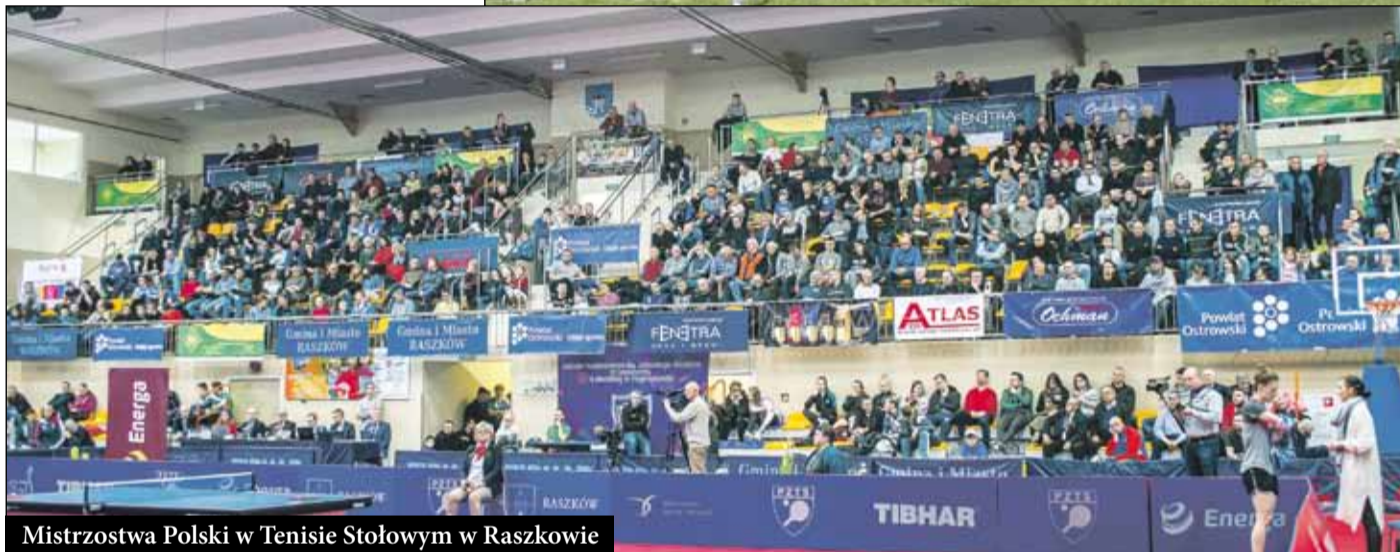
Mistrzostwa Polski w Tenisie Stołowym w Raszkowie