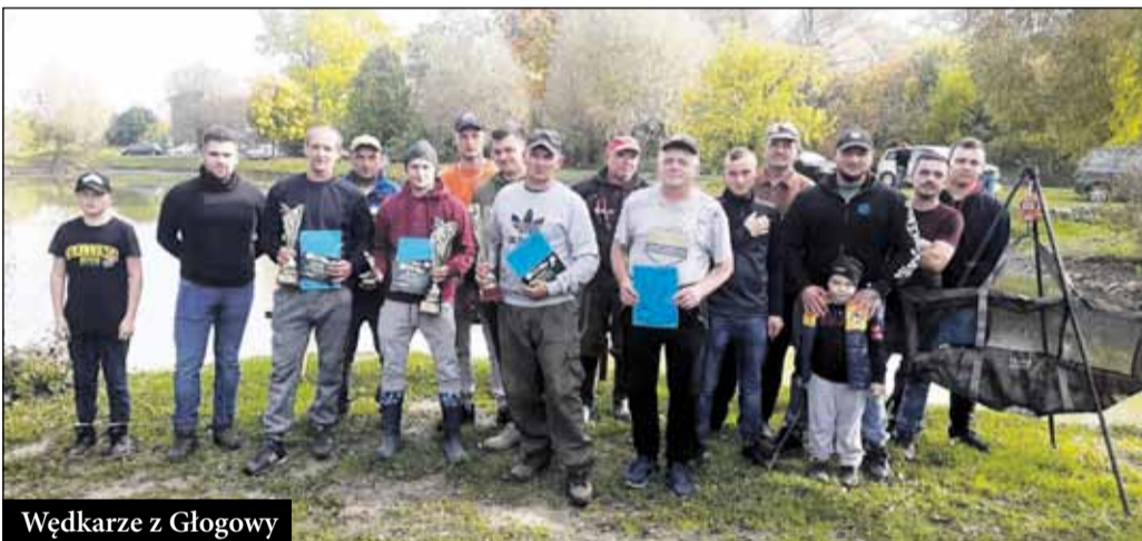
Wędkarze z Głogowy