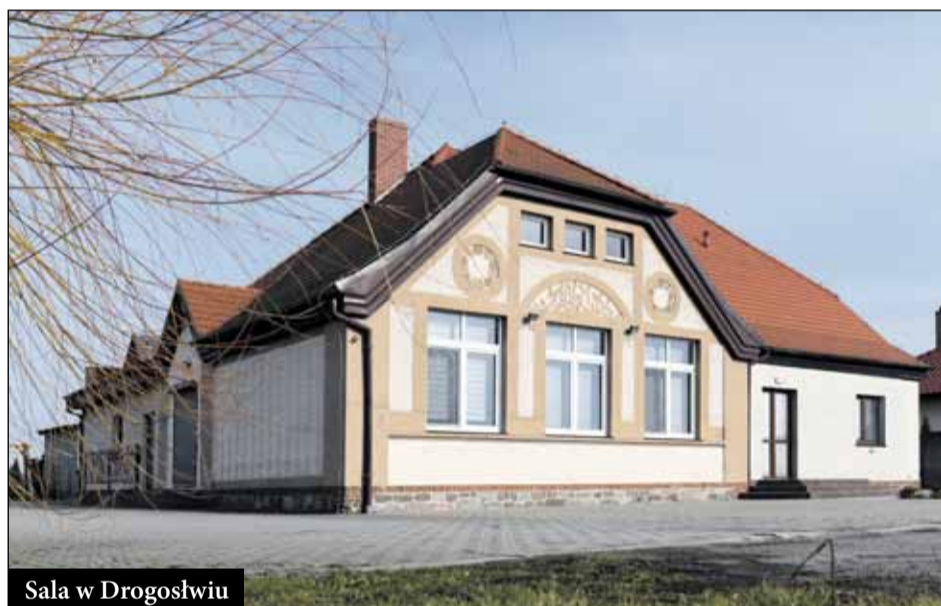
Sala w Drogosławiu

wojowi organizacji, takich jak Koła Gospodyń Wiejskich czy Ochotnicze Straże Pożarne.