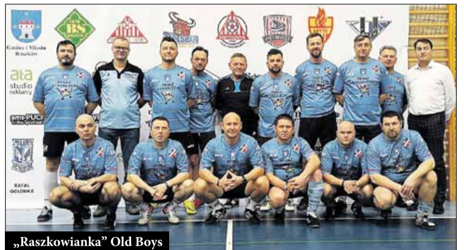
„Raszkowianka” Old Boys