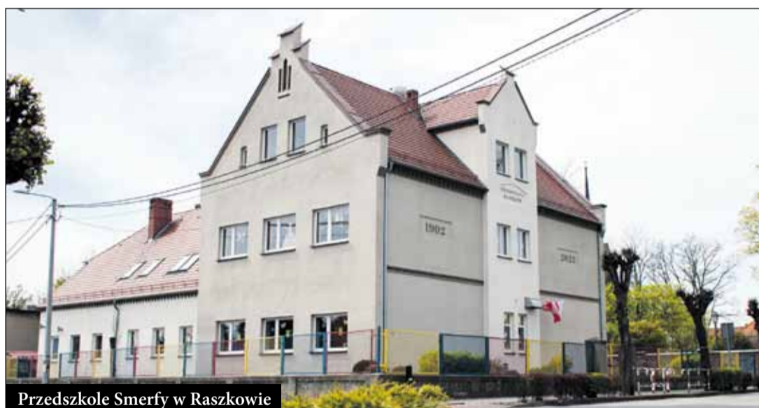
Przedszkole Smerfy w Raszkowie