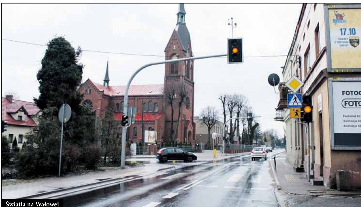
Światła na Wałowej

Samorząd raszkowski uważa, że jedną z najważniejszych inwestycji, która powinna być realizowana przez Powiat Ostrowski w kolejnej kadencji, to przebudowanie drogi z Moszczanki, w kierunku wysypiska, do Szczurawic – do drogi krajowej S11. Na projekt tej inwestycji Gmina przekazała już środki finansowe w wysokości 120 tys. zł, a także zadeklarowała kolejne wsparcie finansowe tej inwestycji.