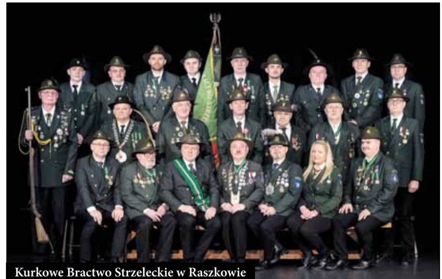
Kurkowe Bractwo Strzeleckie w Raszkowie