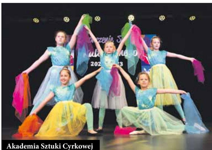
Akademia Sztuki Cyrkowej