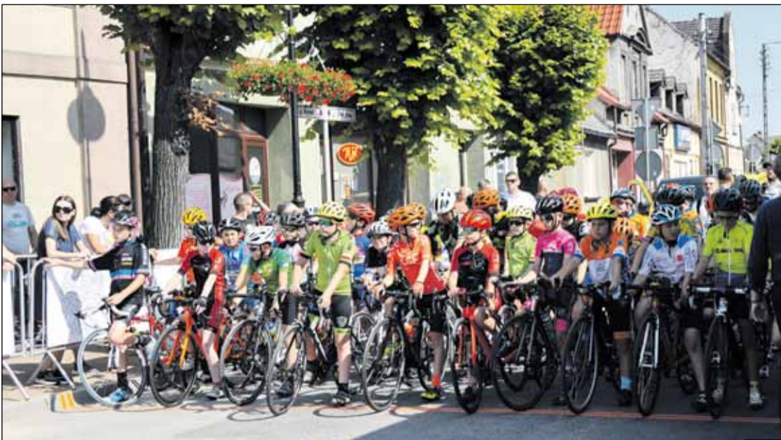
Mistrzostwa Polski Szkółek Kolarskich