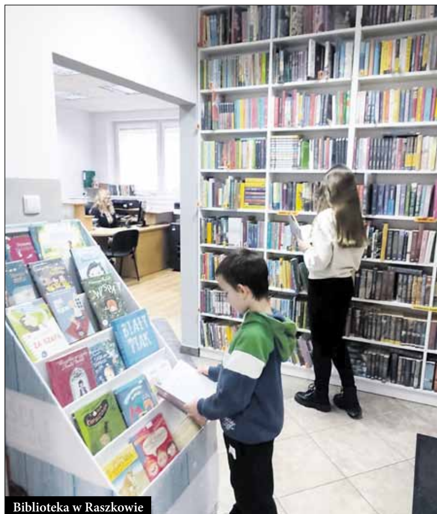
Biblioteka w Raszkowie

rezerwować i zamawiać książki przez internet, śledzić historię wypożyczeń. Zwrotów książek można dokonywać całodobowo za sprawą książkomatu ustawionego z początkiem 2024 r. przed wejściem. Dzięki akcjom proczytelniczym takim jak np. „Mała Książka Wielki Człowiek”, „Tata też czyta”, spotkaniom w przedszkolach bibliotekę odwiedza coraz więcej rodzin z dziećmi. Działają w niej z powodzeniem dwa dyskusyjne kluby książki - dla młodzieży i dorosłych.