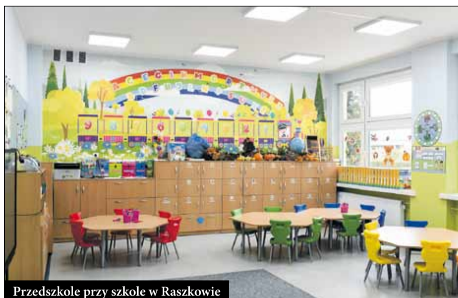
Przedszkole przy szkole w Raszkowie