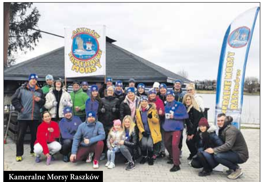
Kameralne Morsy Raszków