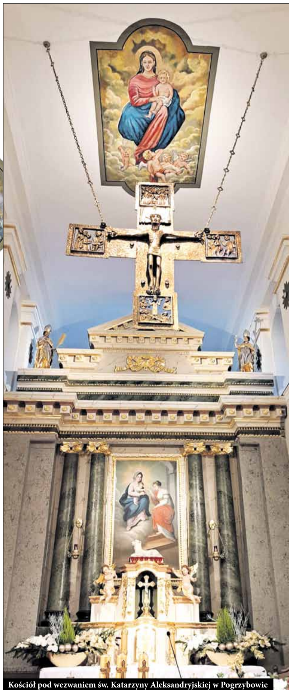
Kościół pod wezwaniem św. Katarzyny Aleksandryjskiej w Pogrzebowie

w Raszkowie. W najbliższym czasie rozpoczną się także prace związane z odrestaurowaniem budynku strażnicy przy ul. Pleszewskiej w Raszkowie. Przypomnijmy, że w ostatnich latach Gmina przeprowadziła remonty zabytków za około 11 mln zł. Za kwotę tę: przebudowano Ratusz na raszkowskim rynku, przywracając mu pierwotną,