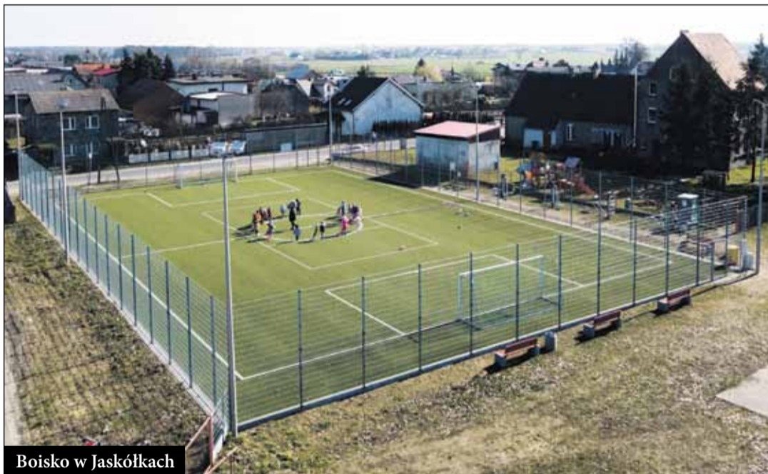
Boisko w Jaskółkach