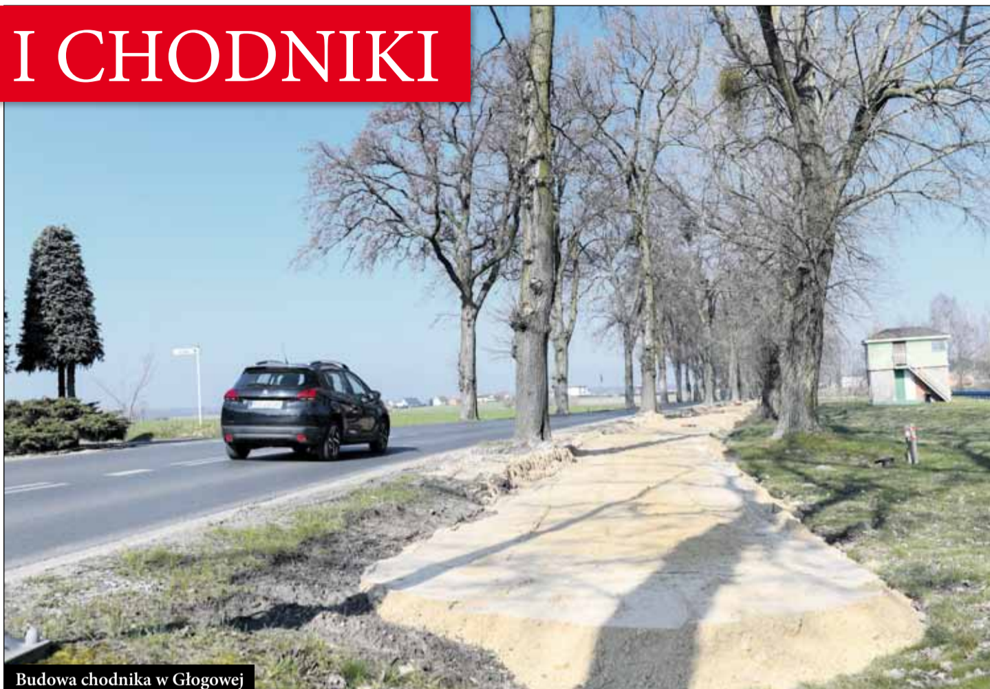
Budowa chodnika w Głogowej

Dzięki dobrej współpracy z Powiatem Ostrowskim, Gmina dofinansowuje także inwestycje na drogach powiatowych. W latach 2018-2023 z raszkowskiego budżetu zostały przekazane do Powiatu środki w wysokości 1,8 mln zł. W bieżącym roku kwota ta wzrośnie o kolejne 500 tys. zł (na drogę w Moszczance), do kwoty 2,3 mln zł. Dwa lata temu Gmina przekazała Powiatowi środki na projekt chodnika z Raszkowa do Głogowy. Z całości pieniędzy przekazanych Powiatowi w minionej kadencji udało się dofinansować inwestycje drogowe w Grudzielcu Nowym, Jankowie Zalesnym, w Radłowie, Moszczance, na odcinku Ra-