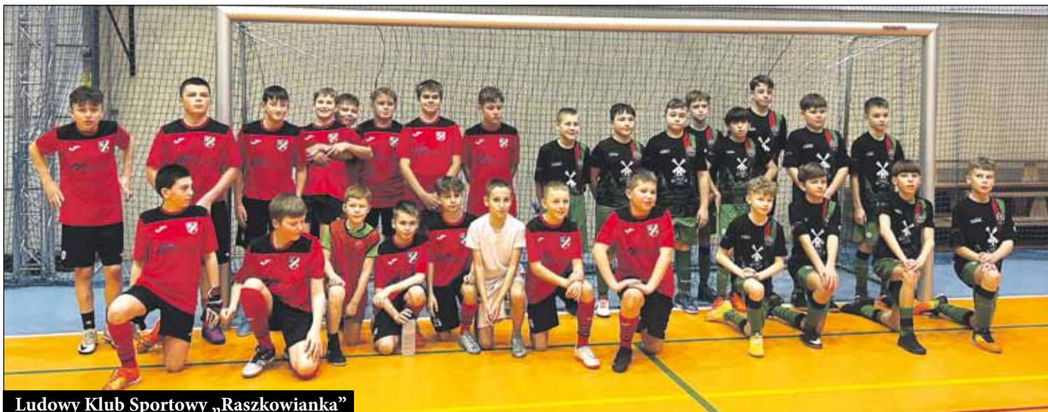
Ludowy Klub Sportowy „Raszkowianka”

impres sportowych organizowanych w Raszkowie od 8 lat są Mistrzostwa Polski Szkółek Kolarskich, na które każdego roku przybywa ok. 1000 zawodników i trenerów z całej Polski. Znacznymi sukcesami może także pochwalić się Uczniowski Klub Sportowy „Arkady” Raszków. Klub propaguje Biegi na Orientację wśród mieszkańców Gminy, organizując otwarte treningi i zawody - cykl Arkady Cup. Aktualnie w klubie trenuje ponad 50 zawodników.