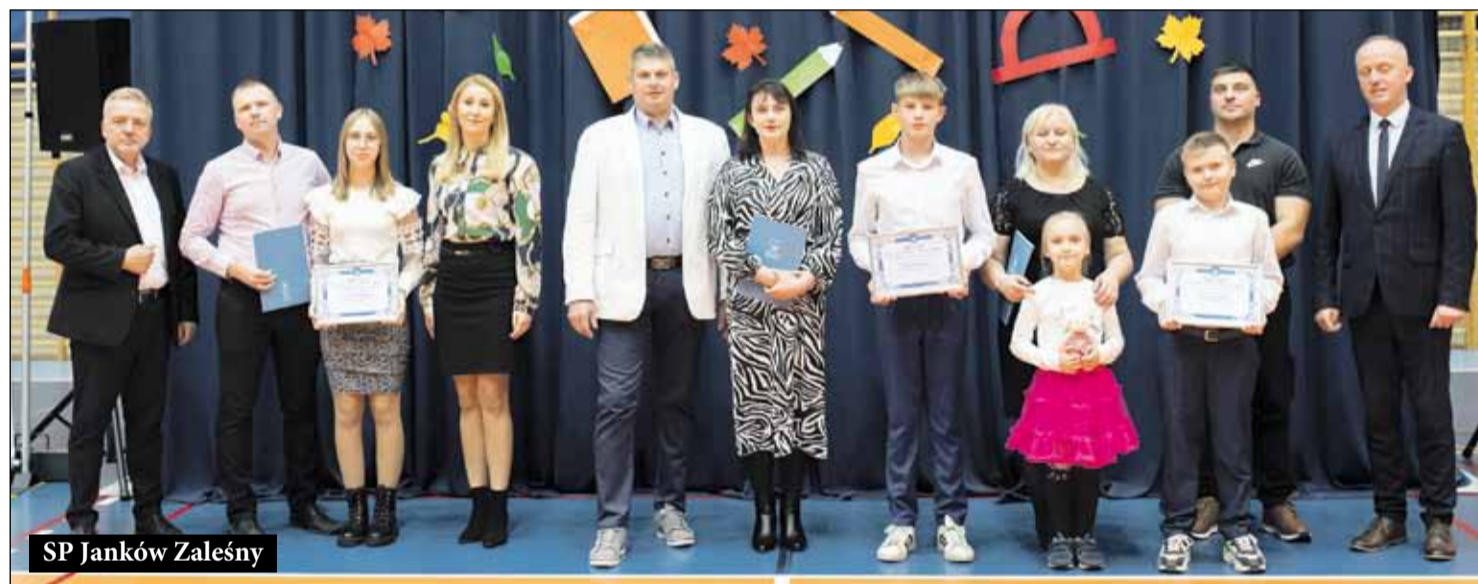
SP Janków Zaleśny

Burmistrz podziękował również radnym Gminy i Miasta Raszków, którzy z budżetu wyasygnowali środki, na stypendia dla uzdolnionej młodzieży.