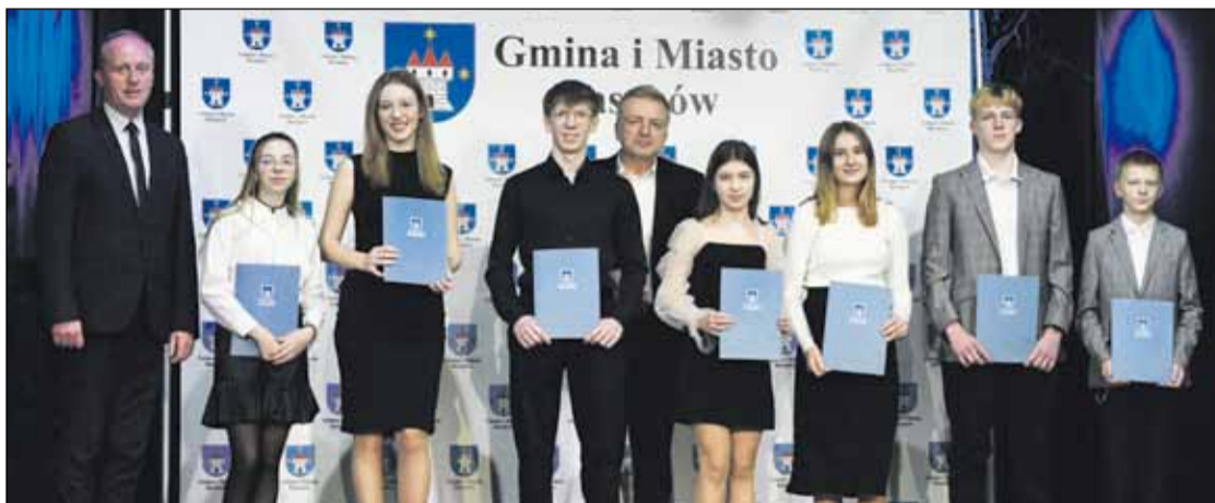
Nagrodzeni w dziedzinie kultury

W obecności przedstawicieli samorządu, radnych, rodziny, przyjaciół i zaproszonych gości