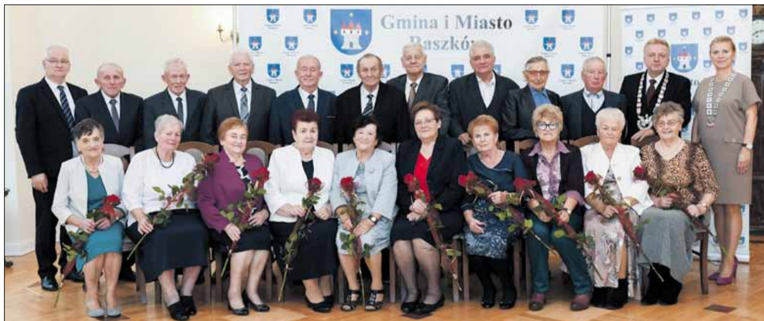
Jubilaci, którzy w 2023 roku obchodzili Szmaragdowe Gody