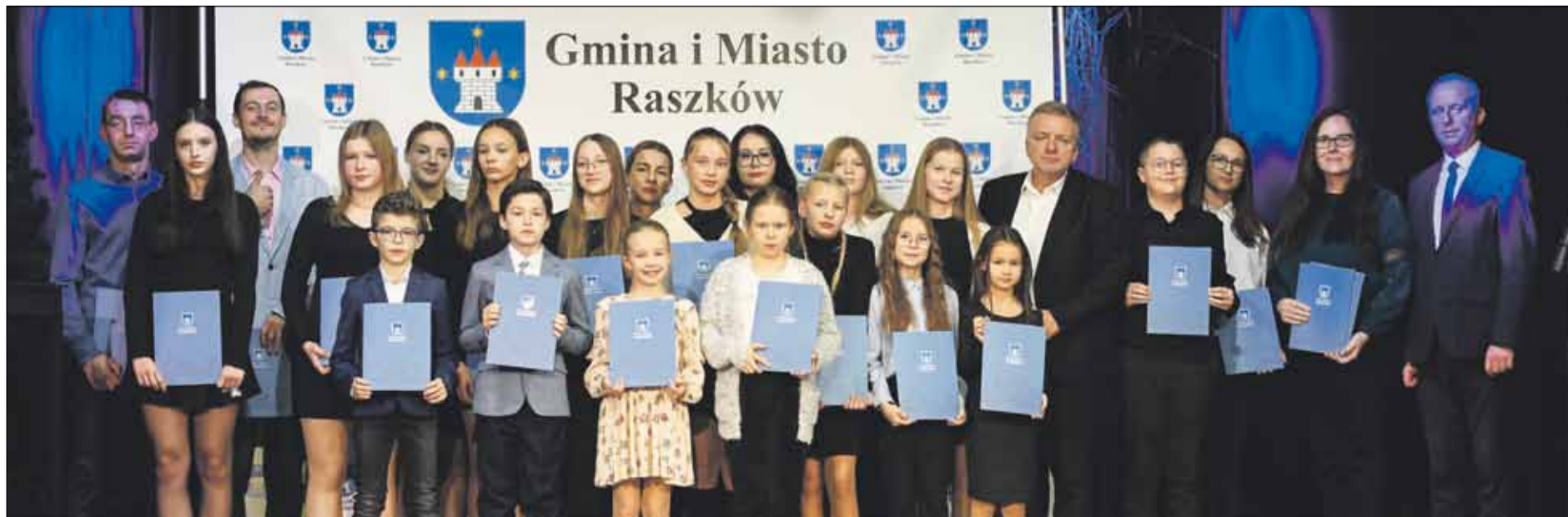
Nagrodzeni w dziedzinie sportu