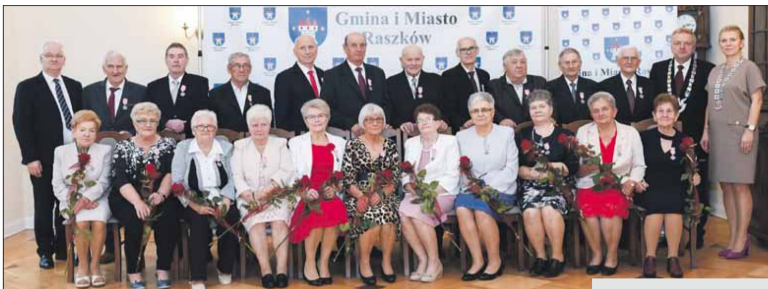
Jubilaci, którzy w 2023 roku obchodzili Złote Gody

Jesteście Państwo wzorem i przykładem do naśladowania dla Waszych najbliższych oraz dla naszej całej lokalnej