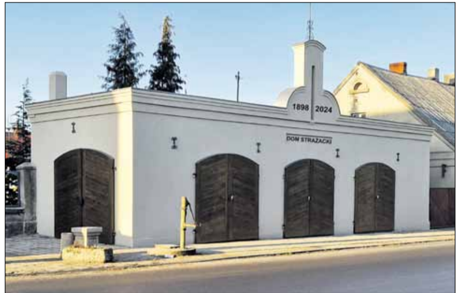
Strażnica w Raszkowie

nową nawierzchnię bitumiczną. Całość zrealizowanej inwestycji to koszt 488 tys. zł. Na jej część pozyskano środki z Urzędu Marszałkowskiego Województwa Wielkopolskiego Funduszu Ochrony Gruntów Rolnych w wysokości 212 tys. zł. W tym roku Gmina podpisała umowę z wykonawcą na projekt oraz przebudowę drogi gminnej i budowę kanalizacji deszczowej w Ligocie przy ulicy Krotoszyńskiej za kwotę 6,7 mln zł. Prace remontowe na odcinku 2.365 m prowadzone będą w latach 2025/2026. Gmina pozyskała na ten cel 6 mln zł z programu Polski Ład.