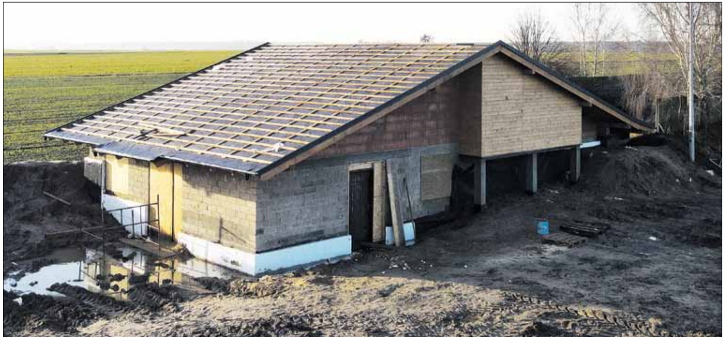
Budowa strzelnicy brackiej w Ligocie

Na plaży przy zbiorniku Kąpielka za kwotę 155 tys. zł został postawiony nowy, kolorowy plac zabaw dla dzieci. W miesiącach letnich, kiedy funkcjonuje strze-