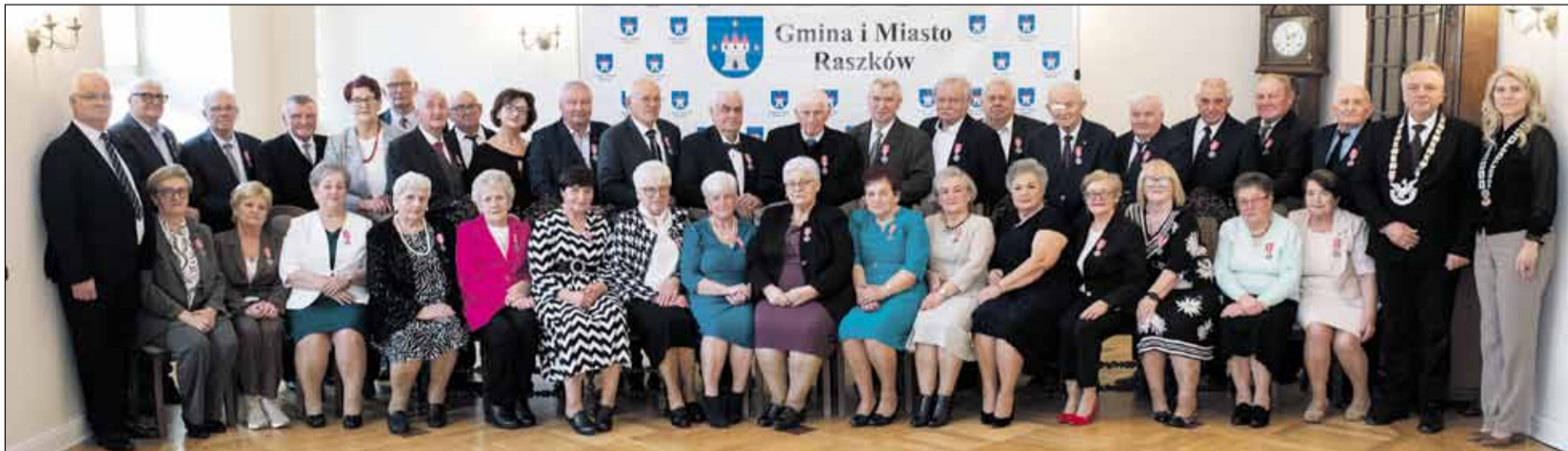
Złote Gody, czyli Jubileusz 50-lecia Zaślubin