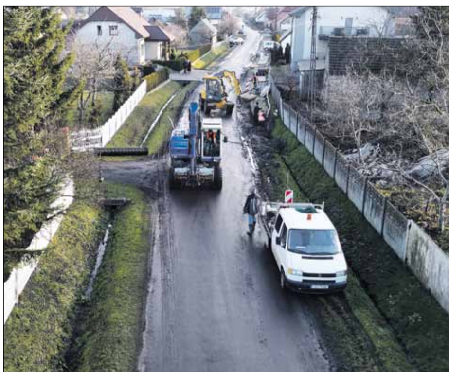
Budowa drogi: Ligota, ul. Krotoszyńska

Na terenie naszej gminy realizowana jest powiatowa inwestycja, która uzyskała znaczące wsparcie finansowe ze strony