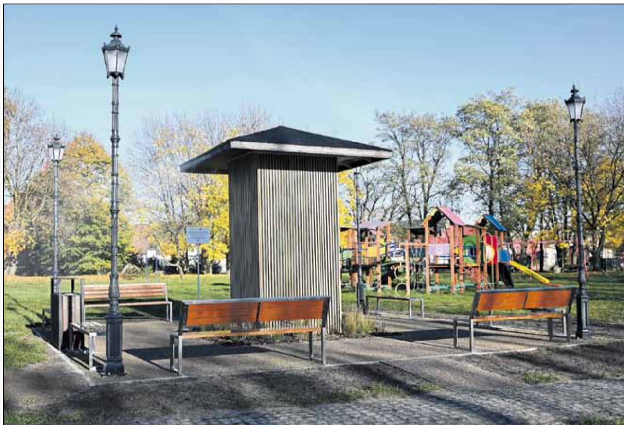
Tężnia soniczna w Raszkowie

Pozyskane w 2025 roku dofinansowanie z Urzędu Marszałkowskiego Województwa Wielkopolskiego – kwota ponad 1,5 mln zł – wesprze rewitalizację raszковского Rynku. Przebudowane zostaną parkingi, chodniki i tereny zielone w centrum miasta. Przewidziane zostały także latarnie solarne i jednolita,