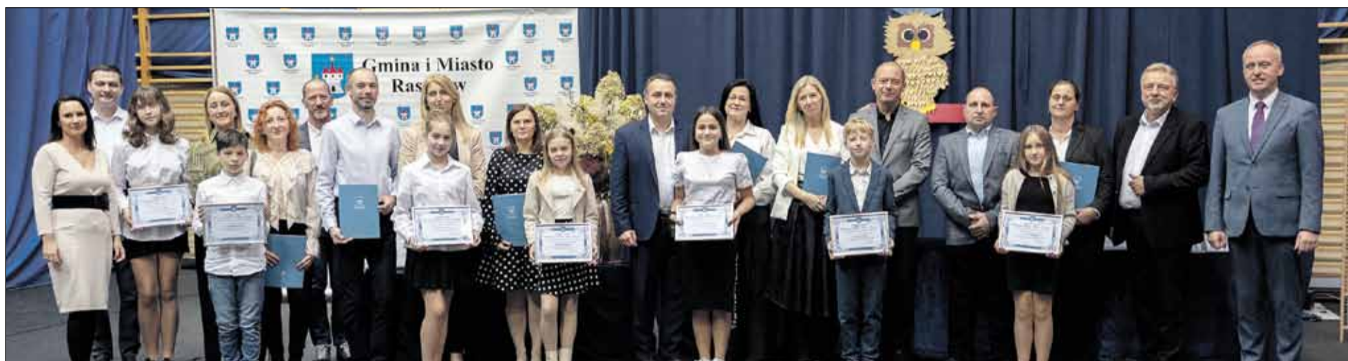
Szkoła Podstawowa im. Arkadego Fiedlera i Armii Krajowej w Raszkowie z siedzibą w Pogrzybowie