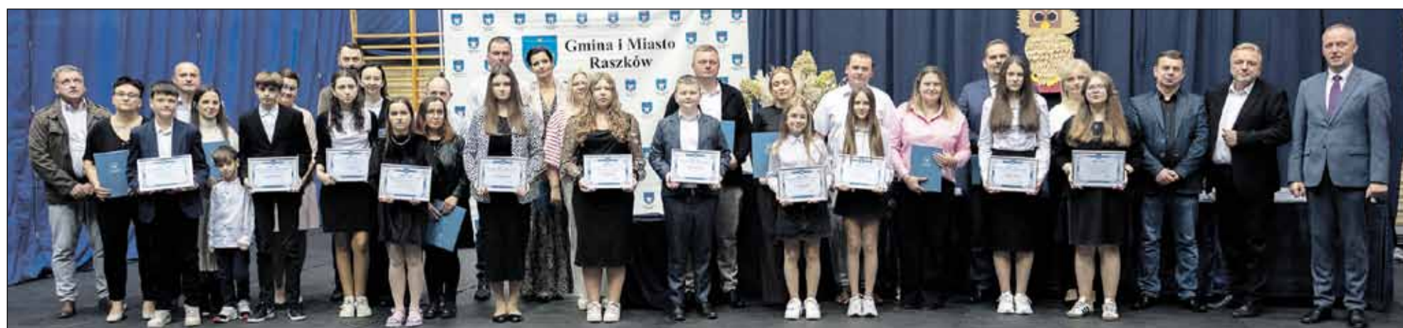
Szkoła Podstawowa im. św. Jana Pawła II w Radłowie