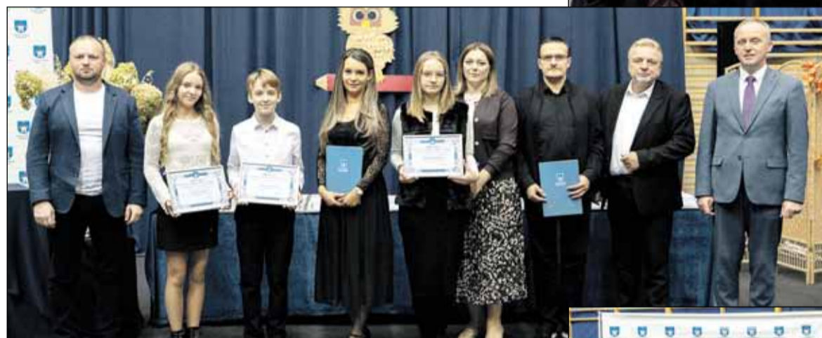
Szkoła Podstawowa im. Danuty Siedzikówny ps. „Inka” w Bieganiu

Szkoła Podstawowa im. św. Jana Pawła II w Radłowie: