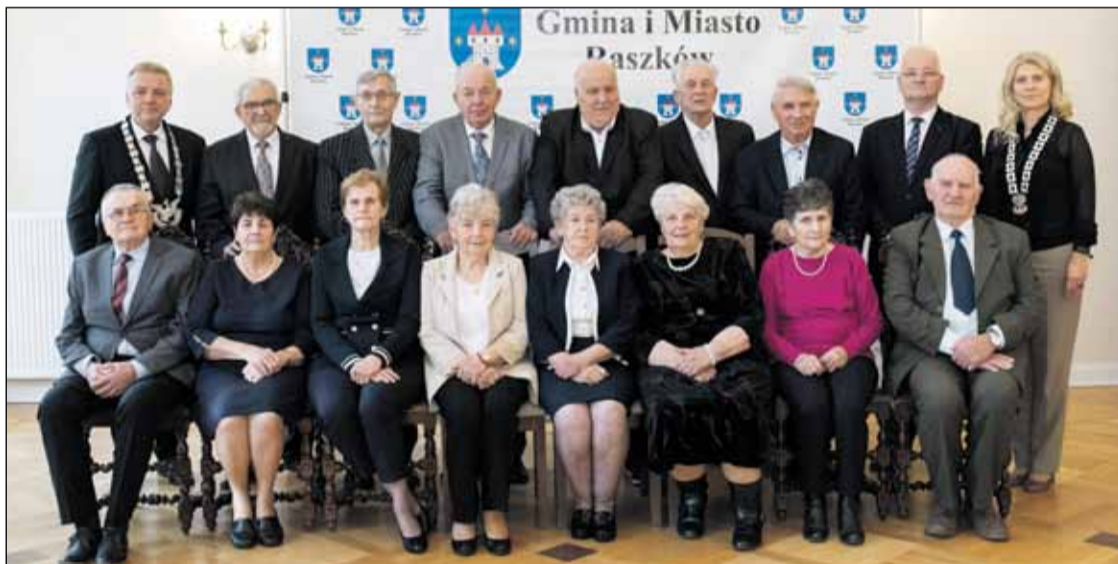
Szmaragdowe Gody, czyli 55-lecie Zaślubin