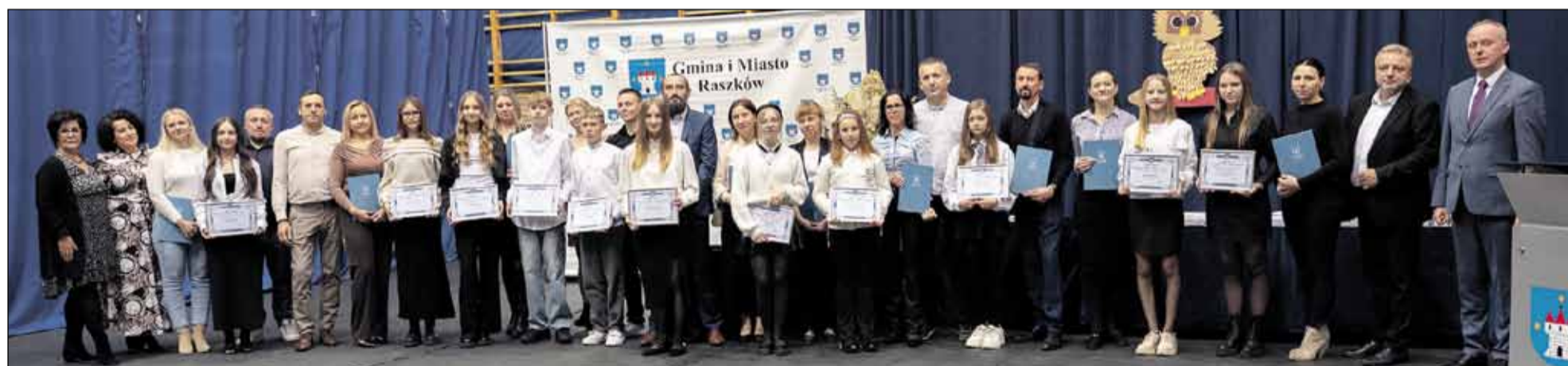
Zespół Szkół im. Orła Białego w Korytach