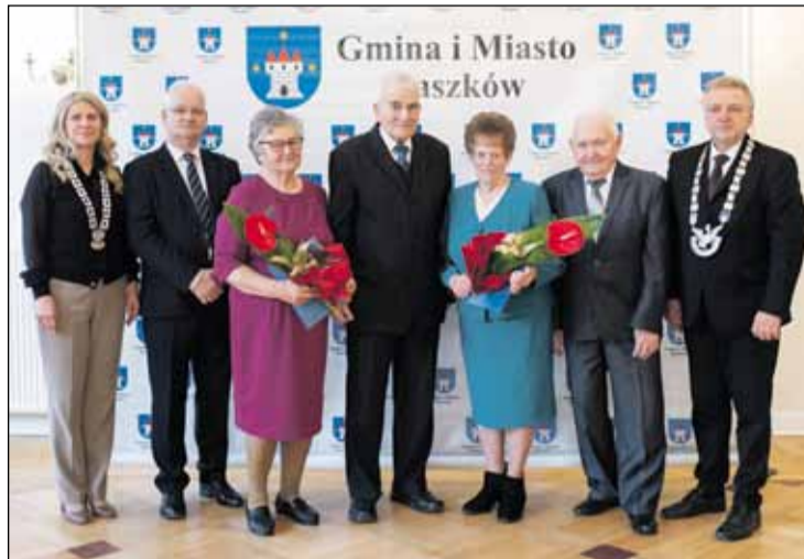
Diamentowe Gody, czyli 60-lecie Zaślubin