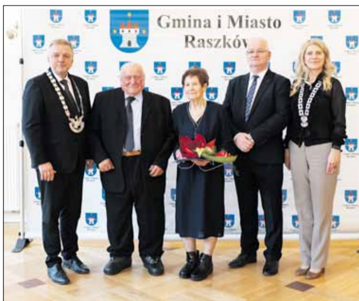
Żelazne Gody, czyli 65-lecie Zaślubin