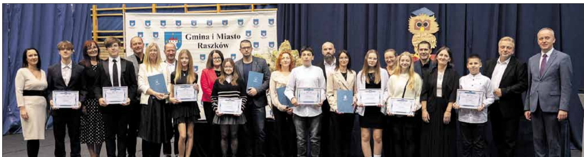
Szkoła Podstawowa im. Arkadego Fiedlera i Armii Krajowej w Raszkowie z siedzibą w Pogrzybowie