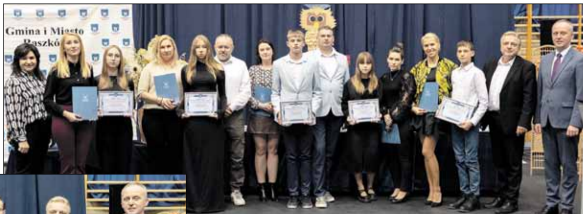
Szkoła Podstawowa im. Powstania Wielkopolskiego w Jankowie Zalesnym