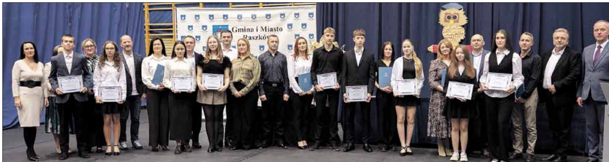
Szkoła Podstawowa im. Arkadego Fiedlera i Armii Krajowej w Raszkowie z siedzibą w Pogrzybowie