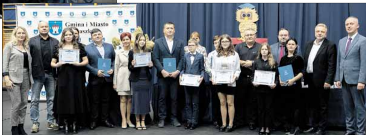
Szkoła Podstawowa im. Żołnierzy Niezłomnych w Ligocie