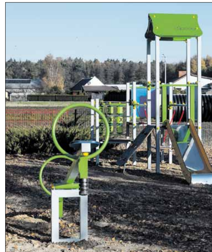
Plac zabaw w Korytach