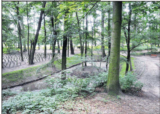
Park w Przybysławicach