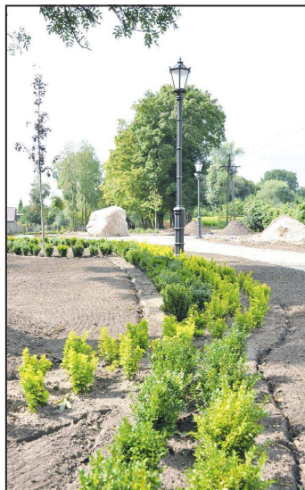
Budowa parku w Raszkowie

Do końca sierpnia planowane jest zakończenie prac na terenie budowanego parku w Raszkowie - tutaj kwota inwestycji jest również znaczna – ponad 400tys. zł. Dokonano licznych nasadzeń, powstaną tu 3 zegary słoneczne i wiele innych ciekawych roślinnych kompozycji. Już za kilka tygodni będzie można spacerować po oświetlonych alejkach, odpoczywając na ławkach lub przy okazałej fontannie. Cały obiekt jest monitorowany. Gmina pozyskała również grant w wysokości 35tys. zł z programu „Lider” na uporządkowanie i drobne zabiegi kosmetyczne w starym parku przy ul. Krotoszyńskiej.