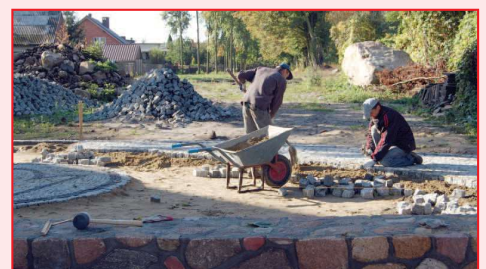
Prace w raszkowskim Parku

mieszkańcom naszej gminy do aktywnego wypoczynku wśród zieleni. Park będzie służył również przedszkolakom, którzy nie będą już musieli przechodzić na drugą stronę ulicy żeby skorzystać z placu zabaw. Na terenie naszej gminy powstaną więc dwa kompleksy rekreacyjne z prawdziwego zdarzenia.