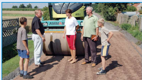
Burmistrz z mieszkańcami Radłowa podczas przebudowy drogi

drogi doczekali się również mieszkańcy Korytnicy . Na długości 852 metrów położono asfaltowy dywanik o grubości 5 cm wraz z podbudową. W sumie wyłożono 2533 m 2 asfaltu. Inwestycja kosztowała 163 tys. zł, a środki pochodziły z budżetu