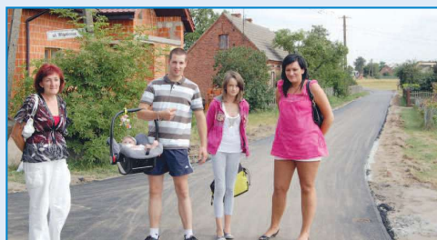
Ulica Środkowa w Raszkowie po remoncie

du Marszałkowskiego. W miejscowości Głogowa wyremontowano odcinek drogi gminnej. Zakres prac obejmował ułożenie kostki i krawężników od drogi powiatowej do remizy strażackiej. Plac w Głogowej jest miejscem, gdzie odbywają się imprezy or-