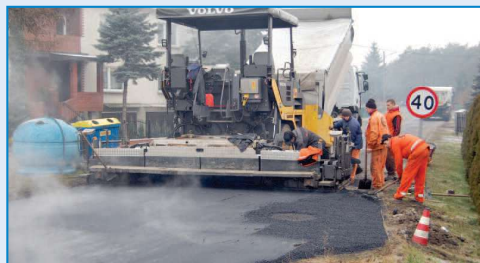
Nowa droga w Rąbczynie

wierzchni na odcinku 320 metrów. Wykonano m. in. 20 cm