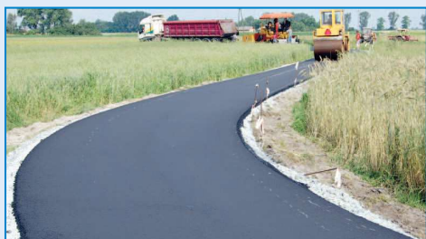
Droga w Korytnicy

gości 670 metrów wykonano wyrównanie tłuczniem o grubości 20 cm oraz położono dywanik asfaltowy o grubości 5 cm. Podczas prac wyrównano również pobocza. W sumie położono 948 m 2 asfaltu. Koszt inwestycji wyniósł 184 tys. zł. Nowej