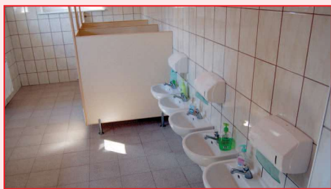
Łazienka dla dzieci - przedszkole w Przybysławicach

rozbiórkowe, dobudowano kuchnię wraz zapleczem, wyremontowano łazienkę, położono nowe posadzki, wymieniono okna i drzwi co pozwoli na większe oszczędności energii cieplnej. Założono również nową instalację wodno – kanalizacyjną, instalację CO oraz instalację elektryczną.