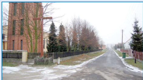
Droga w Grudzielcu

gminy oraz z Funduszu Ochrony Gruntów Rolnych Urzędu Marszałkowskiego. Kolejną drogą w Gminie Raszków która doczekała się nowej, asfaltowej nawierzchni była droga w Radłowie (tzw. „Zaplocie”). Prace polegały na przebudowie na-