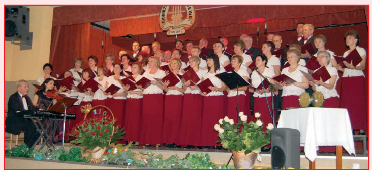
Raszkowskie Towarzystwo Śpiewu