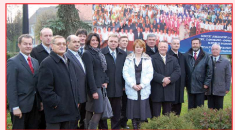
Samorządowcy z Raszkowa z delegacją z Dourges