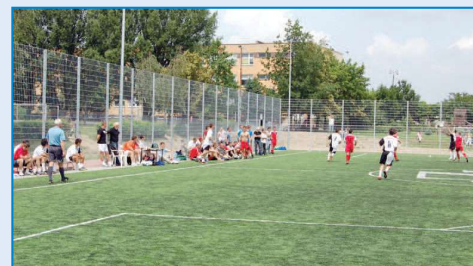
Rozgrywki ligi gminnej na nowym boisku