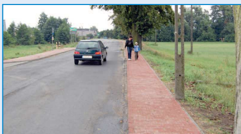
Chodnik przy ośrodku zdrowia

roku współfinansowała budowę chodników przy drogach powiatowych w Jankowie Zalesnym i Sulisławiu za kwotę 50 tys. zł. Remont chodnika wykonano w Raszkwie - w ramach prac położono nową kostkę wraz z krawężnikami na północnej części Rynku. Chodnik został również położony wokół fontanny, która oficjalnie została otwarta podczas tegorocznego Powitania Lata. Koszt zakupu i montażu fontanny wyniósł 25 tys. zł z czego 12,5 tys. zł przekazała na ten cel Rada Osiedla w Raszkwie . Należy również wspomnieć o sporym gronie sponsorów, którzy przyczynili się do upiększenia raszkowskiego rynku oferując pomoc finansową i techniczną. Wszystkim serdecznie dziękujemy. Fontanna wpisala się już w pejzaż miasta o czym świadczy wielkie zaintereso-