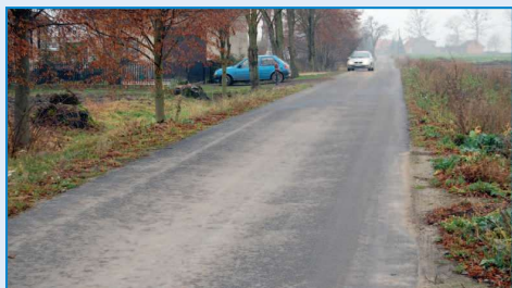
Droga Moszczanka - Skrzebowa

Rok 2009 jest rekordowym pod względem wykonanych inwestycji drogowych w Gminie i Mieście Raszków. Przebudowano drogę gminną łączącą Skrzebowę z Moszczanką . Na dłu-