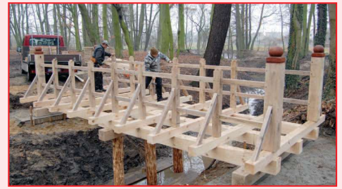
Budowa mostka w Parku w Przybysławicach

REMONT PARKU I CHODNIKA W PRZYBYSŁAWICACH. W dniu 6 sierpnia 2009 roku Zarząd Województwa Wielkopolskiego podjął uchwałę w sprawie zatwierdzenia listy operacji dla działania Odnowa i Rozwój Wsi realizowanego w ramach Programu Rozwoju Obszarów Wiejskich na lata 2007 – 2013. Gmina i Miasto Raszków złożyła wniosek o dofinansowanie zadania pn. „Zagospodarowanie centrum wsi Przybysławice i