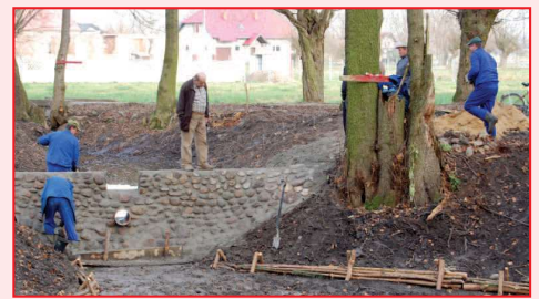
Prace w Parku w Przybysławicach

odnowa parku”. Wniosek uzyskał akceptację Zarządu Województwa. Prace zostaną zakończone do końca 2009 roku. - Koszt prac wyniesie 440 tys. zł z czego 75% to środki zewnętrzne. W tym miejscu dziękuję Rafałowi Żelanowskiemu , radnemu Sejmiku Województwa Wielkopolskiego za wsparcie naszych starań o dofinansowanie. Prace w parku zostaną ukończone w grudniu - powiedział burmistrz Jacek Bartczak .