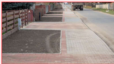
Ukończony chodnik w Przybysławicach