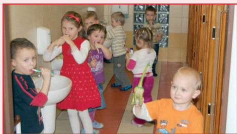
Dzieci w przedszkolu w Radłowie

PRZEDSZKOLE W RADŁOWIE. Od 1 września 2009 roku zostało uruchomione przedszkole w Radłowie. Rodzice od dawna postulowali o utworzenie oddziału przedszkolnego 10 – godzinnego dla dzieci w wieku 3, 4, i 5 lat. Po obliczeniu przez dyrekcję kosztów przystosowania sal do zajęć przedszkolnych i późniejszego utrzymania przedszkola, Burmistrz Gminy i Miasta Raszków podjął decyzję o utworzeniu przedszkola. - Do połowy czerwca do nowego przedszkola zostało zapisanych 46 dzieci co wskazuje na trafność decyzji dotyczącej otwarcia placówki. Część rodziców, którzy do tej pory odwozili dzieci