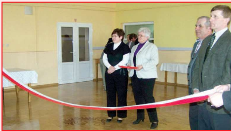
Otwarcie sali wiejskiej w Ligocie

W dniu 14 kwietnia 2009 roku odbyło się oficjalne otwarcie świetlicy wiejskiej w Ligocie po tym jak została w niej wymie-