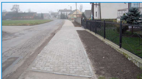
Chodnik w Sulisławiu

wanie mieszkańców. W sobotnie popołudnia można było zobaczyć młode pary, które pozowały do zdjęć przy fontannie. W sierpniu pracownicy interwencyjni ułożyli chodnik przy drodze obok ośrodka zdrowia. Wykonano również wysepkę oraz wjazd do ośrodka. Koszt tego zadania wyniósł 12 tys. zł. Nowe chodniki ułożono również przy salach wiejskich w Rąbczynie i Sulisławiu . - Drogi i chodniki w naszej gminie są priorytetem wśród zadań inwestycyjnych. W tym roku oddaliśmy do użytku kilkanaście odcinków nowych dróg zlokalizowanych na terenie