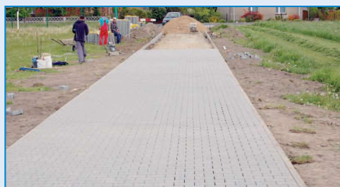
Remont drogi w Głogowej

podbudowę z kruszywa, na którą nałożono 1068 m 2 asfaltu. Zadanie kosztowało 116 tys. złotych i podobnie jak poprzednia inwestycja - zostało pokryte ze środków zabezpieczonych w budżecie gminy oraz Funduszu Ochrony Gruntów Rolnych Urzę-