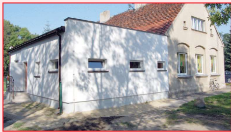
Dobudowana kuchnia w przedszkolu w Przybysławicach

NOWA KUCHNIA W PRZEDSZKOLU W PRZYBYSŁAWICACH. Wraz z początkiem roku szkolnego oddano do użytku nowo wybudowaną kuchnię w przedszkolu w Przybysławicach oraz wyremontowane pomieszczenia sanitarne. Koszt inwestycji wyniósł 214 tys. zł. W ramach umowy wykonano roboty