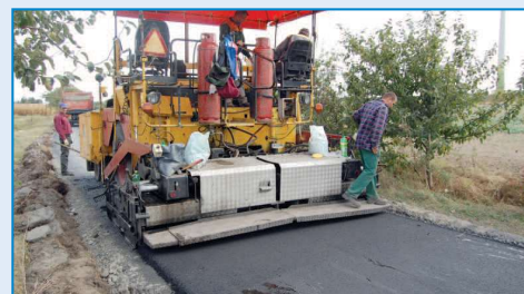
Prace na drodze w Drogosławiu

gające na wykonaniu podbudowy i położenia dywanika asfaltowego kosztowały 80 tys. zł. Środki na ten cel pochodziły z budżetu Gminy i Miasta Raszków. Przebudowano także odcinek drogi w miejscowości Drogosław , stanowiącej przedu-