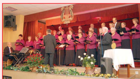
Chór „Moniuszko” z Dourges

lonijnej. W tym roku okazją do spotkania w Raszkowie były obchody 110 rocznicy istnienia Raszkowskiego Towarzystwa Śpiewu. Do Raszkowa przyjechał polonijny chór „Moniuszko” z Dourges oraz Mer tego miasta. Spotkanie z Burmistrzem