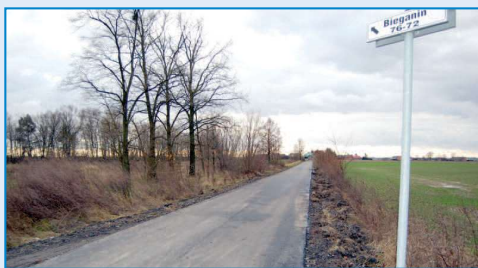
Nowa droga w Bieganinie

Należy przypomnieć także, iż Gmina i Miasto Raszków w bieżącym