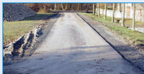
Nowa droga w Niemojewcu

sumie w Gminie i Mieście Raszków w 2009 roku przebudowano i położono nakładkę asfaltową na drogach gminnych i powiatowych o długości 9 km. Należy podkreślić, że w przypadku inwestycji na drogach powiatowych większą część kosztów poniosła Gmina i Miasto Raszków.