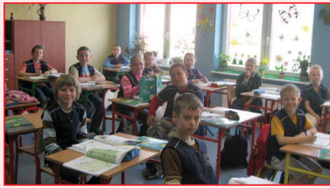
Jedna z nowych sal lekcyjnych w Korytach

NOWE SALE DYDAKTYCZNE W KORYTACH. W Zespole Szkół im. Orła Białego w Korytach najmłodszy uczniowie mogą od tego roku korzystać z bogato wyposażonych sal lekcyjnych do nauczania zintegrowanego. Z kolei wszyscy uczniowie na lekcjach języka angielskiego i niemieckiego korzystają