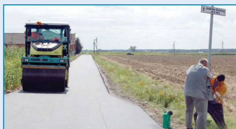
Wyremontowana droga w Jankowie Zaleśnym

ganizowane przez mieszkańców Głogowej, a także duże imprezy gminne (np. Dożynki Gminne). Koszt remontu wraz z zakupem kostki wyniósł 31,5 tys. zł. Następną inwestycją w gminie była przebudowa ulicy Środkowej (Parcelki) w Raszkowie .