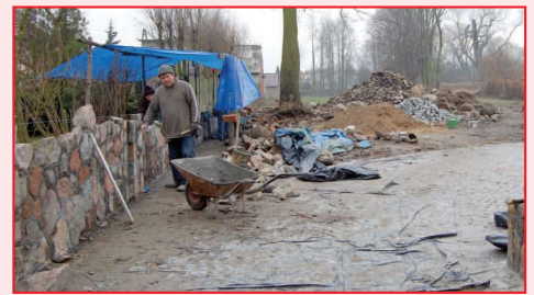
Prace w raszkowskim Parku