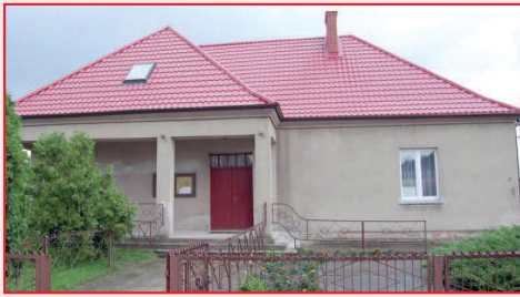
Nowy dach na świetlicy wiejskiej w Jaskółkach

W dniu 14 kwietnia 2009 roku odbyło się oficjalne otwarcie świetlicy wiejskiej w Ligocie po tym jak została w niej wymie-