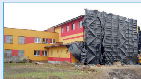
Sala gimnastyczna w Korytach

BUDOWA SALI GIMNASTYCZNEJ W KORYTACH. Trwają prace nad budową nowej sali gimnastycznej przy Zespole Szkół w Korytach . Rada Gminy i Miasta Raszków w tegorocznym budżecie zabezpieczyła na to zadanie 828 tys. zł. Środki te wystarczyły na wybudowanie sali do stanu surowego, zamkniętego. Pozo-