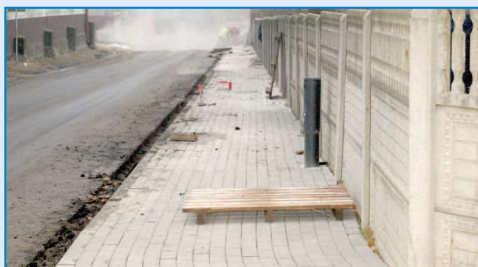
Chodnik w Jankowie Zalesnym

BLISKO BOISKO. Najbardziej oczekiwaną inwestycją sportową była budowa boiska z nawierzchnią z trawy syntetycznej z programu „Blisko