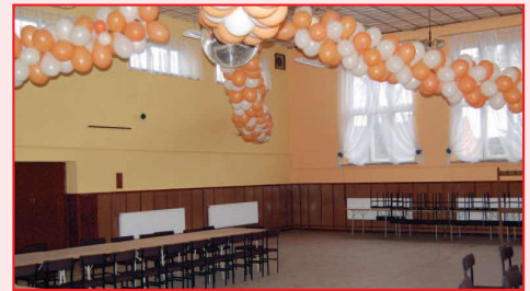
Sala wiejska w Korytnicy