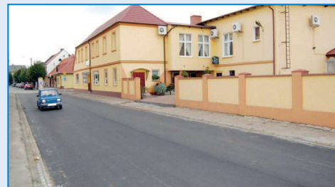
Nowa nakładka na ulicy Kościuszki

toszyńskiej w Raszkowie . W tym roku wyremontowano następny odcinek tej drogi w kierunku centrum. Zakres zadań objął położenie asfaltowej nakładki oraz wkopanie krawężników. Wyremontowany odcinek ma 190 metrów długości, a koszt