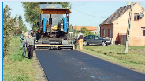
Nowy dywanik asfaltowy w Walentyńowie

wykonanych prac wyniósł 51 tysięcy złotych. Kolejną wyremontowaną ulicą jest ulica Kościuszki w Raszkwie (pomiędzy Rynkiem a ulicą Pleszewską ). Za kwotę 30 tysięcy złotych wykonana została nowa nakładka asfaltowa oraz ściek przy krawężniku ułożony z betonowej kostki. Ulica ta wymagała bezwzględnie remontu z powodu ubytków w nawierzchni, tym bardziej, że nie była remontowana od momentu położenia pierwszego dywanika asfaltowego. Wyremontowano również odcinek drogi gminnej w Walentyńowie , stanowiącej