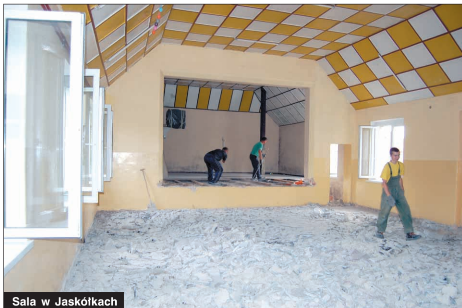
Sala w Jaskółkach