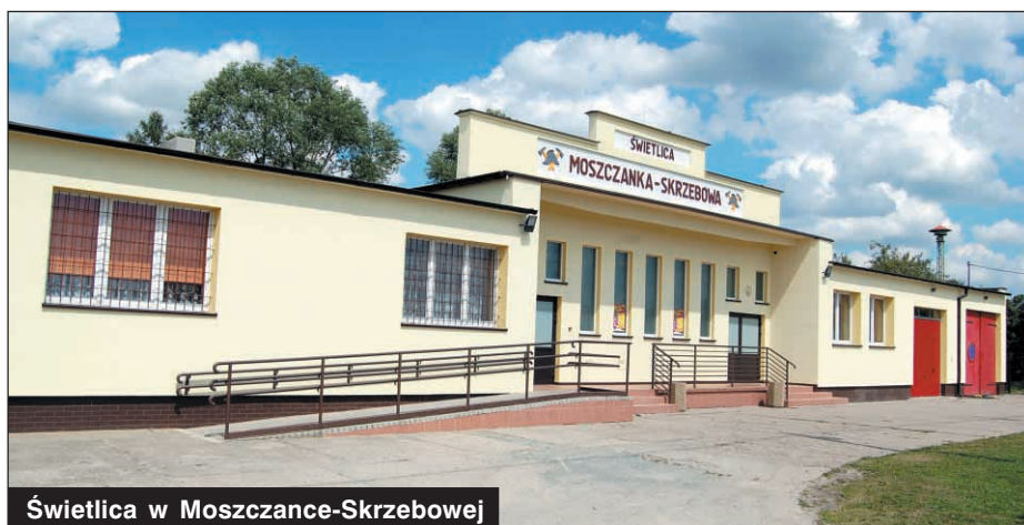
Świetlica w Moszczance-Skrzebowej

związanych z remontem i przebudową pokrycia dachowego, remont instalacji sanitarnych i elektrycznych. Koszt realizacji tego przedsięwzięcia wynosi 195 tys. zł. Na remont tego budynku wydano już od początku prac ponad 217 tys. zł. Termomodernizacji doczekała się również świetlica w Korytnicy. Koszt prac tylko w tym roku to 19.729 zł. Na cały remont obiektu wydano już łącznie 128.225 zł.