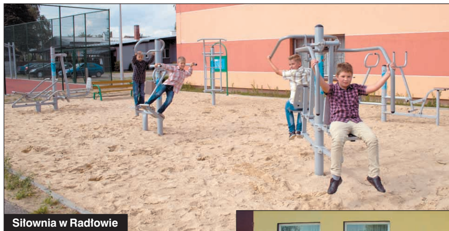
Siłownia w Radłowie

Mieszkańcy Ligoty, Radłowa i Szczurawic mogą już korzystać z nowych siłowni zewnętrznych typu Fit Park. Każda z tych siłowni wyposażona jest w 10 urządzeń do kształtowania sylwetki i poprawy kondycji fizycznej.