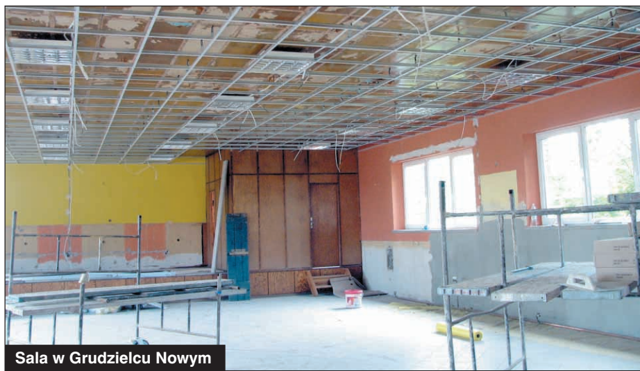
Sala w Grudzielcu Nowym

Rozpoczęły się także prace przy przebudowie sali w Jaskółkach. W ramach robót zaplanowano rozbiórkę posadzki, malowanie