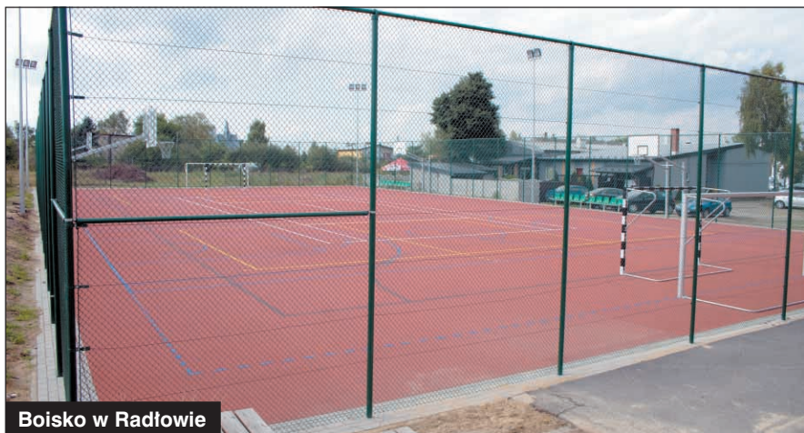
Boisko w Radłowie

Gmina Raszków jest jedną z niewielu gmin w Polsce, która nie zamyka szkół. Władze gminy uważają, że inwestycja w dzieci i młodzież jest jednym z najważniejszych zadań samorządu.