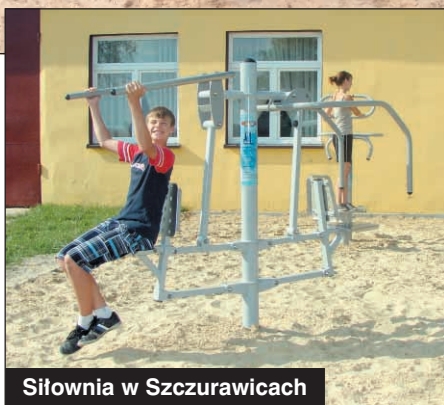
Siłownia w Szczurawicach

Z urządzeń mogą korzystać dzieci, młodzież, osoby dorosłe, starsze i niepełnosprawne. Ćwiczenia wykonywane na tych przyrządach poprawiają wydolność układu sercowo – naczyniowego, kondycję ruchową oraz pomagają w uprawianiu innych sportów. Koszt realizacji tego przedsięwzięcia wyniósł prawie 90 tys. zł. Projekt został dofinansowany w ramach PROW na lata 2007 - 2013 w ramach działania „Wdrażanie Lokalnych Strategii Rozwoju”. Mniejsze siłownie zamontowano w Grudzielcu, Głogowie i Korytnicy.