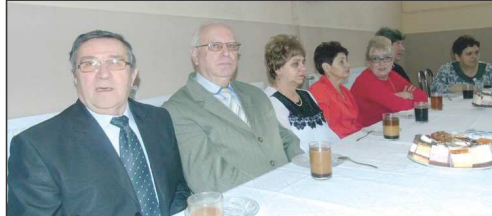
przedstawieniu zebrali gromkie brawa. Następnie dzieci wręczyły swoim babciom i dziadkom własnoręcznie wykonane prezenty oraz zaprosiły do wspólnej zabawy i tańca. Oprawę muzyczną spotkania pokoleń zapewnił Maciej Cicharzewski.