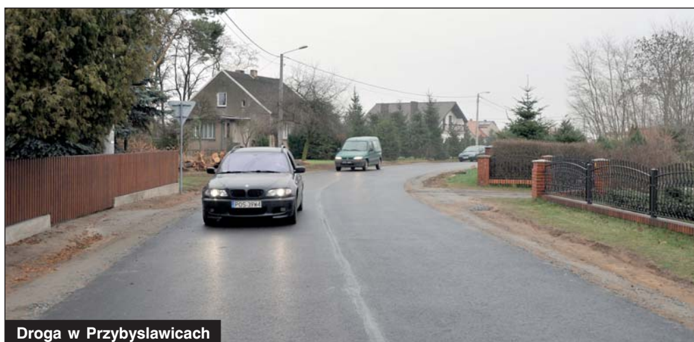
Droga w Przybysławicach

Łagodna pogoda sprzyja remontom i budowom, a korzystając z tych warunków Gmina i Miasto Raszków finalizuje kolejne inwestycje drogowe.