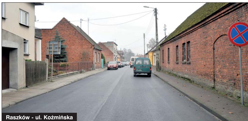
Raszków - ul. Koźmińska