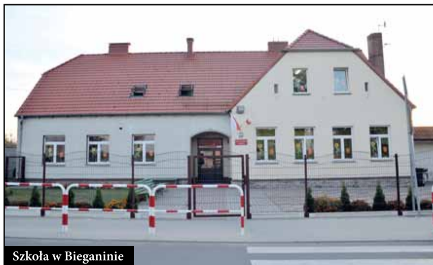
Szkoła w Bieganinie