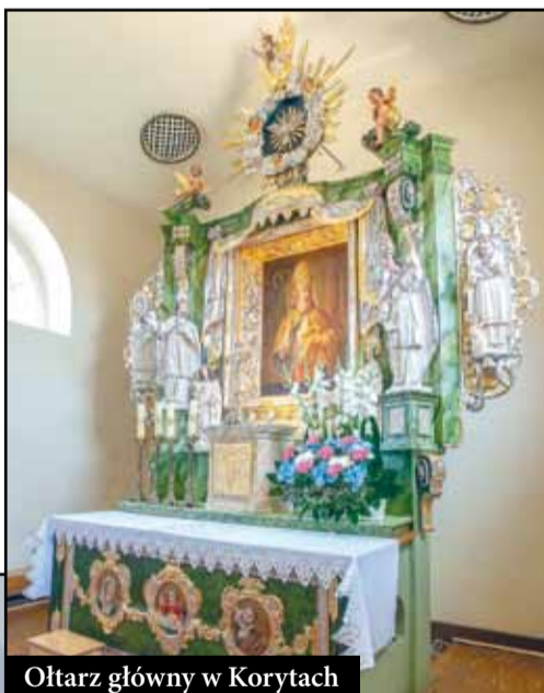
Ołtarz główny w Korytach

W ciągu ostatnich 3 lat gmina przekazała 0,5 mln zł na ratowanie zabytków. Na naszym terenie są to przeważnie obiekty sakralne. Na elewację kościoła w Jankowie Zaleśnym wydano 120 tys. zł. Odnowienie i uruchomienie organów w raszkowskim kościele kosztowało gminę 130 tys. zł. Kwotę 100 tys. zł przekazano na remont ruin kaplicy loretańskiej z XVII w miejscowości Skrzebowa. Przeprowadzono również prace przy odrestaurowaniu ołtarzy: głównego i bocznego w Korytach za 110 tys. zł oraz chrzcielnicę w Skrzebowie za 40 tys. zł.