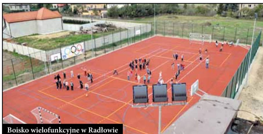
Boisko wielofunkcyjne w Radłowie