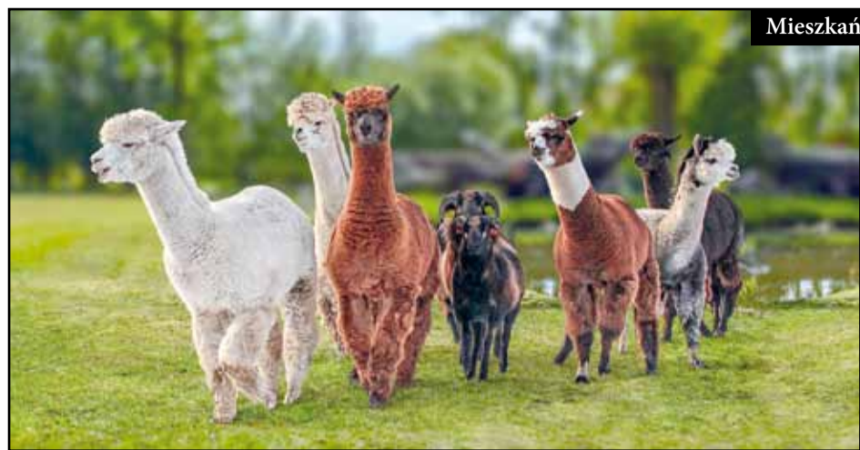
Mieszkańcy mini zoo