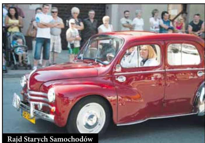
Rajd Starych Samochodów