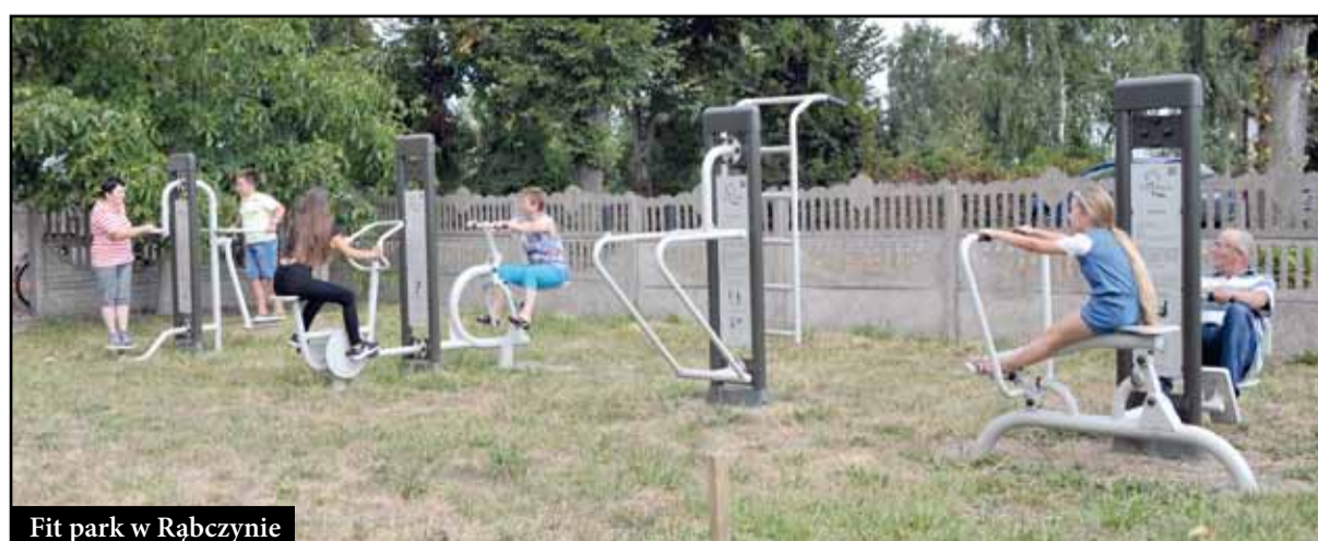
Fit park w Rąbczynie