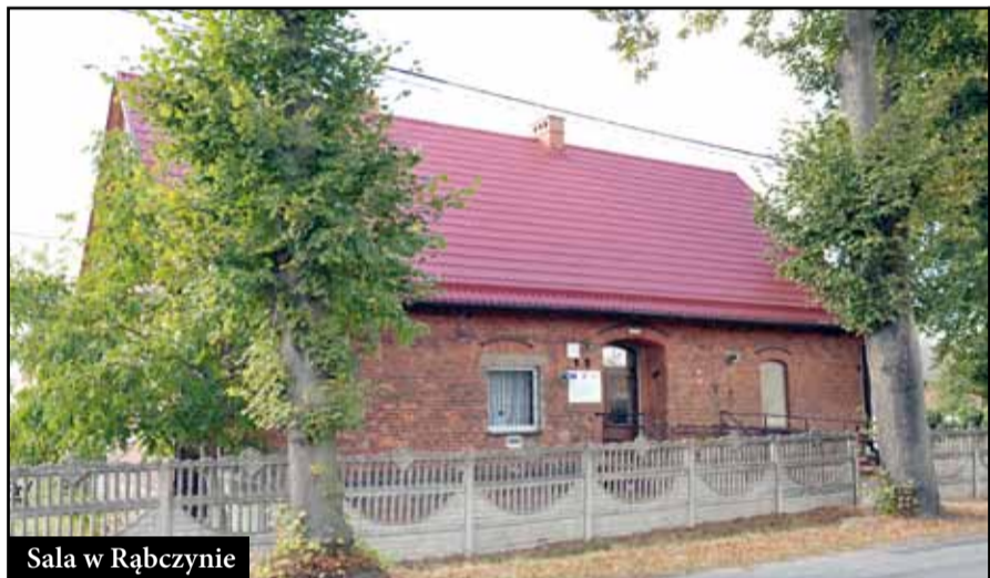
Sala w Rąbczynie