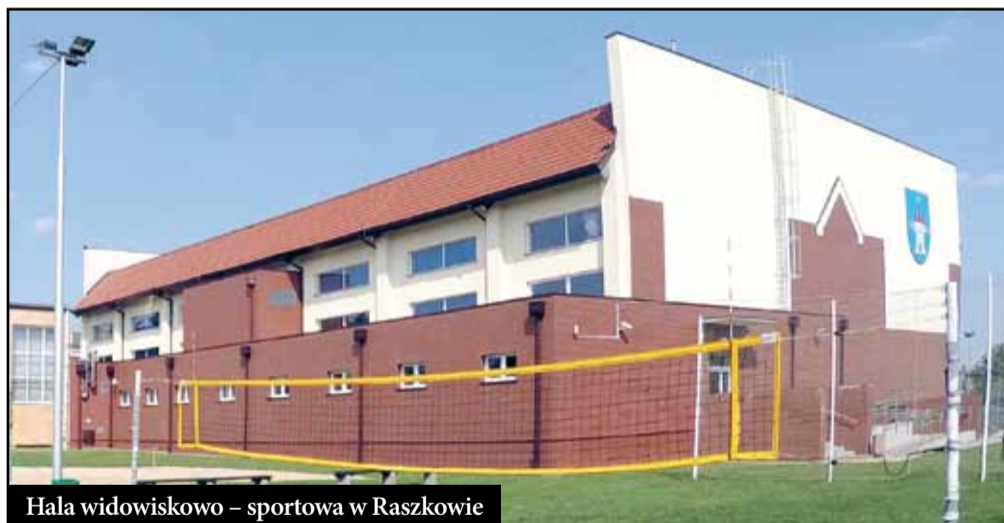
Hala widowiskowo – sportowa w Raszkowie