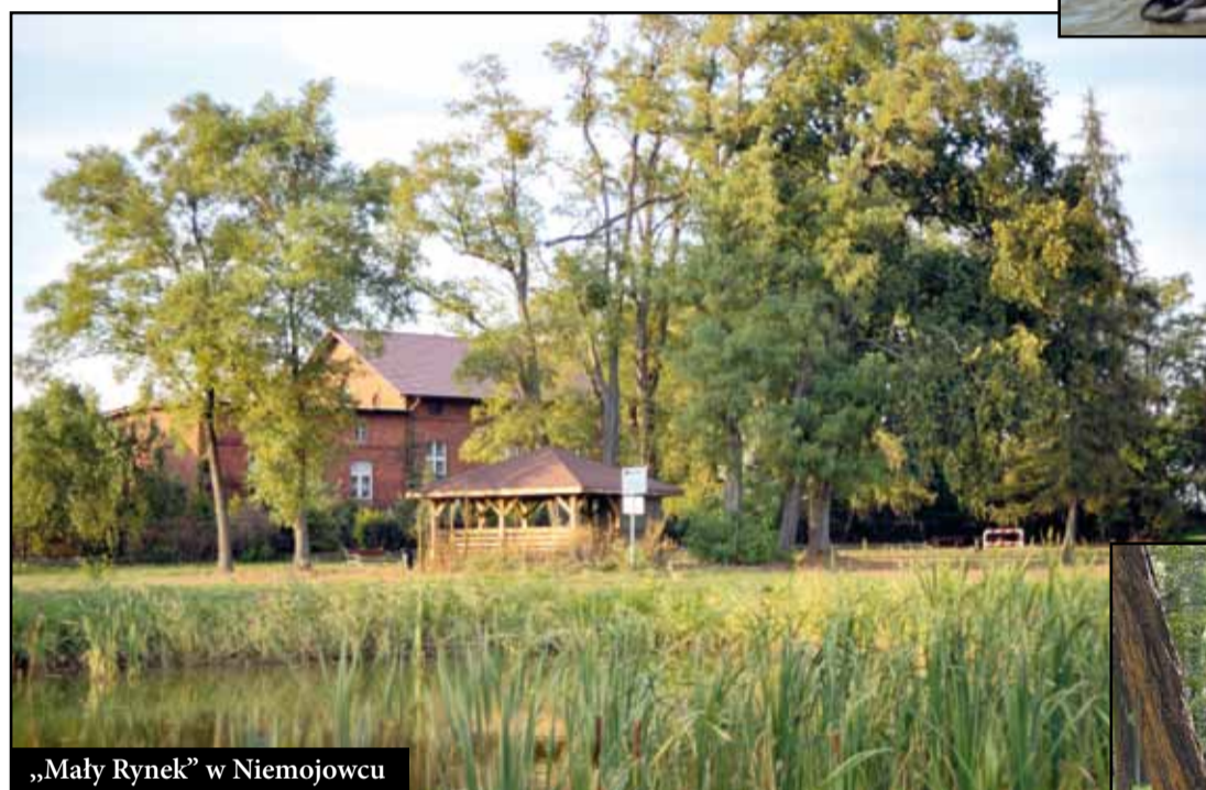
„Mały Rynek” w Niemojowcu