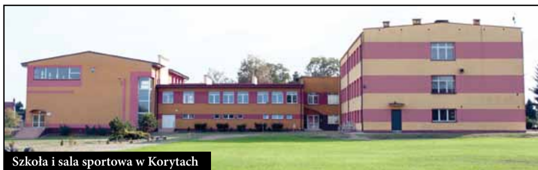
Szkoła i sala sportowa w Korytach

W budżecie gminy, co roku na oświatę przeznaczona jest kwota 17 mln zł. Unowocześnianie istniejących placówek oraz inwestycje w bazę dydaktyczną stwarzają warunki do kształcenia dzieci i młodzieży na dobrym poziomie. Reforma szkolnictwa w 2017 r., po przeprowadzonych konsultacjach społecznych, doprowadziła do powstania sieci szkół ośmioklasowych na terenie całej gminy. Powstały ośmioklasowe szkoły w Bieganinie, Korytach, Ligocie, Jankowie Zalesnym, Radłowie i Raszkowie. Szkoły filialne w Grudzielcu i Korytnicy pozostały nadal szkołami filialnymi z klasami I-III, które podporządkowane są organizacyjnie dotychczasowemu szkółom podstawowym. Zgodnie z nowym prawem oświatowym z września 2017 r. Gimnazjum im. Armii Krajowej w Raszkowie zostało włączone do Szkoły Podstawowej w im. Arkadego Fiedlera w Raszkowie a Gimnazjum w Korytach do Szkoły Podstawowej w Korytach. Każdego roku w szkołach przeprowadzane są remonty. Budynki są sukcesywnie termomodernizowane. Poprzez docieplenie, wymianę okien, elewacje zyskują nowy, estetyczny wygląd. Na wielu placówkach położono nowe pokrycia dachowe. Wybudowano sale gimnastyczne: w Korytach i Raszkowie. Powstały przyszkolne boiska wielofunkcyjne w Raszkowie i Radłowie a w Korytach boisko z systemem nawadniającym. Wyremontowano klasy i doposażono sale lekcyjne w sprzęt audiowizualny i interaktywny. Wszystko to umożliwia prowadzenie zajęć w szkołach gminy Raszków na wysokim poziomie.