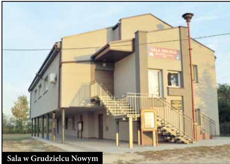
Sala w Grudzielcu Nowym