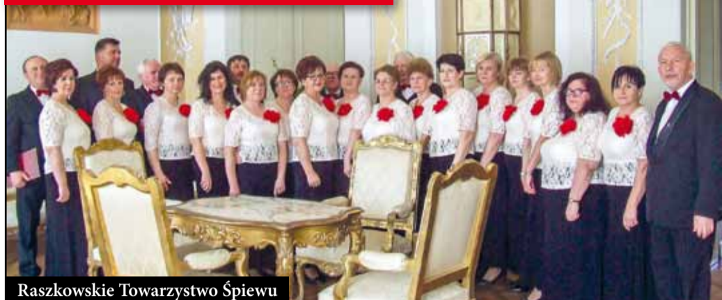
Raszkowski Towarzystwo Śpiewu