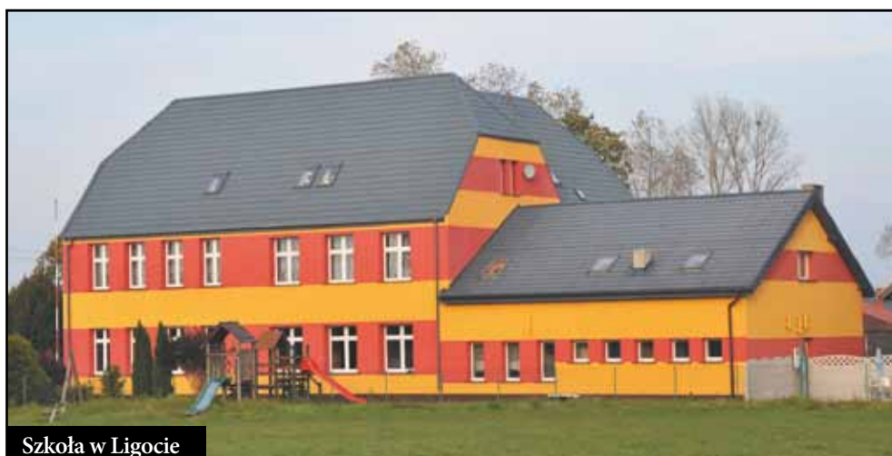
Szkoła w Ligocie