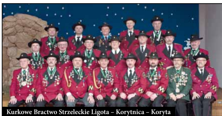
Kurkowe Bractwo Strzeleckie Ligota – Korytnica – Koryta