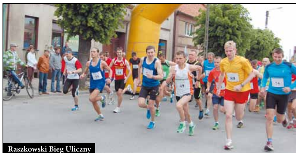
Raszkowski Bieg Uliczny

W kalendarzu stałych imprez sportowych zdomowały się: wyścigi kolarskie, organizowany przez szkołę podstawową w Raszkowie z UKS Arkady Cross Fiedlera, turnieje piłkarskie, tenisa stołowego (w 2018 r. odbyły się w raszkowskiej hali widowiskowo – sportowej Mistrzostwa Polski w Tenisie Stołowym), Raszkowski Bieg Uliczny, różnego rodzaju zawody strażackie oraz wędkarskie. Gmina dofinansowuje takie przedsięwzięcia i działające na naszym terenie organizacje sportowe: klub piłkarski „Raszkowianka”, sekcję tenisa stołowego, sekcję kolarską oraz sportowców, którzy biegają na orientację z UKS Arkady. Promowane również są sporty motorowe np. klub Moto – Ranczo z Przybysławic a także ostrowski żużel, któremu chętnie i licznie kibicują mieszkańcy gminy Raszków. Wyremontowane i unowocześnione strzelnice w Raszkowie i Ligocie umożliwiają organizowanie zawodów strzeleckich o randze ogólnopolskiej prężnie działających bractw kurkowych. Przedstawiciele naszej gminy biorą udział w imprezach sportowych i kulturalnych również poza granicami kraju, dzięki współpracy z partnerskimi miastami – Dougres we Francji i Palata we Włoszech.