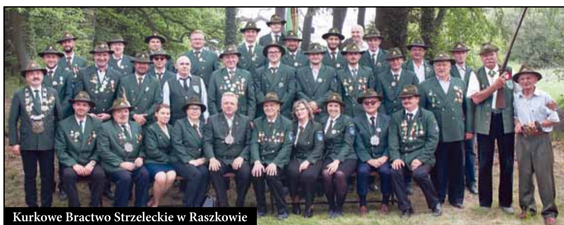
Kurkowe Bractwo Strzeleckie w Raszkowie