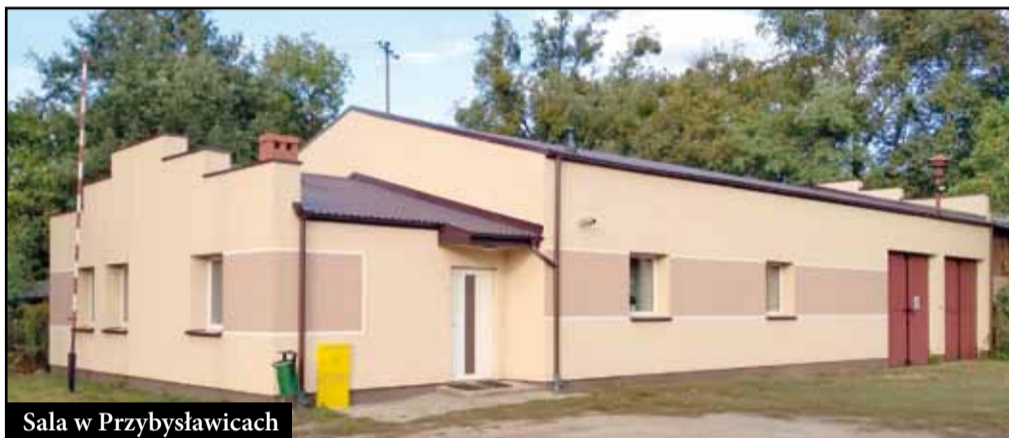
Sala w Przybysławicach