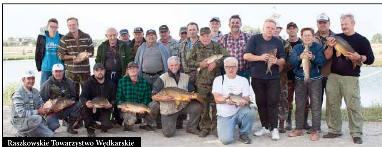
Raszkowskie Towarzystwo Wędkarskie