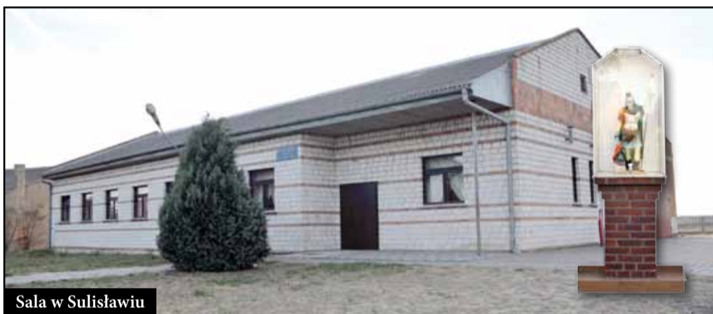
Sala w Sulisławiu