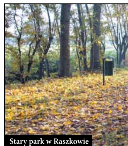
Stary park w Raszkowie