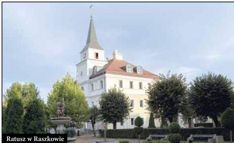
Ratusz w Raszkowie

Dofinansowanie spółki oświetleniowej zaowocowało poprawą stanu oświetlenia na naszym terenie. Stare oprawy lamp zostały wymienione na nowe, powstały nowe ciągi i punkty świetlne w miejscach do tej pory słabo oświetlonych lub przy nowopowstałych drogach osiedlowych. Postawiono również wiele lamp hybrydowych, wykorzystujących energię słoneczną i wiatrową. Obecnie nocą naszą gminę rozświetla 900 lamp.