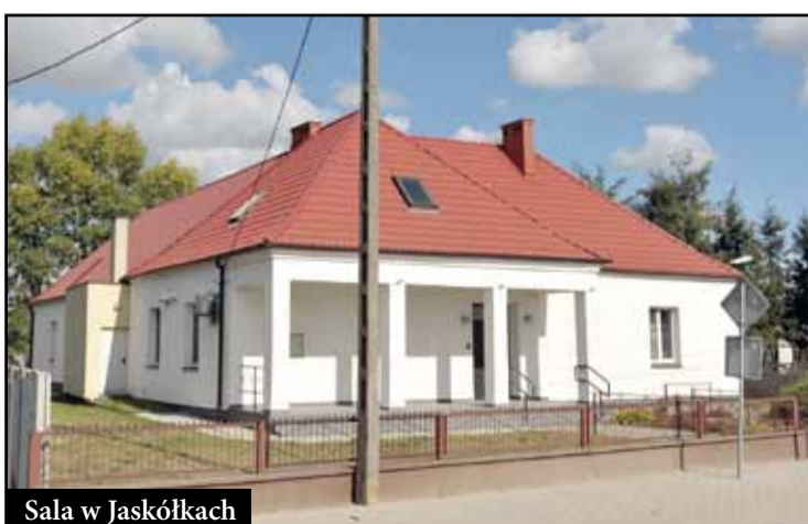
Sala w Jaskółkach