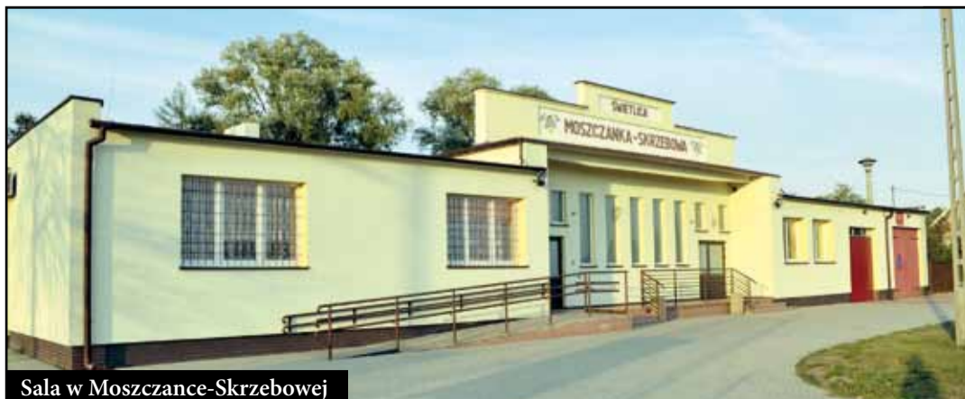
Sala w Moszczance-Skrzebowej