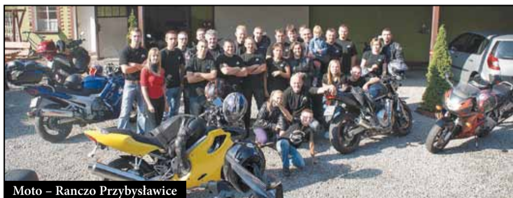
Moto – Ranczo Przybysławice