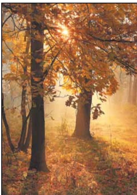
Park w Przybysławicach - w różnych odsłonach

rynki, karolinki, krzyżówki oraz łabędzie czarnoszyje i czarne). W stawie możemy zobaczyć karpie koi i inne kolorowe, ozdobne gatunki ryb. Powstała również woliera, którą zamieszkują barwne papugi, pawie i ciekawe odmiany kur. Spotkamy tutaj 40 gatunków różnych zwierząt.