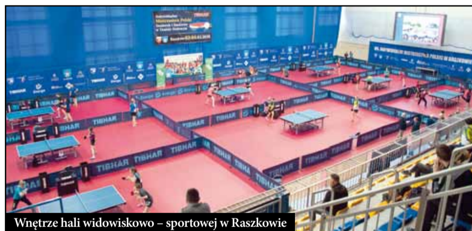
Wnętrze hali widowiskowo – sportowej w Raszkowie