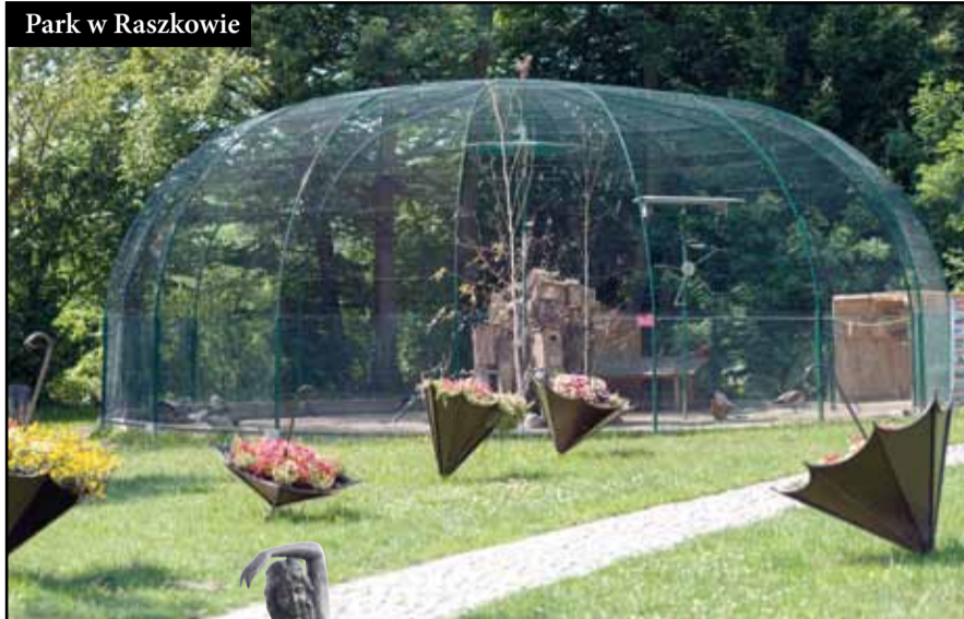
Park w Raszkowie

W centrum miasta gmina zakupiła 2 ha ziemi, na której powstał nowy park w Raszkowie. Przy wejściu zbudowano fontannę. Ciekawa roślinność, stylowe lampy i oryginalne kwiet-