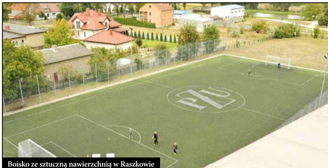
Boisko ze sztuczną nawierzchnią w Raszkowie