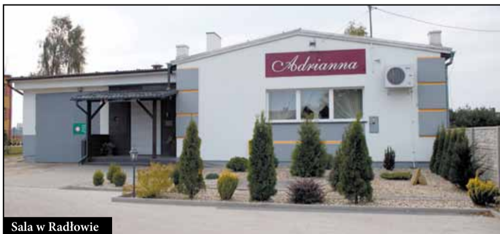
Sala w Radłowie