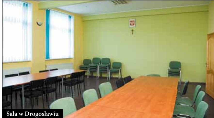
Sala w Drogosławiu