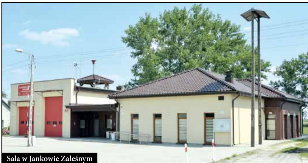
Sala w Jankowie Zalesnym

Trwa rewitalizacja raszkowskiego Ratusza oraz budynku użyteczności publicznej w Przybysławicach, gdzie mieści się GOPS, GZOPO oraz USC. Przez ostatnie lata remontowano i budowano sale wiejskie, przyszedł więc czas na poprawę warunków pracy w urzędach, które służą mieszkańcom. Dużym udogodnieniem dla interesantów będzie winda, zainstalowana w budynku w Przybysławicach. Na te prace udało się pozyskać ze środków zewnętrznych 740 tys. zł.