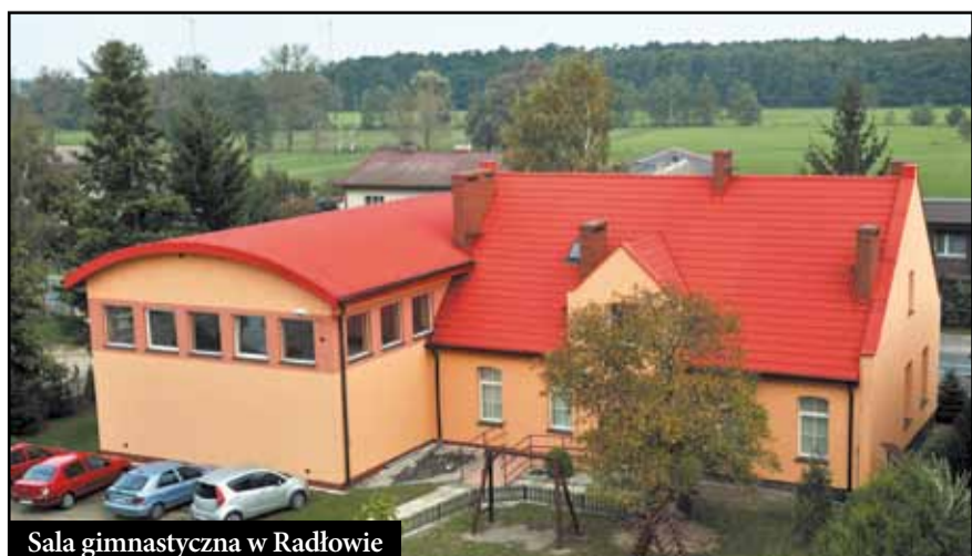
Sala gimnastyczna w Radłowie