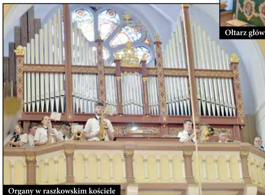
Organy w raszkowskim kościele