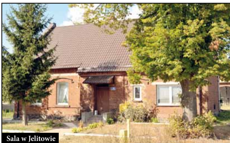
Sala w Jelitowie