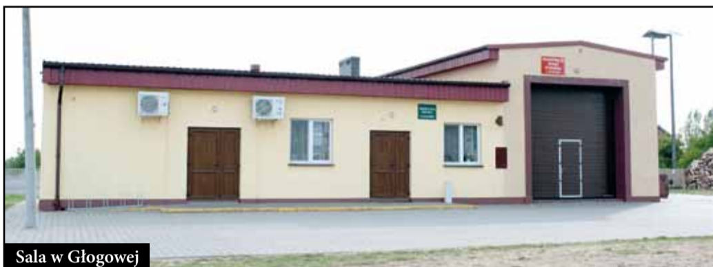
Sala w Głogowej