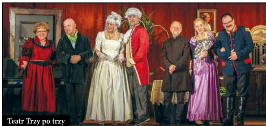
Teatr Trzy po trzy

wiele uroczystości. Poprzez współpracę z lokalnymi stowarzyszeniami gmina jest współorganizatorem wielu imprez artystycznych m.in. Swojskie Spotkania z Folklorem, Raszkowski Spotkania Muzyczne, Koncert przy ruinach i wiele innych.