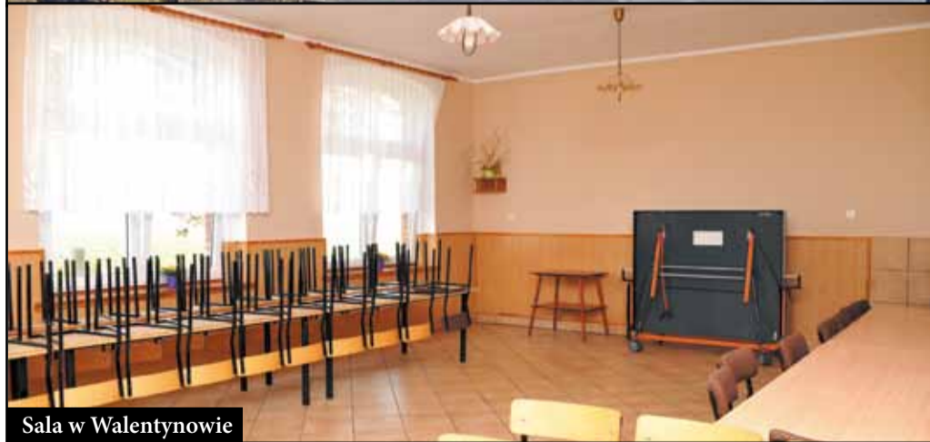
Sala w Walentynowie