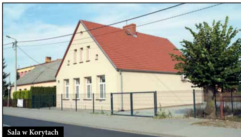
Sala w Korytach