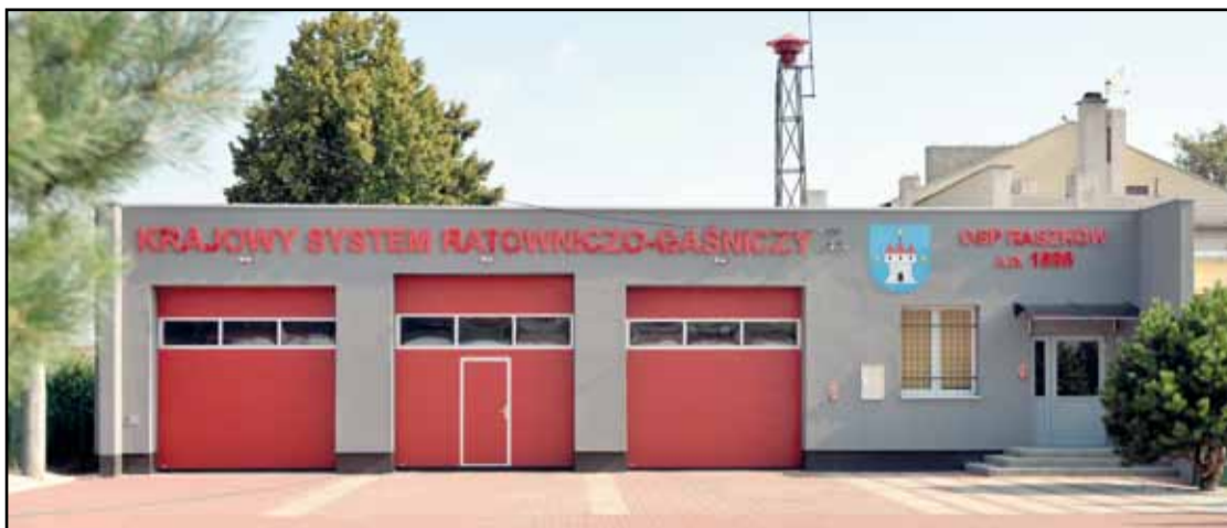
Remiza w Raszkowie

Na terenie Gminy i Miasta Raszków działa 18 jednostek Ochotniczych Straży Pożarnych, w których służbę pełni 934 strażaków (w tym 860 mężczyzn i 74 kobiety). W trosce o bezpieczeństwo mieszkańców gmina stara się doposażać poszczególne jednostki OSP znajdujące się na naszym terenie. Władze samorządowe w ciągu ostatnich 12 lat zakupiły 15 samochodów ratowniczo – gaśniczych dla Ochotniczych Straży Pożarnych. Ostatnio