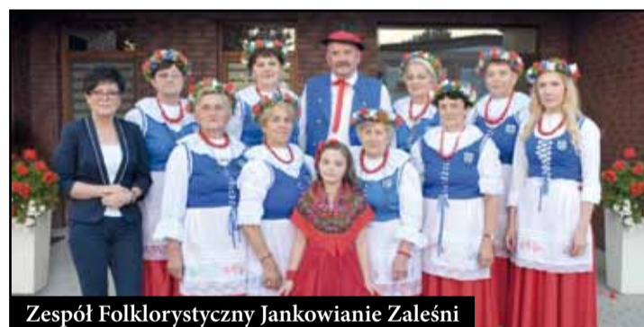
Zespół Folklorystyczny Jankowianie Zaleśni