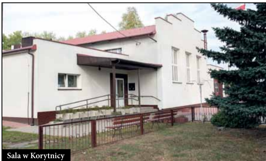
Sala w Korytnicy