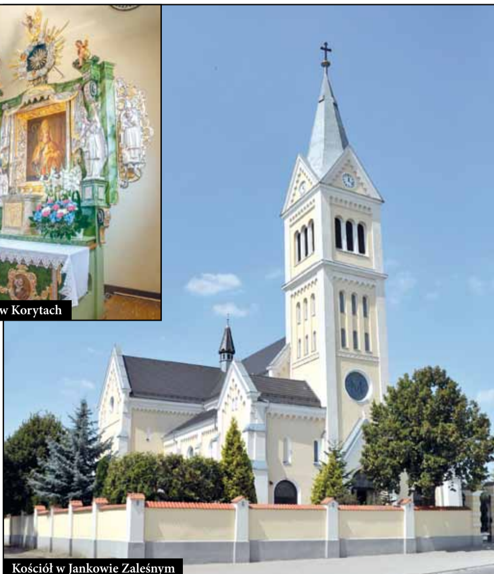
Kościół w Jankowie Zaleśnym