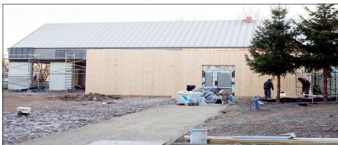
Budowa sali w Bieganinie