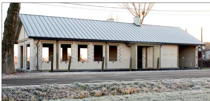
Budowa sali w Walentynowie