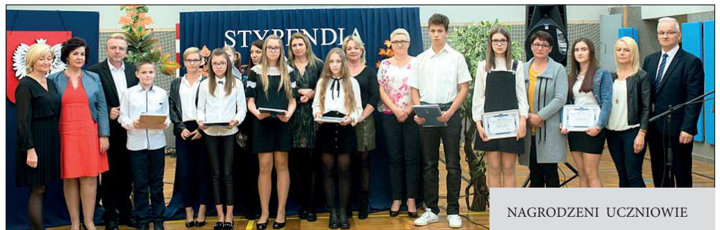
Zespół Szkół im. Orła Białego w Korytach