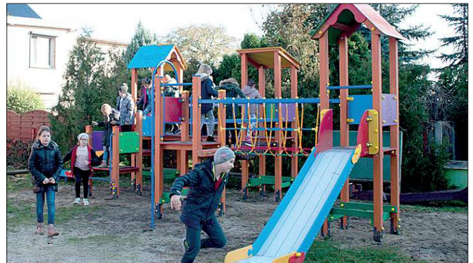
Plac zabaw w Radłowie

ten cel kwotę 38,9 tys. zł. To już 16. samochód dla jednostek OSP na terenie gminy Raszków.