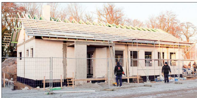
Budowa sali przy strzelnicy bractwa kurkowego