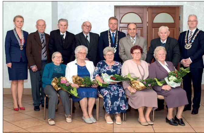
Jubilaci, którzy w 2018 roku obchodzili Diamentowe i Żelazne Gody

Prawdziwie zgodne i dobre małżeństwo to takie, które jest w stanie przetrwać wszystkie życiowe zawieruchy, by po latach zyskać wzajemne zrozumienie,