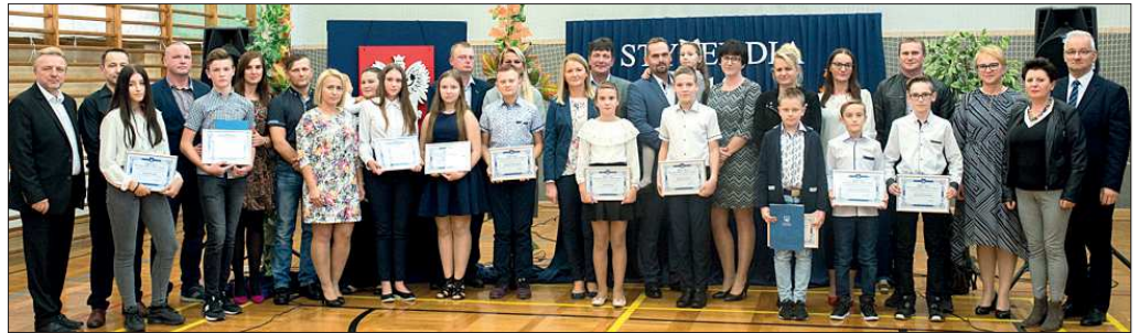
Szkoła Podstawowa im. św. Jana Pawła II w Radłowie

Do ubiegania się o stypendium Burmistrza Gminy i Miasta Raszków uprawnieni są uczniowie klas IV-VIII szkół podstawowych, uczniowie klas gimnazjalnych pobierający naukę w szkołach na terenie Gminy i Miasta Raszków bez względu na miejsce zamieszkania, którzy w roku szkolnym 2018/2019 w