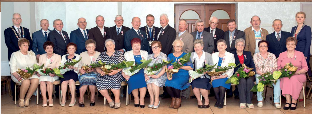
Jubilaci, którzy w 2018 roku obchodzili Złote Gody