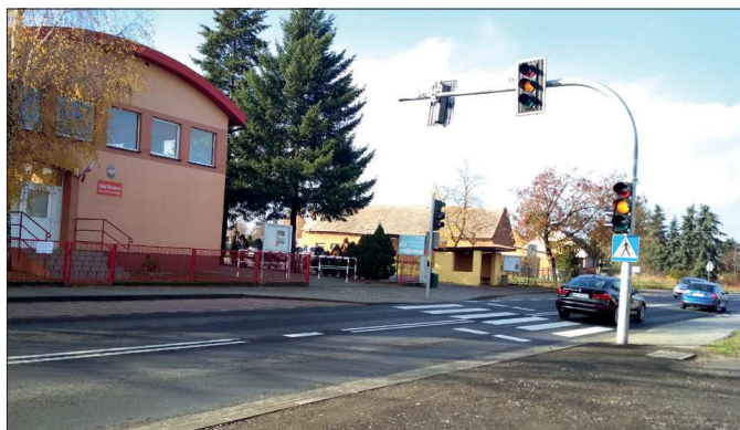
Sygnalizacja świetlna w Radłowie

Zakończył się I etap budowy sal wiejskich w Walentynowie i Bugaju. W tym roku wybudowano sale w stanie surowym, otwartym. Koszt wykonanych prac w Walentynowie to prawie 195 tys. zł, natomiast w Bugaju 161 tys. zł. Realizo-