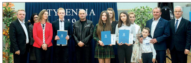
Szkoła Podstawowa w Ligocie