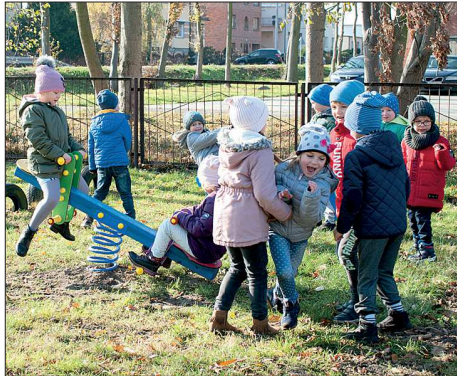
Plac zabaw w Przybysławicach

Lekki samochód ratowniczo - gaśniczy Peugeot Boxer o wartości prawie 190 tys. zł otrzymała jednostka OSP w Jankowie Zalesnym. Zakup ten wsparł Urząd Marszałkowski oraz gmina Raszków, która z budżetu przeznaczyła na