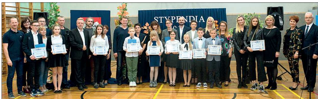
Szkoła Podstawowa im. Arkadego Fiedlera i Armii Krajowej w Raszkowie z siedzibą w Pogrzebowie