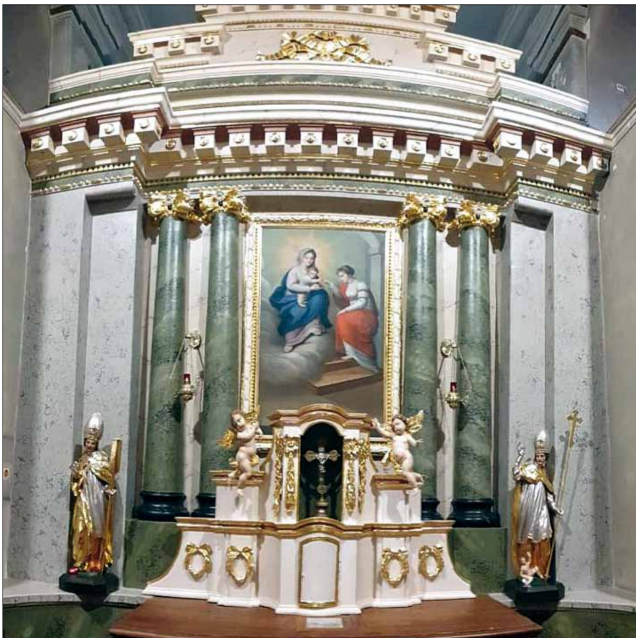
Ółtarz główny w kościele pw. Św. Katarzyny Aleksandryjskiej w Pogrzebówie

mont ruin kaplicy pw. Zwiastowania NMP Loretańskiej w Skrzebówie” - najstarszego zabytku nieruchomego na terenie naszej gminy.