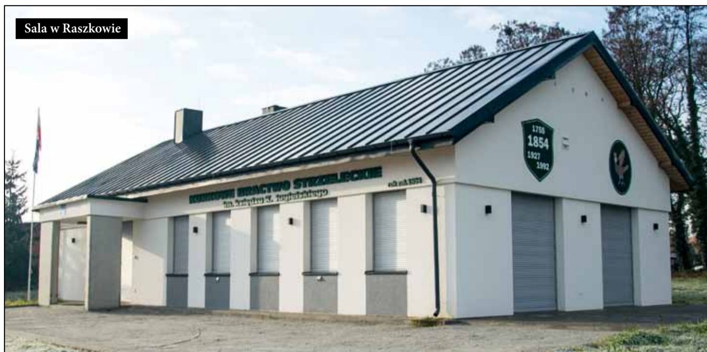
Sala w Raszkowie

DROGOSŁAW - W listopadzie została oddana sala w Drogosławiu. Prace związane z przebudową obiektu trwały ponad rok. Koszt inwestycji wyniósł prawie 660 tys. zł. Efekt przeprowadzonego remontu przeszedł najsmielsze oczekiwa-