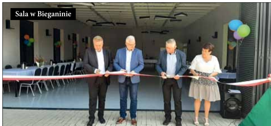
Sala w Bieganinie

wnętrze budynku – kuchnię i ściany wewnętrzne, dobudowę wiatrołapu, powstaną też nowe okna.