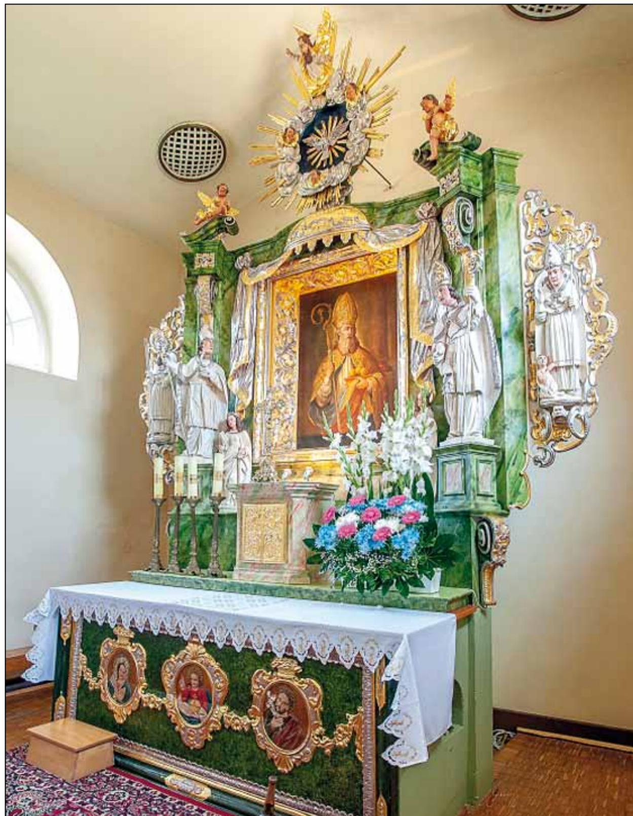
Ołtarz w kościele św. Mikołaja i Matki Boskiej Szkaplerznej w Korytach