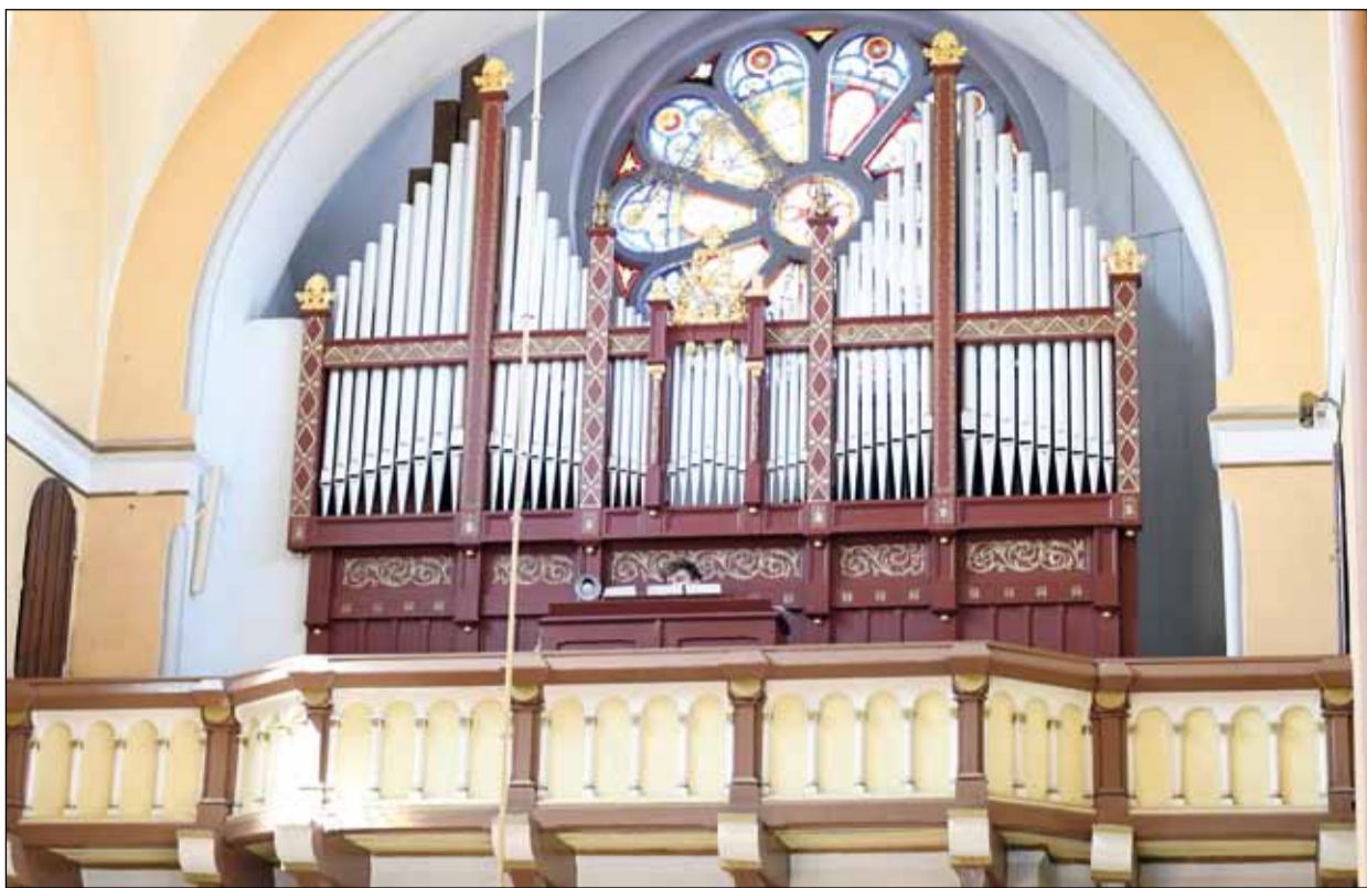
Wyremontowane organy piszczałkowe w kościele pw. Podwyższenia Krzyża Świętego w Raszkowie