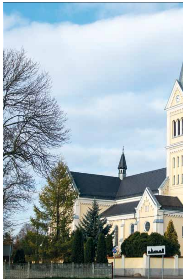
Kościół św. Wojciecha w Jankowie Zaleśnym

W 2017 roku w raszkowskim kościele środki przekazane przez gminę w ramach dotacji zostały przeznaczone na przeprowadzenie remontu zabytkowych organów piszczalkowych. Wysokość dotacji wyniosła 130 tys. zł .