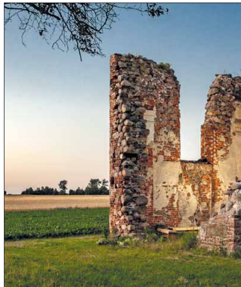
Ruiny kaplicy pw. Zwiastowania NMP Loretańskiej w Skrzebowej

W roku 2017 kwotę 70 tys. zł z budżetu przeznaczono na prace restauratorskie i konserwatorskie ołtarza głównego oraz rzeźby krucyfiksu procesyjnego w kościele w Korytach. W kolejnych latach dofinansowano prace konserwatorskie: 2018 r. – ołtarz boczny – 40 tys. zł , 2019 rok - ołtarz boczny kaplica południowa - 40 tys. zł oraz w 2020 r.- ołtarzyk przyścienny - 18 tys. zł .