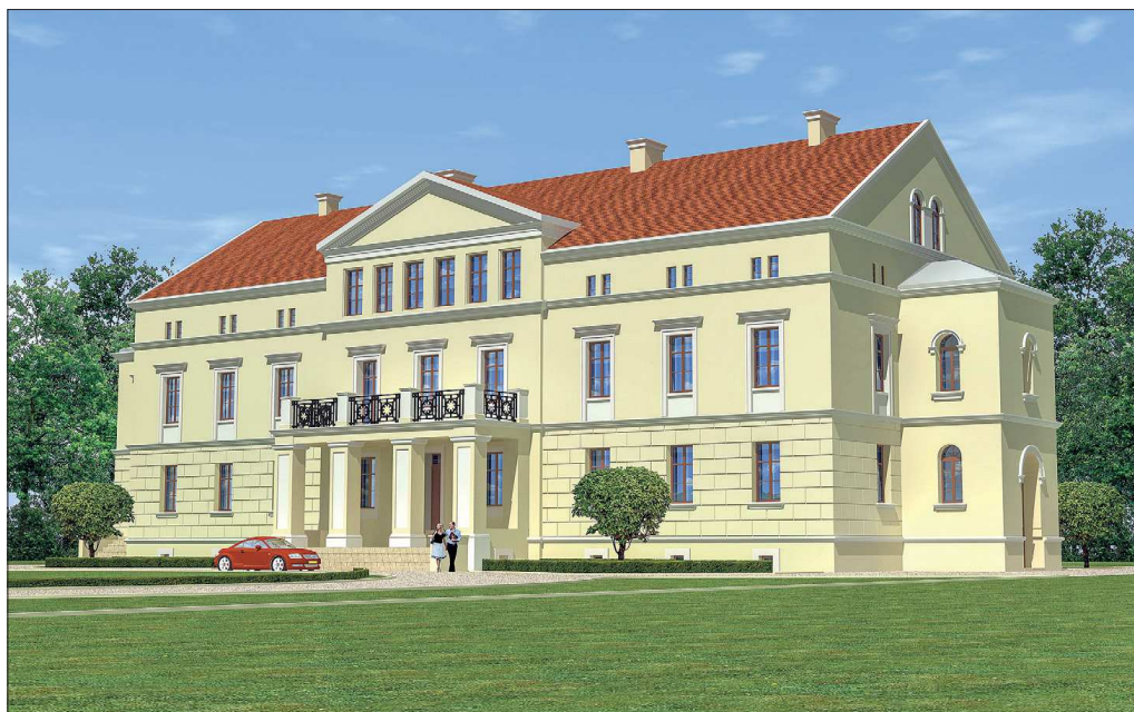
Wizualizacja pałacu w Przybysławicach

Kwotę 1 mln zł przeznaczono na infrastrukturę drogową. Z tej sumy gmina przekazuje dla powiatu na inwestycje drogowe realizowane na drogach powiatowych w naszej gminie kwotę 400 tys. zł.