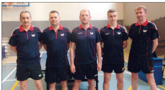
Zespół Ochmana Raszków

Teniści Ochmana Raszków mają za sobą ostatni występ w sezonie. W maju Raszkowianie w Szczecinie rywalizowali w finale rozgrywek II ligi. Tam stoczyli zacięte boje o awans.