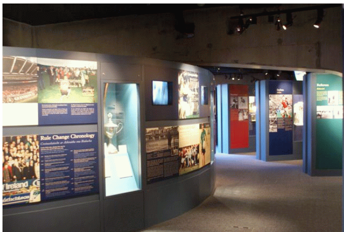
Muzeum GAA w Dublinie na stadionie Croke Park

Nie przypomina ona zupełnie znanej nam odmiany gry zespołowej. Gaelicka piłka ręczna to gra dwóch lub czterech zawodników (singiel lub debel). Piłkę odbija się dłonią lub pięścią w taki sposób, aby odbita od muru nie została „odebrana” przez przeciwnika. Przypomina nieco grę w squash tylko, że za pomocą rąk.