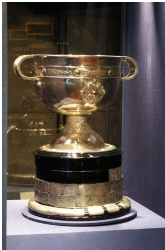
Sam Maguire Cup najważniejsze trofeum w GAA

Gaelic Athletic Association - jest irlandzką międzynarodową amatorską organizacją sportową i kulturalną, koncentrującą się przede wszystkim na promowaniu tubylczych gier i rozrywek gaelickich