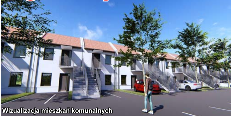
Wizualizacja mieszkań komunalnych

Budowa małych mieszkań o podwyższonym standardzie dla osób mieszkających w trudnych warunkach oraz noclegowni i pomieszczeń tymczasowych dla mieszkańców, którzy nie płacą czynszów – to propozycja naszych władz samorządowych, by poprawić trudną sytuację bytowo - materialną i ograniczyć ubóstwo w gminie.