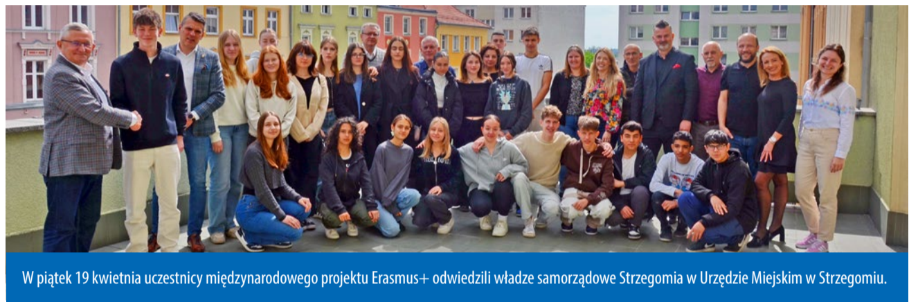
W piątek 19 kwietnia uczestnicy międzynarodowego projektu Erasmus+ odwiedzili władze samorządowe Strzegomia w Urzędzie Miejskim w Strzegomiu.