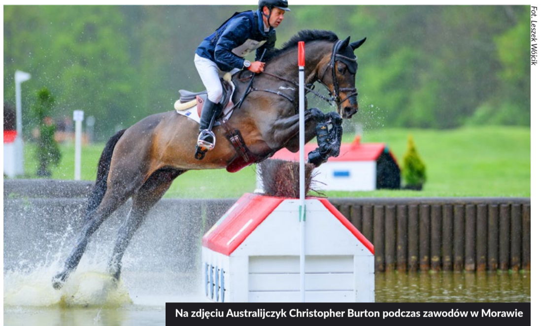
Na zdjęciu Australijczyk Christopher Burton podczas zawodów w Morawie

Zawody Strzegom Spring Open wyłoniły zwycięzców dziesięciu konkursów, startowało w nich ponad 330 koni reprezentujących 24 kraje.