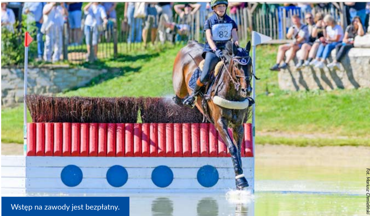
Wstęp na zawody jest bezpłatny.

Będą to już siódme mistrzostwa Europy organizowane przez Klub Sportowy LKS Stragona. Pierwsze odbyły się w 2012 r. w kategorii juniorów, w 2015 r. roku w kategorii młodych jeźdźców, w 2017 r. - seniorów, a w latach 2019, 2021, 2022 - kuców.