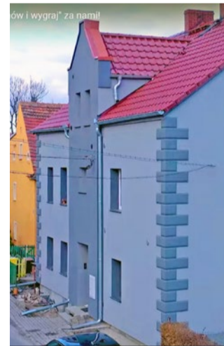
Zwycięzca ostatniej edycji w kategorii wspólnot mieszkaniowych – Graniczna 36.

W dotychczasowych trzynastu edycjach odnowiono 237 budynków (157 budynków wielorodzinnych, 79 budynków jednorodzinnych i 1 budynek inny niż mieszkalny). W sumie gmina Strzegom przeznaczyła ze swojego budżetu kwotę ponad 3 mln zł na nagrody w tym konkursie.