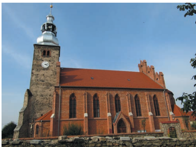
Kościół w Jaroszowie z wyremontowaną wieżą (sygnatura)

Polski Ład, udało się wyremontować dwa kościoły: w Jaroszowie i Rogoźnicy.