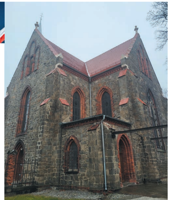
Kościół w Rogoźnicy z wyremontowanym pokryciem dachowym