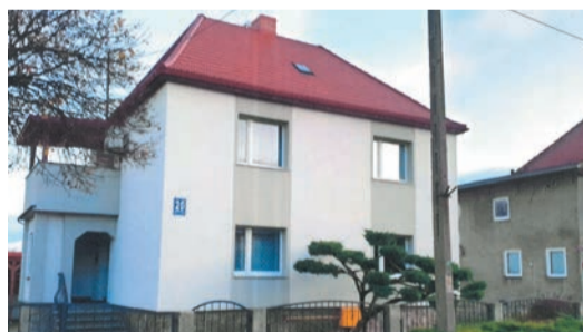
I miejsce ex aequo – Budynek przy ul. Niecałej 20 w Strzegomiu