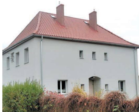
I miejsce ex aequo – Budynek przy ul. Legnickiej 60 w Strzegomiu

Serdecznie gratulujemy wszystkim laureatom.