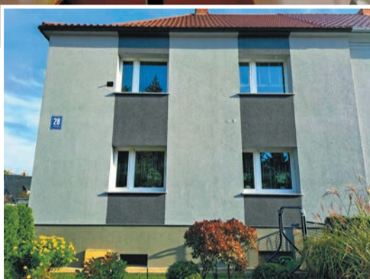
I miejsce – Budynek przy ul. Armii Krajowej 28 w Strzegomiu