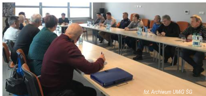
fol. Archiwum UMiG ŚG