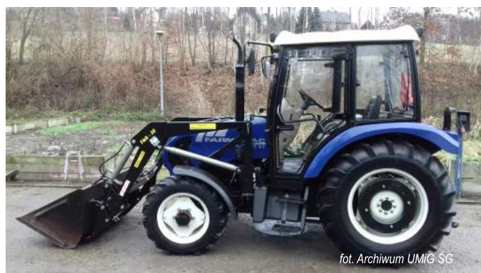
fol. Archiwum UMiG ŚG

Budowa sieci kanalizacji sanitarnej w Gminie Świątniki Górne