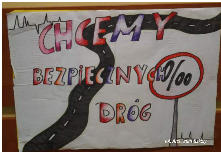
fol. Archiwum Szkoły