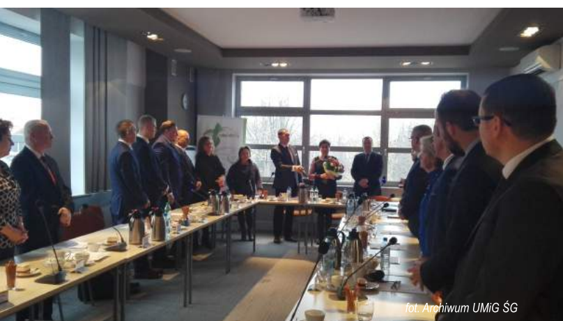
fol. Archiwum UMIG ŚG

W składach tych komisji znaleźli się wszyscy Radni obecnej kadencji. Na pierwszych posiedzeniach komisji wybrani zostali również ich przewodniczący.