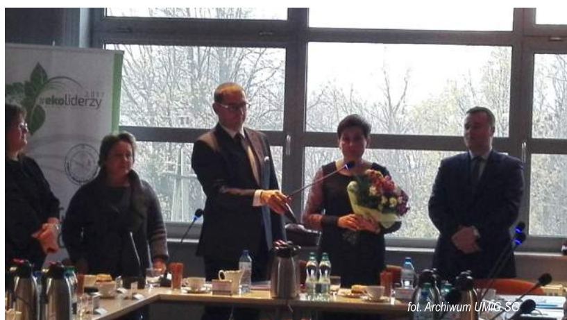
fol. Archiwum UMIG ŚG