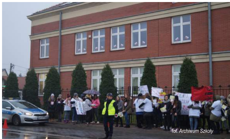
fol. Archiwum Szkoły