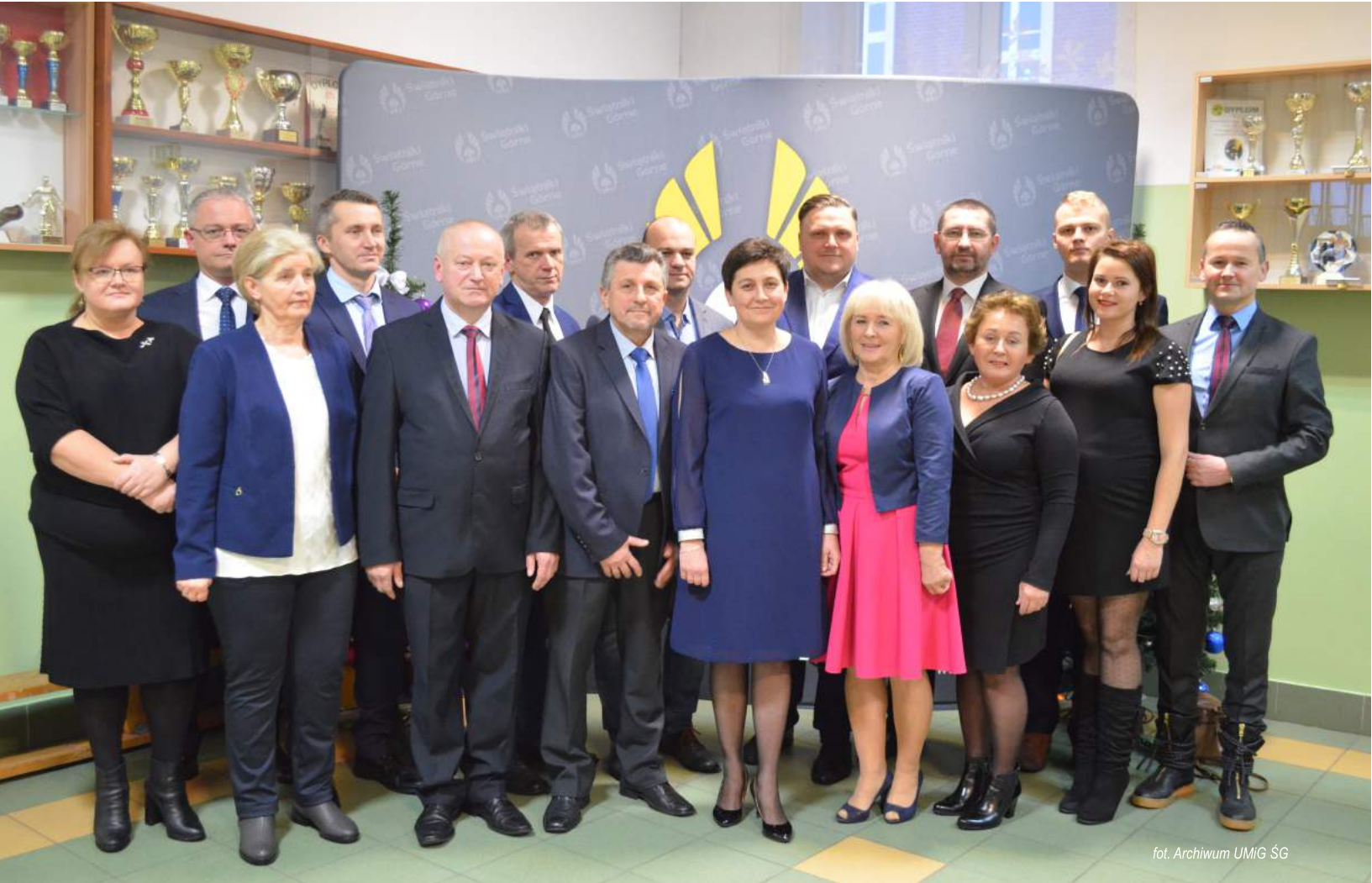
fol. Archiwum UMIG ŚG