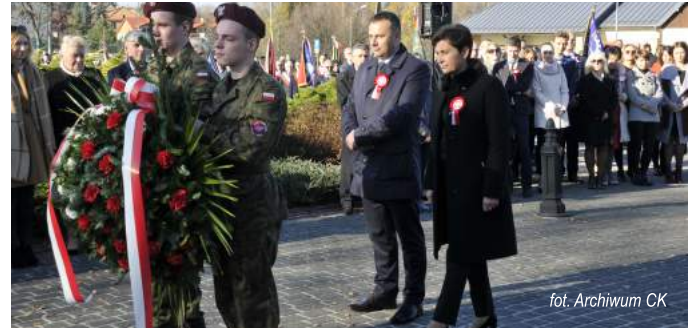
fol. Archiwum CK