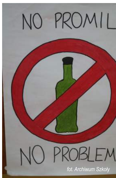
fol. Archiwum Szkoły