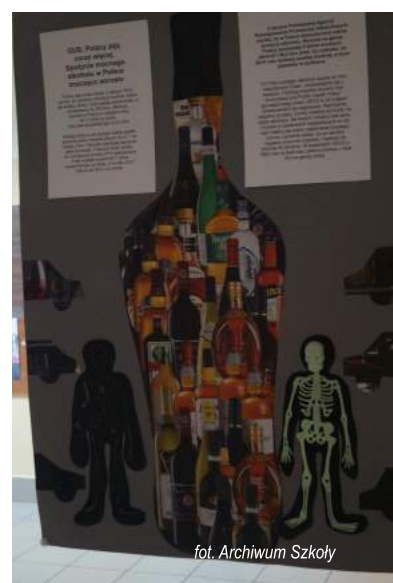
fol. Archiwum Szkoły