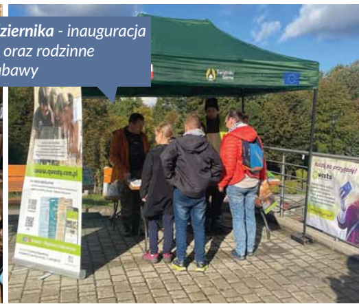
2 października - inauguracja questu oraz rodzinne gry i zabawy