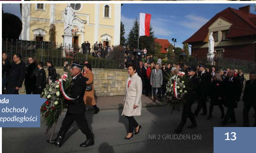
11 listopada - Gminne obchody Święta Niepodległości