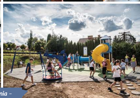
9 września – Otwarcie strefy rekreacyjnej w Ochojnie