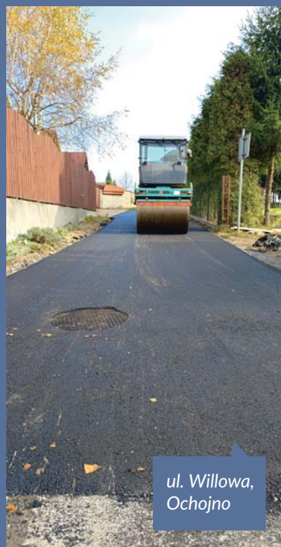
ul. Willowa, Ochojno

Tekst: Patrycja Lis