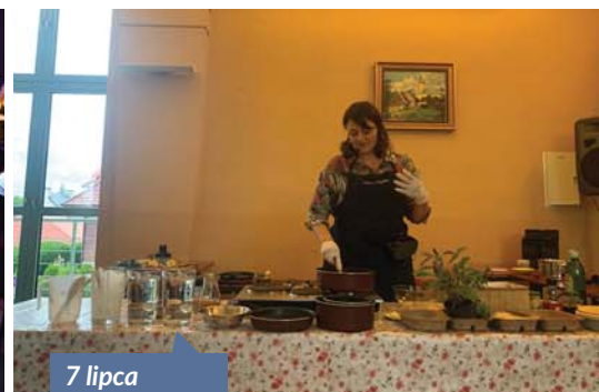
7 lipca - Warsztaty Zero Waste