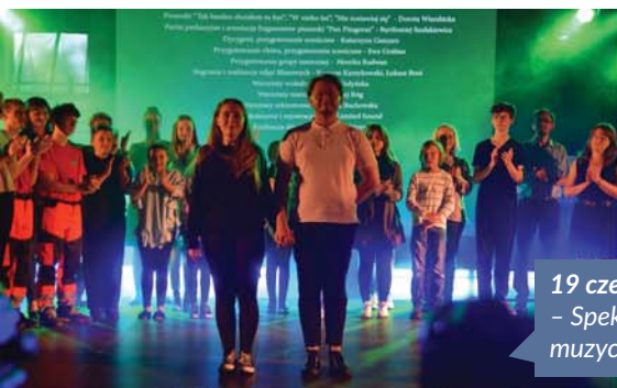
19 czerwca - Spektakl muzyczny „Ptaki”

10 września – Jubileusz 100-lecia OSP Ochojno.