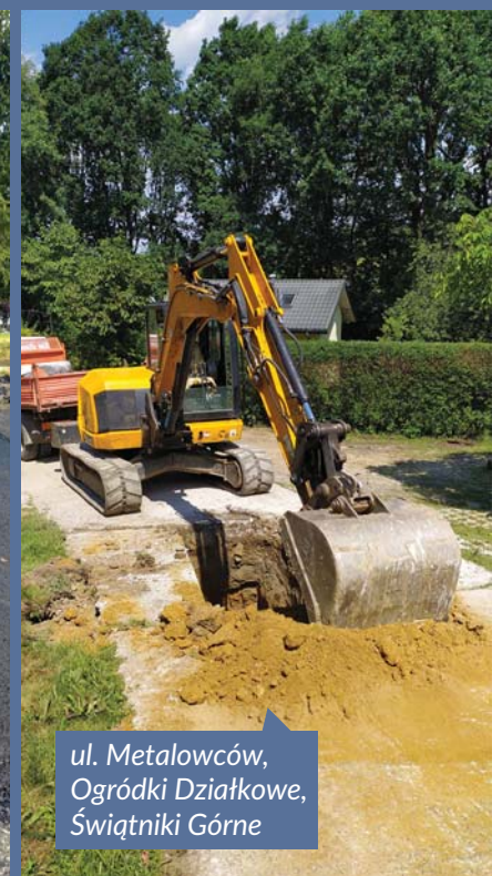
ul. Metalowców, Ogródki Działkowe, Świątniki Górne