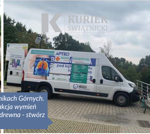
25 września - Otwarcie parku w Świątynkach Górnych. Podczas wydarzenia prowadzona była akcja wymień zakrętki na roślinkę oraz warsztatach z drewna - stwórz swój własny karmnik.