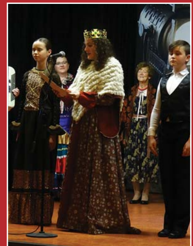
Królowa Jadwiga z dwórką i paziem