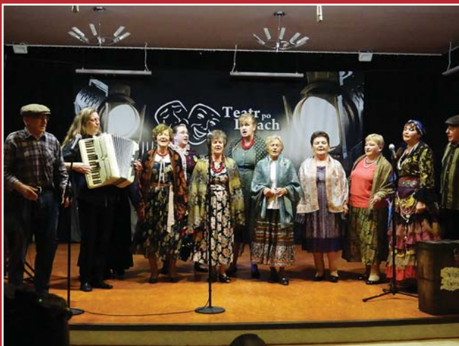
Zespół Teatru po Latach śpiewa "Świątnickie rzemiosło"

Tekst: Natalia Wojtala, Wojtek Knaś