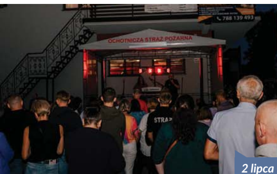
2 lipca – Jubileusz 70-lecia OSP Olszowice