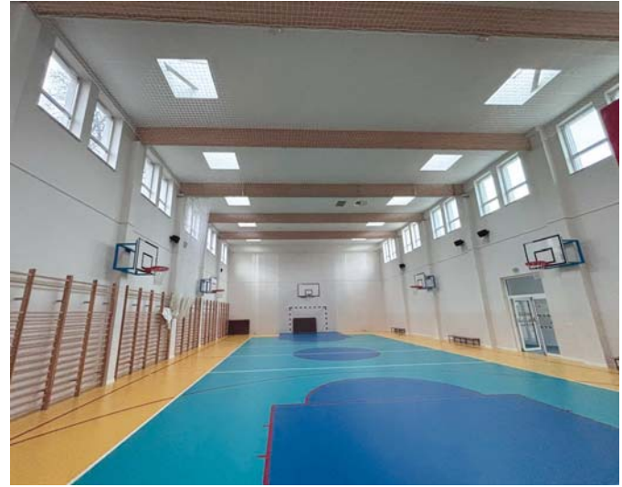
Tekst: Karolina Wasiek

Szkoła rozwija się nie tylko dzięki inwestycjom w infrastrukturę, ale przede wszystkim dzięki ludziom – zaangażowanym rodzicom, ambitnym uczniom i wspierającym nauczycielom.