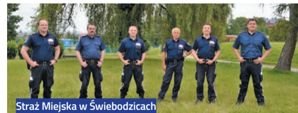
Straż Miejska w Świebodzicach

Sytuacja z wirusem sprawiła, że rodzice powoli tracili nadzieję na to, że uda się w takich okolicznościach zebrać tak ogromną sumę. Pierwszym bohaterem okazał się strażak, który wpłacił pieniądze, zrobił dziesięć pompek i nominował do wyzwania kolejne 5 osób, a całość nagrał telefonem i wrzucił do sieci. Proste, a jak się później okazało bardzo skuteczne. Chęć pomagania opanowała cały kraj, a następnie wykroczyła po za jego granice. Efekt, zebrana potrzebna suma pieniędzy, to cieszy, ale to nie koniec, akcja jest dalej kontynuowana, można pomóc kolejnym chorym na SMA. Oczywiście Świebodzice nie raz pokazały, że są gotowe do pomagania i tym razem bardzo mocno zaangażowały się w kampanię zbiórki pienię-