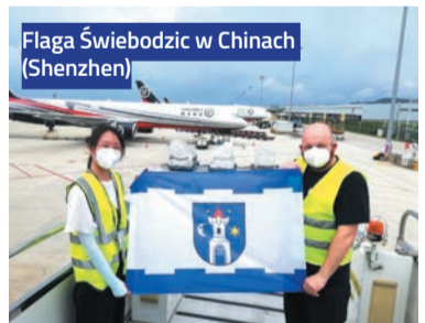
Flaga Świebodzic w Chinach (Shenzhen)