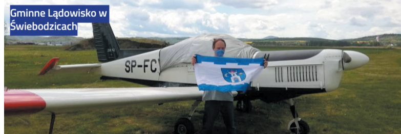
Gminne Łądowisko w Świebodzicach

nasza flaga to nieodłączny element każdej wyprawy naszych lokalnych „łazików”. To pokazuje jak bardzo jesteśmy dumni z tego skąd pochodzimy i gdzie mieszkamy. Flaga Świebodzic również towarzyszyła uczestnikom wielkiego sprzątania Książańskiego Parku Krajobrazowego. Na portalu miejskim www.swiebodzice.pl stworzyliśmy specjalne miejsce, w którym na bieżąco publikujemy nadesłane od Państwa fotografie. Gorąco zachęcamy mieszkańców do przesyłania zdjęć z flagą Świebodzic na adres: ilona.szczygielska@swiebodzice.pl . Mamy nadzieję, że znajdzie się ona w każdej torbie podróżnej.