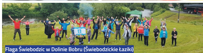
Flaga Świebodzic w Dolinie Bobru (Świebodzickie Łaziki)