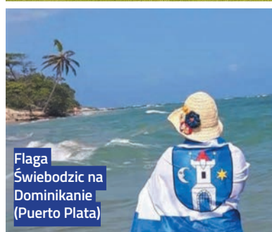
Flaga Świebodzic na Dominikanie (Puerto Plata)