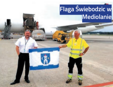
Flaga Świebodzic w Mediolanie