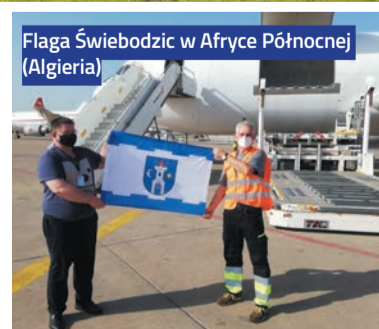
Flaga Świebodzic w Afryce Północnej (Algieria)