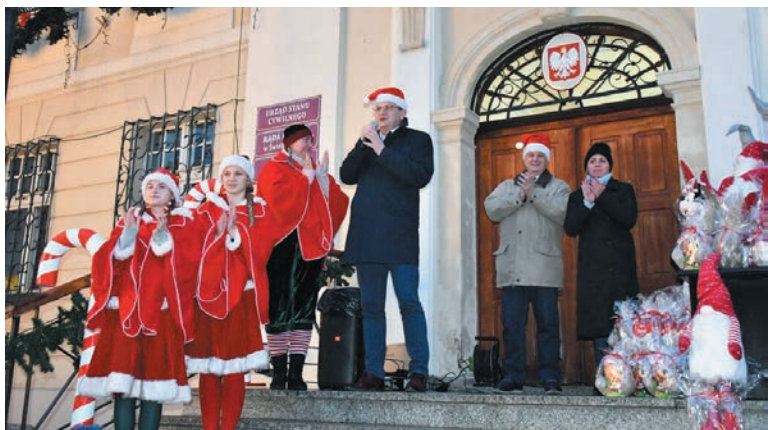
Pomimo niesprzyjającej pogody, w piątek 6 grudnia Rynek w Świebodzicach wypełnił się całymi rodzinami, które licznie przybyły, by spotkać się ze Świętym Mikołajem. Wszystkich serdecznie przywitał