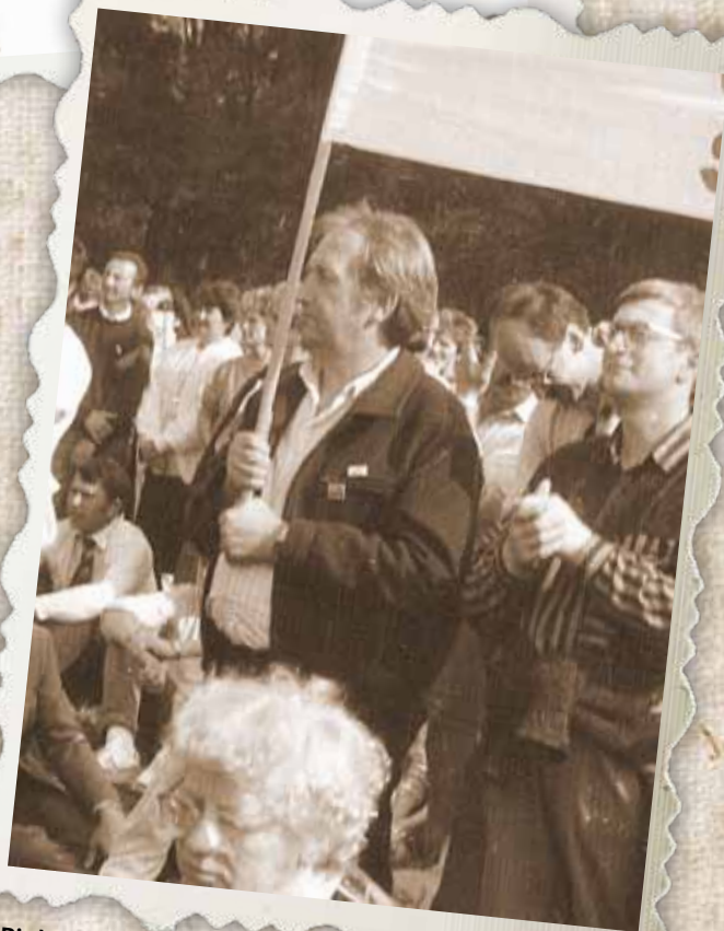
Pielgrzymka Ludzi Pracy na Jasną Górę. Częstochowa, wrzesień 1989 r.