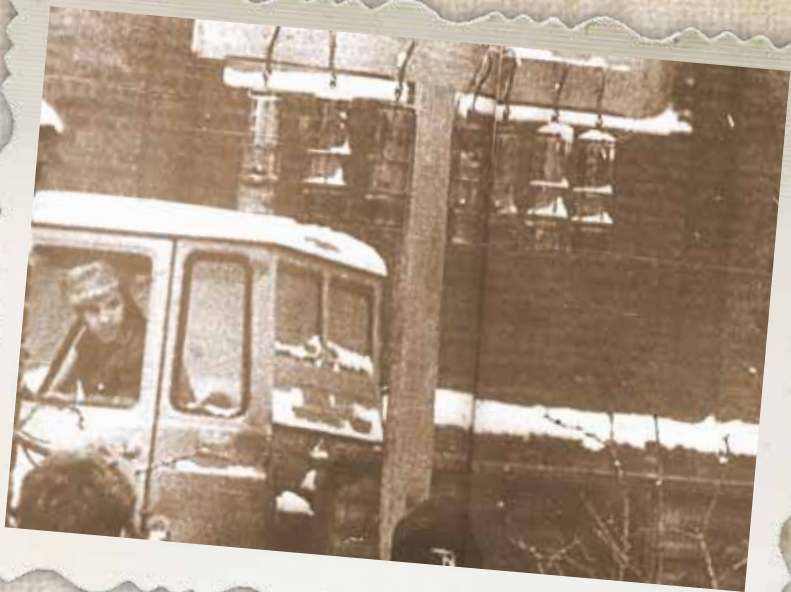
Pacyfikacja Kopalni Wujek, 15 grudnia 1981 r.