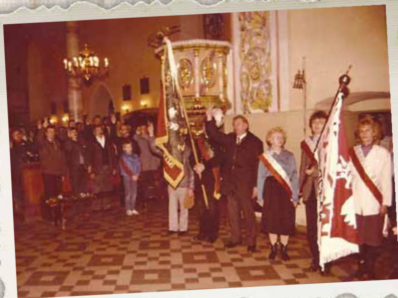
Msza Święta w kościele z okazji odsłonięcia tablicy poświęconej Marszałkowi Józefowi Piłsudskiemu. Świebodzice, Kościół św. Mikołaja, 11 listopada 1988 r.