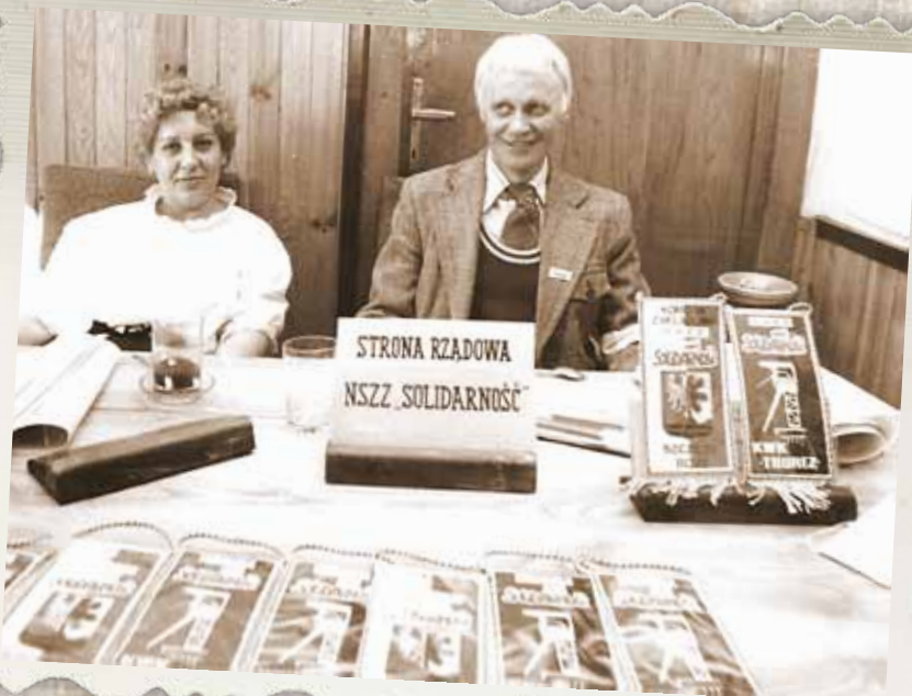
II Walne Zebranie delegatów NSZZ „Solidarność” województwa wałbrzyskiego. Wałbrzych, 1990 r.