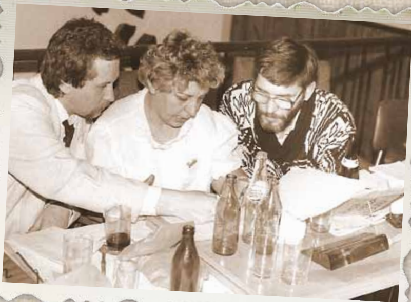
II Walne Zebranie delegatów NSZZ „Solidarność” województwa wałbrzyskiego. Wałbrzych, 1990 r.