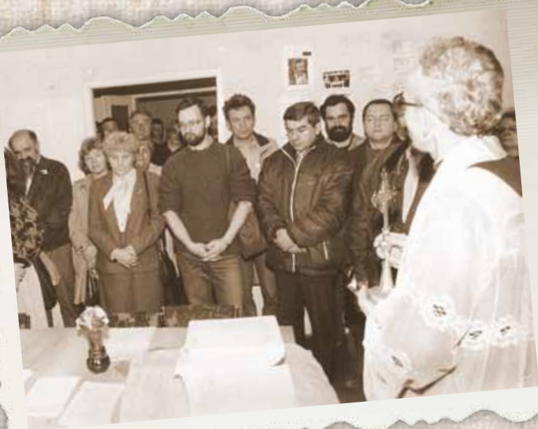
Spotkanie opłatkowe podziemnej Solidarności. Wałbrzych, 1982 r.