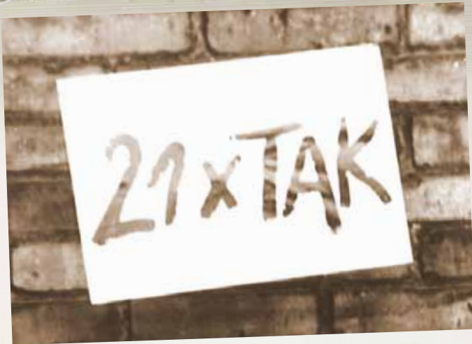
Negocjacje o „21 Postulatów” pomiędzy rządem PRL a strajkującymi, 1980 r.