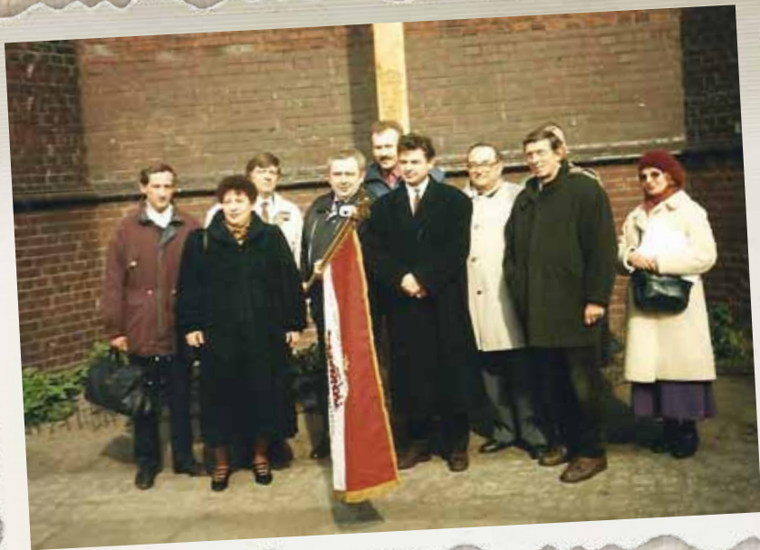
Spotkanie z Marianem Krzaklewskim, przewodniczącym „Solidarności”. Wrocław, lata 90.