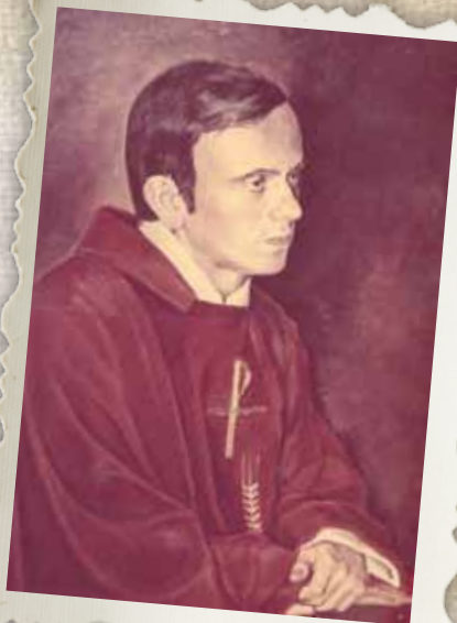
Fotokopie zdjęcia Błogosławionego Księdza Jerzego Popiełuszko z kościoła św. Stanisława Kostki (Warszawa)