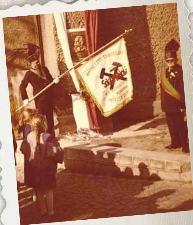
Odświeżenie pamiątkowej tablicy poświęconej Marszałkowi Józefowi Piłsudskiemu ufundowanej przez „Solidarność”. Świebodzice, 11 listopada 1988 r.