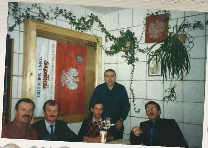
Spotkanie Prezydium Komisji Zakładowej „Solidarności. Zakład „Termet” w Świebodzicach, lata 90.