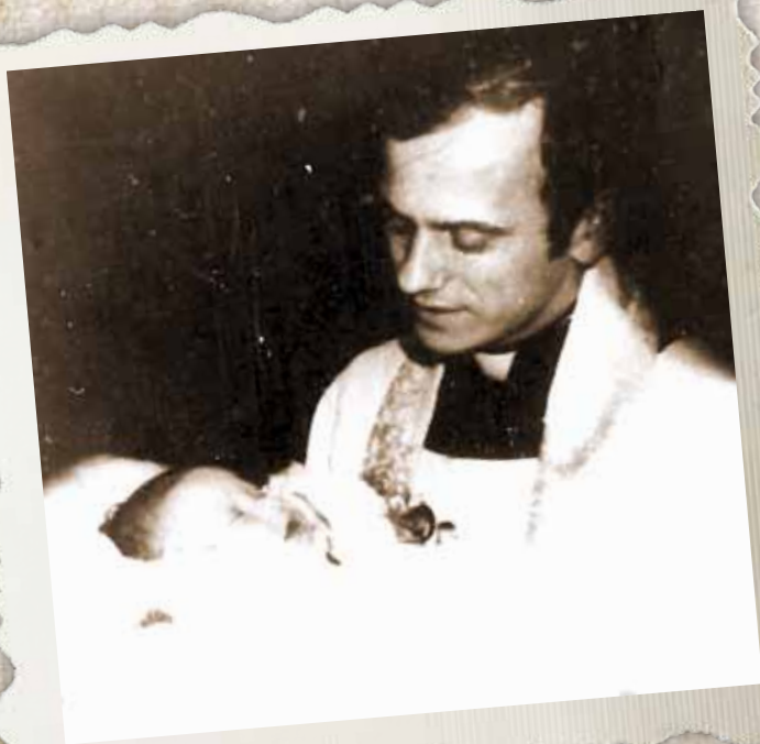
Błogosławiony Ksiądz Jerzy Popiełuszko