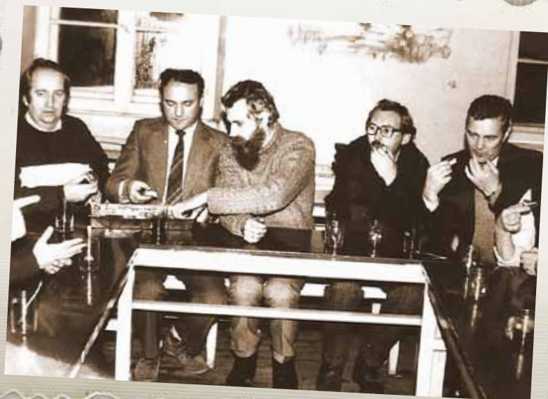
Spotkanie Duszpasterstwa Ludzi Pracy w Salce Katechetycznej Kościoła św. Mikołaja. Świebodzice, 1988 r.