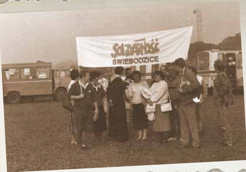
Pielgrzymka Ludzi Pracy na Jasną Górę. Częstochowa, wrzesień 1989 r.