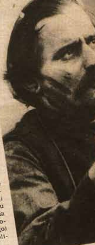
Lech Wałęsa w Walbrzychu Wywiad z L. Wałęsą

Dnia 8 marca odbyło się na Uniwersytecie Warszawskim uroczyste wmurowanie aktu erekcyjnego pod tablicę pamiątkową, upamiętniającą wydarzenia marcowe 1988 r. W dniach 8-23 marca toczy się sesja poświęcona wy-