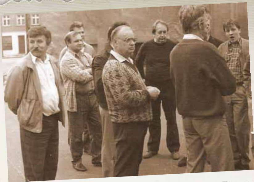
I ołtarz „Solidarności” w Świebodzicach. Boże Ciało, 1990 r.