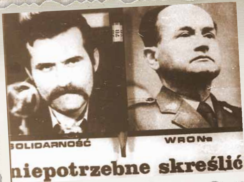
Plakat Wyborczy. Czerwiec 1989 r.