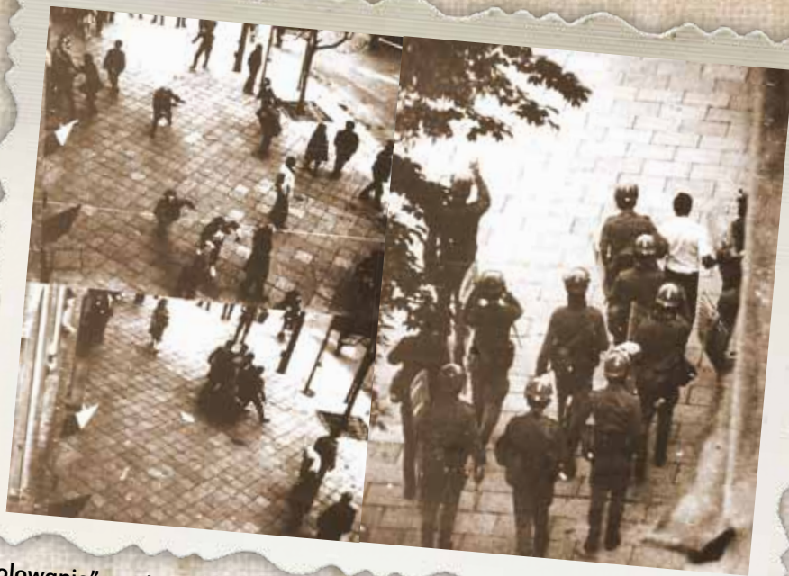
„Polowanie” na demonstrantów. Nowa Huta, 1982 r.