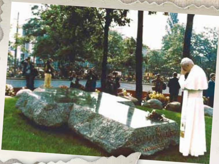
Papież Jan Paweł II przy grobie ks. Jerzego Popiełuszki. Warszawa, 1987 r.