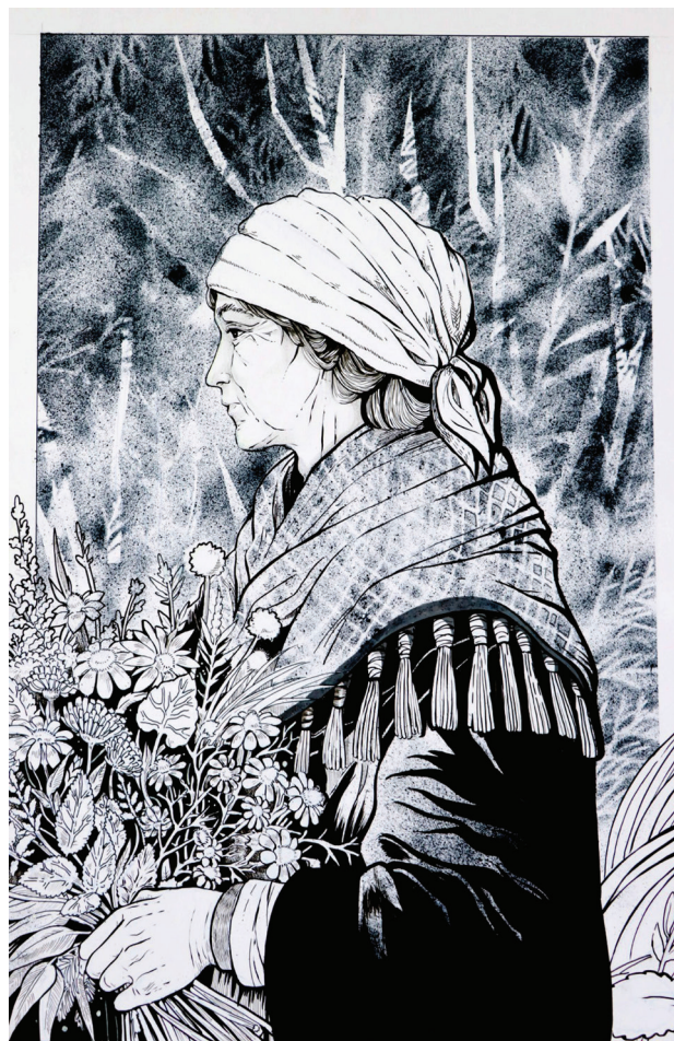
Autor: Ilona Biała