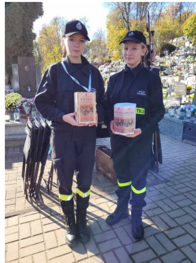
Fot. nr 30 – kalendarze jednostki OSP Wąwolnica oraz drużyny z MDP podczas kwesty

W 2022 r. jednostka OSP Wąwolnica została wyposażona w nowy średni samochód gaśniczo-pożarniczy marki Renault model MDB3 D.