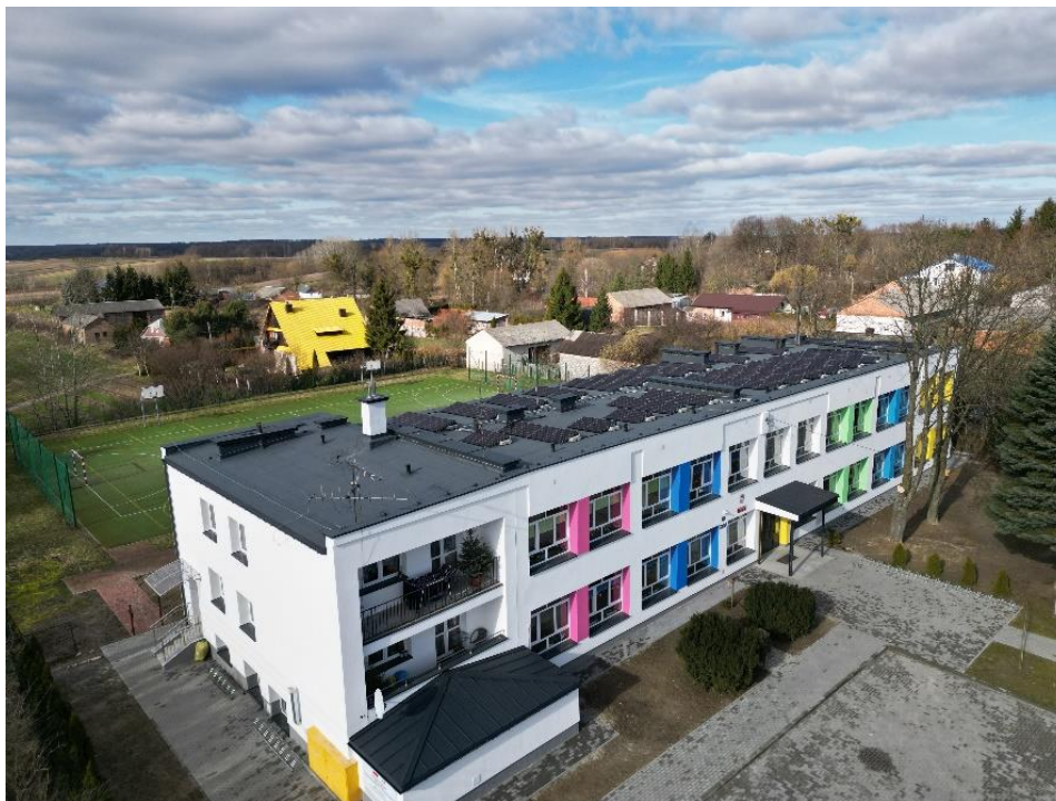
Fot. nr 37 modernizacja budynku Szkoły Podstawowej w Karmanowicach

zainstalowano oszczędne kotły gazowe, wymieniono instalację c.o. w budynku, wykonano nową instalację elektryczną i oświetleniową, wykonano nowe podłogi w salach, wymieniono drzwi do sal lekcyjnych, zmodernizowano łazienki, zamontowano na dachu panele fotowoltaiczne, wykonano nowy parking i plac manewrowy. Koszt całkowity 2.771.143,56 zł, dofinansowanie 2.160.000,00 zł.