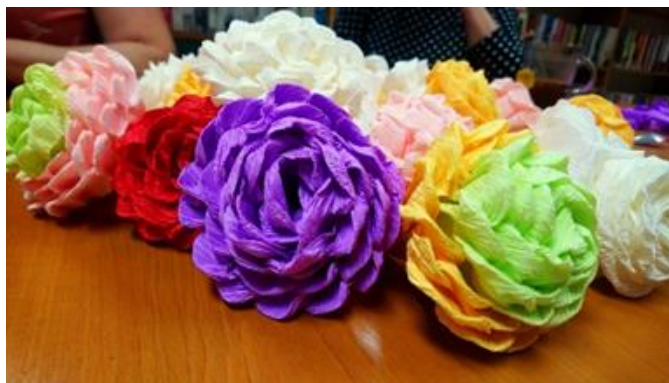
Fot. nr 22 – zajęcia plastyczne w Gminnej Bibliotece Publicznej w Wąwolnicy

Gminna Biblioteka Publiczna bierze udział w ogólnokrajowych akcjach, takich jak „Narodowe Czytanie”.