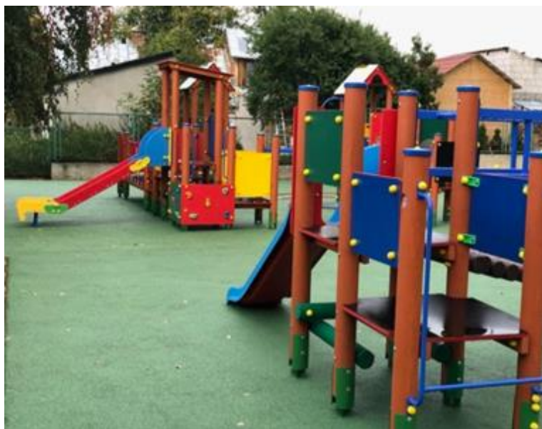
Fot. nr 9 – plac zabaw przy przedszkolu

Obok budynku szkoły znajduje się budynek Przedszkola w Wąwolnicy, który został w 2023 roku zmodernizowany. W budynku przedszkola znajdują się 4 sale wychowania przedszkolnego, pokój logopedy, sala integracji sensorycznej, stołówka, kuchnia i pomieszczenie socjalne dla pracowników. Przedszkole posiada duży plac zabaw dla dzieci.