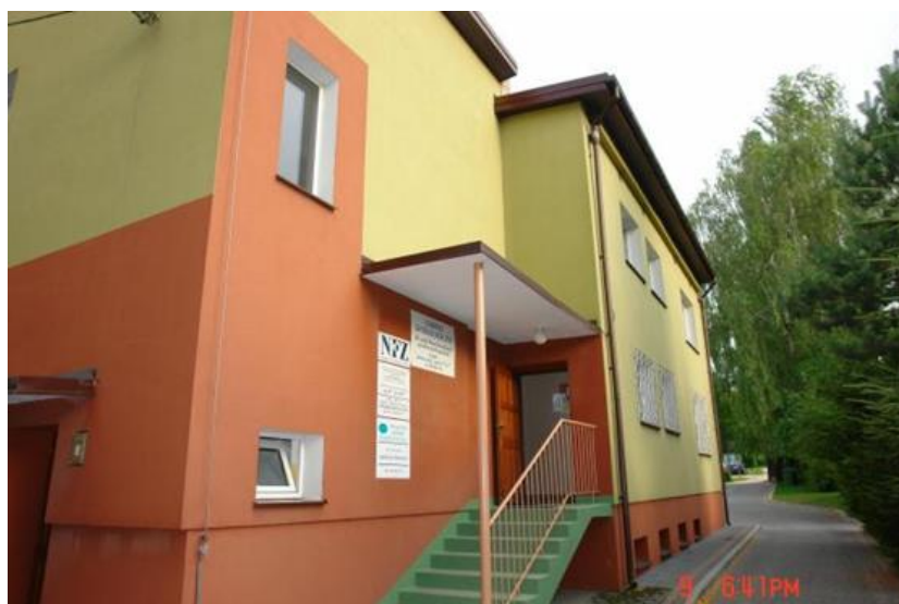
Fot. nr 26 – Niepubliczny Zakład Opieki Zdrowotnej „Nasze zdrowie” w Wąwolnicy

In the locality of Wąwolnica, there is also a private veterinary practice „MAXWET”, which, in addition to a veterinary cabinet, also provides grooming services.