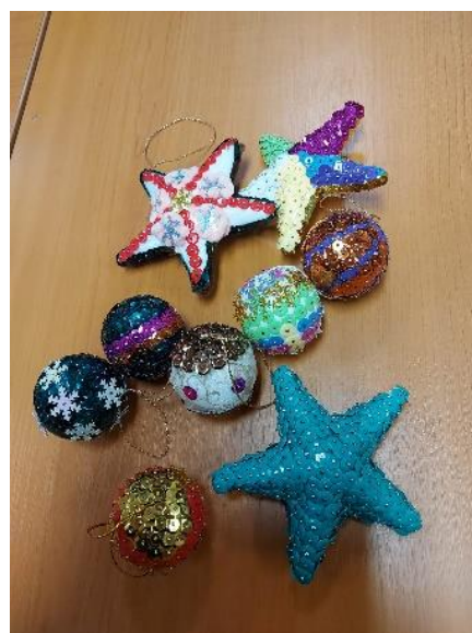
Fot. nr 21 – zajęcia plastyczne w Gminnym Domu Kultury w Wąwolnicy

W bibliotece rokrocznie przygotowywane są wystawy poświęcone Powstaniu Listopadowemu, Konstytucji 3-Maja, Narodowy Dzień Pamięci Żołnierzy Wyklętych – Bohaterowie Wyklęci, „Tydzień zakazanych książek”, Dzień Babci i Dziadka, Dzień Bezpiecznego Internetu, Dzień Świętego Walentego, Dzień Matki.