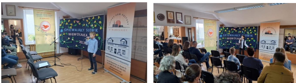
Fot. nr 14 – zdjęcia z konkursu „Śpiewający Słowik”

Gminny Dom Kultury w Wąwolnicy współpracuje z wieloma innymi ośrodkami kultury, m.in. Centrum Spotkań Kultur w Lublinie. W ramach tej współpracy wąwolnicka placówka co roku jest organizatorem eliminacji powiatowych Wojewódzkiego Festiwalu Piosenki Dziecięcej i Młodzieżowej „Śpiewający Słowik”. Jest to konkurs skierowany do dzieci i młodzieży z województwa lubelskiego, podczas którego prezentowane są polskie piosenki. Uczestników ocenia profesjonalne jury, zaś zwycięzcy eliminacji powiatowych biorą udział w finale walcząc o tytuł „śpiewającego słowika”.