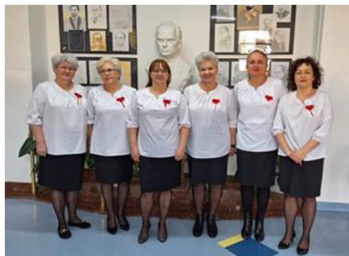
Fot. nr 11 – zespół Babki znad Bystrej

W Gminnym Domu Kultury odbywają się spotkania Stowarzyszenia „Młodzi Duchem” skupiającego 30 emerytów z gminy Wąwolnica. „Młodzi Duchem” wspólnie wyjeżdżają na wycieczki i biorą udział w warsztatach. Organizują spotkania integracyjne i okolicznościowe, zapraszają ludzi o ciekawych zawodach i członków innych grup. Są członkami Lokalnej Grupy Działania „Zielony Pierścień”, posiadają certyfikaty na produkty lokalne oraz realizują projekty.