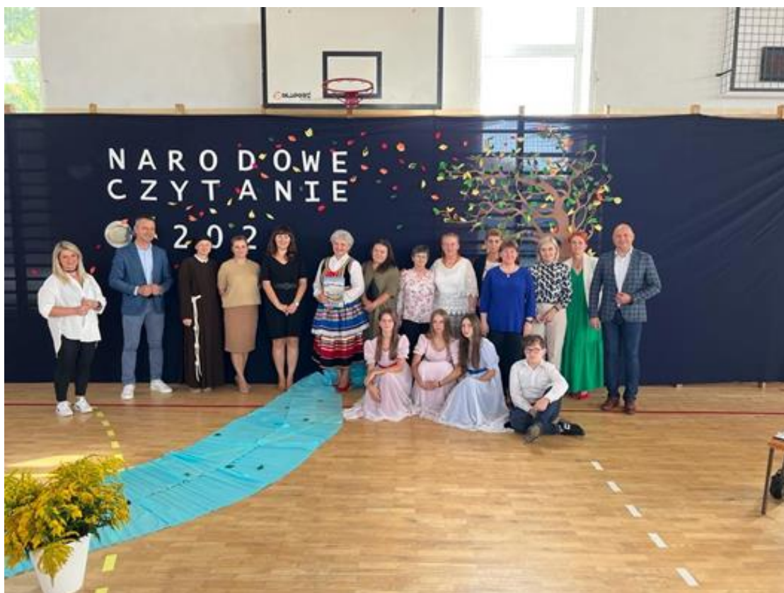
Fot. nr 23 – ogólnopolska akcja „Narodowe Czytanie”

W maju podczas „Ogólnopolskiego Tygodnia Bibliotek” Biblioteka wraz z biblioteką szkolną w Wąwolnicy prezentuje sylwetkę oraz twórczość malarską jednego ze sławnych malarzy światowych (Van Gogh, Jan Matejko), zaś popołudniami organizujemy warsztaty plastyczne poświęcone tym osobom.