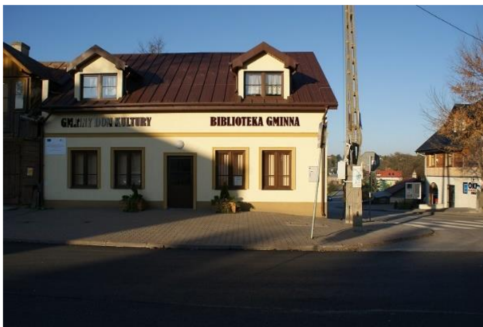
Fot. nr 19 – budynek Gminnej Biblioteki Publicznej, Gminnego Domu Kultury oraz Zakładu Gospodarki Komunalnej

Obok wejścia głównego po lewej stronie znajduje się dodatkowe pomieszczenie, mieści się tam biuro Zakładu Gospodarki Komunalnej w Wąwolnicy. Lokalizacja biblioteki na parterze sprzyja odwiedzaniu jej przez osoby z niepełnosprawnościami. Piętro budynku zajmuje Gminny Dom Kultury w Wąwolnicy.