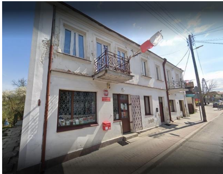
Fot. nr 4 – Oddział Banku Spółdzielczego oraz Poczty Polskiej w Wąwolnicy