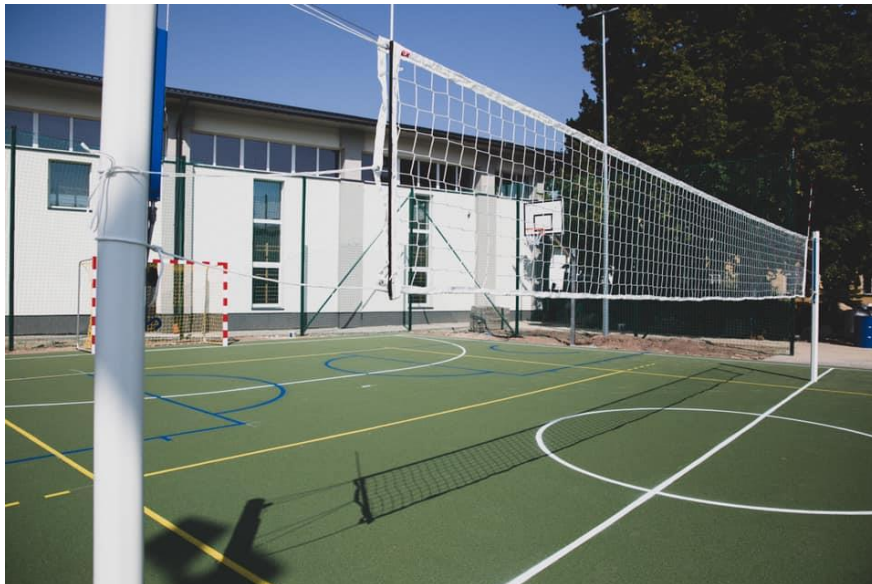
Fot. nr 7 – boisko przy ZSP w Wąwolnicy

Priorytetem Szkoły są działania zmierzające do podniesienia efektywności kształcenia uczniów, w tym ze specjalnymi potrzebami edukacyjnymi poprzez takie działania jak: