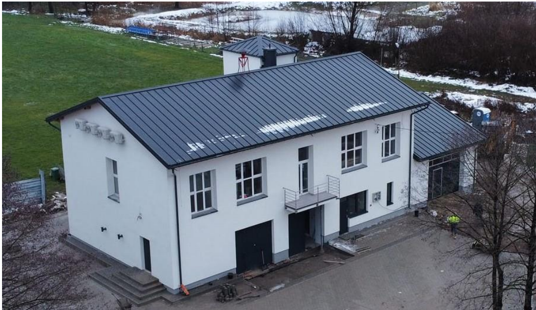
Fot. nr 33 – budynek OSP Wąwolnica

Pod koniec 2023 r. oddano do użytkowania budynek remizy OSP Wąwolnica, w którym dokonano gruntownego remontu, a także dobudowano dodatkowy garaż dla samochodu strażackiego oraz przebudowano plac manewrowy wokół budynku remizy strażackiej.