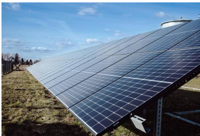
Fot. nr 36 – instalacja fotowoltaiczna przy stacji uzdatniania wody w Karmanowicach

Ponadto w ramach wykorzystania odnawialnych źródeł energii, według stanu na koniec 2023 roku Gmina Wąwolnica zainstalowała trzy instalacje fotowoltaiczne na obiektach publicznych stanowiących jej własność – Budynku Urzędu Gminy w Wąwolnicy, Stacji Uzdatniania Wody w Karmanowicach oraz Szkole Podstawowej w Karmanowicach oraz jedną instalację do ogrzewania ciepłej wody użytkowej zamontowaną w części socjalnej budynku Oczyszczalni Ścieków w Wąwolnicy.