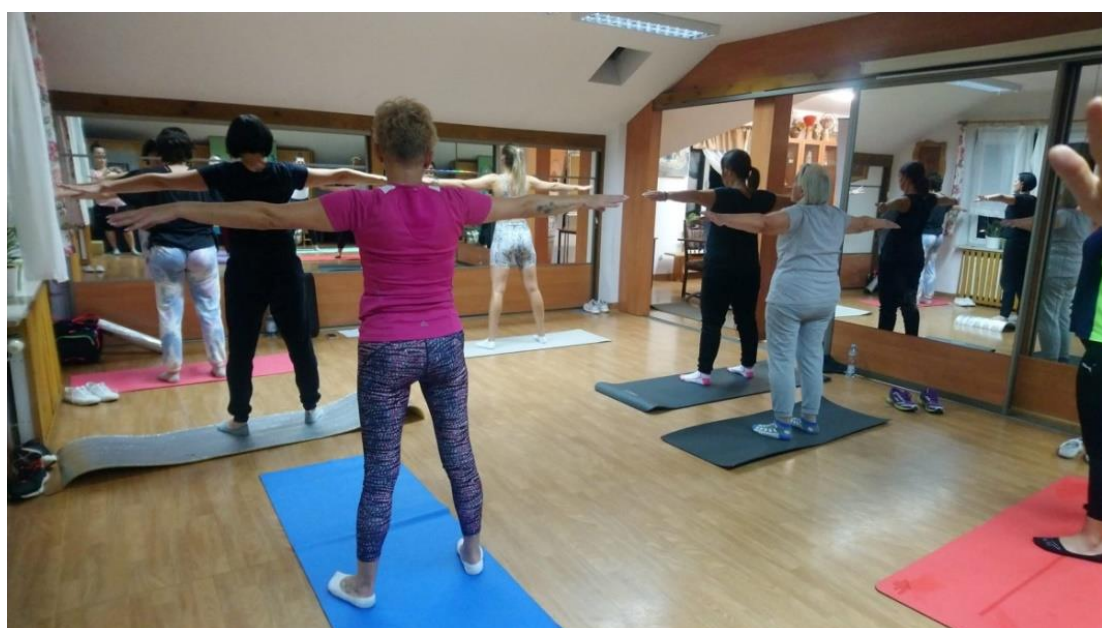
Fot. nr 13 – zajęcia pilates w Gminnym Domu Kultury w Wąwolnicy

Panie z terenu gminy oraz spoza gminy spotykają się w Domu Kultury dwa razy w tygodniu, aby wziąć udział w zajęciach fitness i pilates.