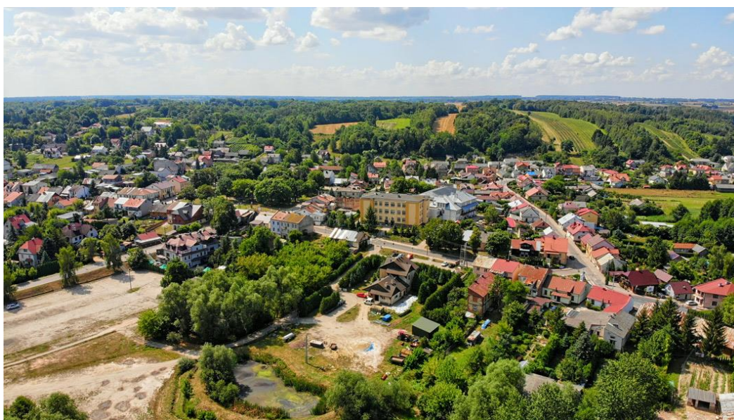
Fot. nr 1 – Wąwolnica z drona