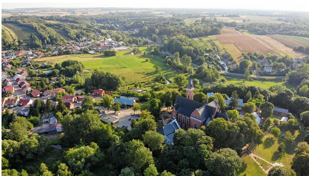
Fot. nr 2 – wzgórze kościelne

Wzgórze Kościelne, na którym usytuowane było średniowieczne miasto lokacyjne i zamek, znajduje się w północno zachodniej części osady. Prowadzi nań zachodni odcinek ul. Zamkowej (dawna droga dojazdowa do bramy miejskiej).