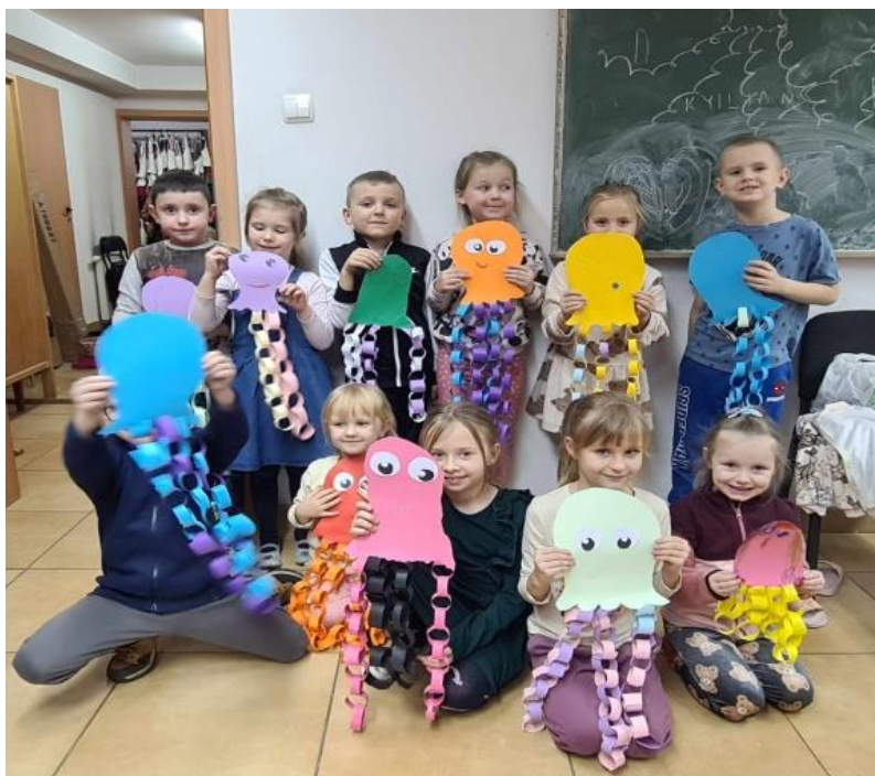
Fot. nr 12 – zajęcia plastyczne w Gminnym Domu Kultury w Wąwolnicy

Raz w tygodniu w GDK w Wąwolnicy odbywają się próby zespołu Folkrose. Zespół tworzy autorskie aranżacje w klimacie szeroko pojętej muzyki folk. Tworzy go trzech muzyków oraz wokalistka. Członkowie zespołu wspierają muzycznie dzieci z ZTL Bystrzacy podczas występów, zajmują się oprawą muzyczną różnego typu uroczystości w gminie Wąwolnica.