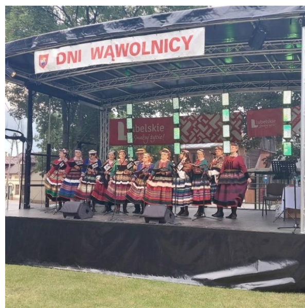
Fot. nr 15 – Dni Wąwolnicy

Spotkanie opłatkowe dla Mieszkańców i zaproszonych gości odbywa się na wąwolnickim Rynku lub w gościnnych murach Zespołu Szkolno-Przedszkolnego w Wąwolnicy. Podczas świątecznego spotkania Mieszkańcy dzielą się opłatkiem, śpiewają kolędy i składają sobie życzenia. Wydarzeniu towarzyszy zawsze odpowiednia oprawa artystyczna oraz poczęstunek złożony z wigilijnych przysmaków przygotowanych przez lokalne organizacje.