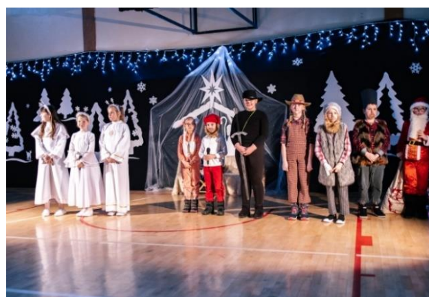
Fot. nr 16 – spotkanie opłatkowe

Każdego roku w październiku w Bazylice Mniejszej Matki Boskiej Kębelskiej Gminny Dom Kultury organizuje Przegląd Pieśni Maryjnej. Jest to koncert, w którym udział biorą lokalne zespoły, a także zapraszane są zespoły działające przy innych ośrodkach kultury. Każdy z wykonawców prezentuje wybrane utwory o tematyce maryjnej.