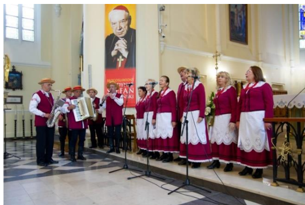
Fot. nr 17 – Przegląd Pieśni Maryjnej w Bazylice

Każdego roku Gminny Dom Kultury we współpracy z innymi instytucjami organizuje uroczystości związane z Narodowym Dniem Niepodległości. 11 listopada w Wąwolnicy ma miejsce składanie kwiatów na Rynku pod pomnikiem upamiętniającym pacyfikację Wąwolnicy w dn. 2 maja 1946 roku, przemarsz do Bazyliki Mniejszej M. B. Kębelskiej na mszę św. w intencji Ojczyzny, a następnie patriotyczny program artystyczny w wykonaniu lokalnych artystów w GDK w Wąwolnicy.