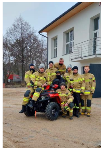
Fot. nr 34 – strażacy OSP Wąwolnica z wozem bojowym oraz quadem