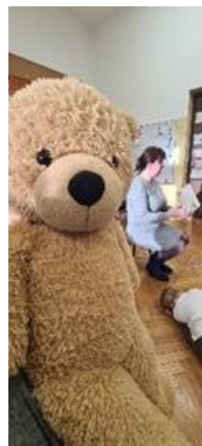
Fot. nr 20 – „Światowy Dnia Pluszowego Misia”

Cyklicznie biblioteka zaprasza najmłodszych do wspólnego rysowania kartek świątecznych na Boże Narodzenie oraz do wykonania pisanek-kolorowanek na Święta Wielkanocne.