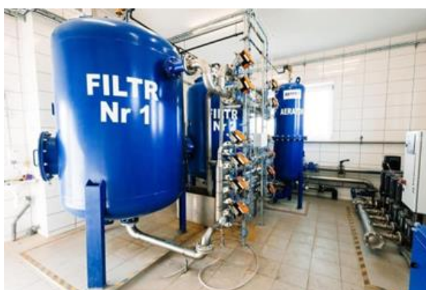
Fot. nr 38 – stacja uzdatniania wody w Karmanowicach

Kolejną inwestycją była rozbudowa sieci wodociągowej w Zarzece (tzw. Słoneczne Wzgórze). W ramach tej inwestycji zasilono w wodę obszar na wzgórzu. W tym celu wybudowano pompownię, która pompuje wodę do sieci położonej wyżej dzięki czemu z wodociągu mogą skorzystać mieszkańcy tego rejonu gminy. Koszt 391.604,49 zł, dofinansowanie 350.229,18 zł.