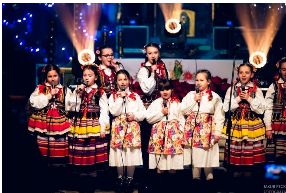
Fot. nr 10 – zespół „Bystrzacy”

W Gminnym Domu Kultury działa Zespół Tańca Ludowego „Bystrzacy”, który w 2024 roku obchodzi jubileusz 30-lecia działalności. To wąwolnicki zespół tańca ludowego istniejący od 1994 roku. Obecnie zespół tworzy około 40 dzieci w wieku od 5 do 15 lat w trzech grupach wiekowych. Na program zespołu składają się pieśni i tańce regionu lubelskiego, łowickiego, lasowiackiego, podlaskiego oraz tańce narodowe: polonez, mazur, oberek i krakowiak, a także zabawy dziecięce: w zagrodzie, gaik, koniarz i koguciki. Zespół bierze aktywny udział w lokalnych uroczystościach, koncertuje w różnych miejscach w Polsce i poza granicami naszego kraju, m. in. w Czechach, Mołdawii, na Białorusi, Słowacji, Ukrainie, w Wielkiej Brytanii i na Węgrzech. „Bystrzacy” biorą udział w różnego rodzaju uroczystościach lokalnych, koncertach, zgłaszają się do konkursów. Tradycją zespołu stały się zimowe wyjazdy na zgrupowania do Murzasichle, podczas których dzieci doskonaliły warsztat wokalny i taneczny oraz integrują się.