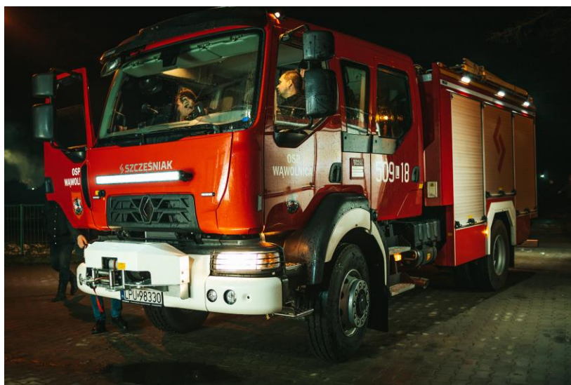
Fot. nr 31 – średni samochód gaśniczo-pożarniczy marki Renault

W 2022 r. jednostka OSP Wąwolnica została wyposażona w nowy średni samochód gaśniczo-pożarniczy marki Renault model MDB3 D.