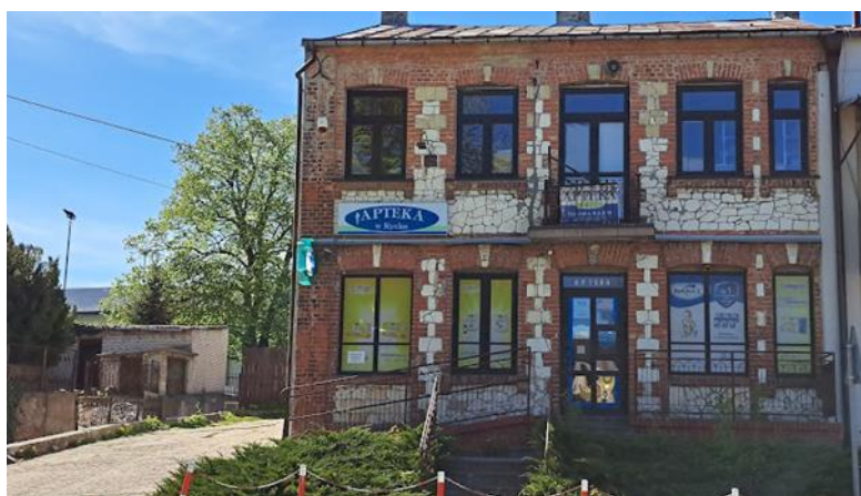
Fot. nr 25 – Apteka w Rynku

The above confirms that the locality of Wąwolnica ensures basic health protection for all residents of the locality and the commune, but not only, as services available in Wąwolnica are also used by residents of surrounding communes.