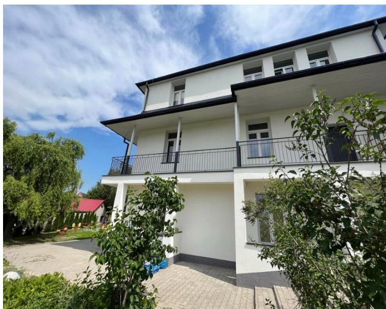
Fot. nr 8 – Przedszkole w Wąwolnicy

Obok budynku szkoły znajduje się budynek Przedszkola w Wąwolnicy, który został w 2023 roku zmodernizowany. W budynku przedszkola znajdują się 4 sale wychowania przedszkolnego, pokój logopedy, sala integracji sensorycznej, stołówka, kuchnia i pomieszczenie socjalne dla pracowników. Przedszkole posiada duży plac zabaw dla dzieci.