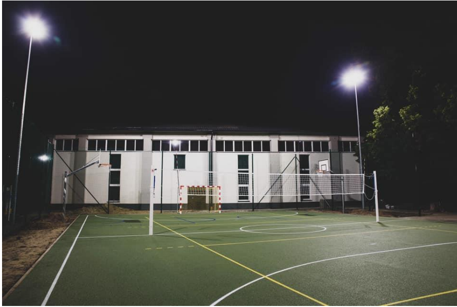
Fot. nr 6 – boisko przy ZSP w Wąwolnicy