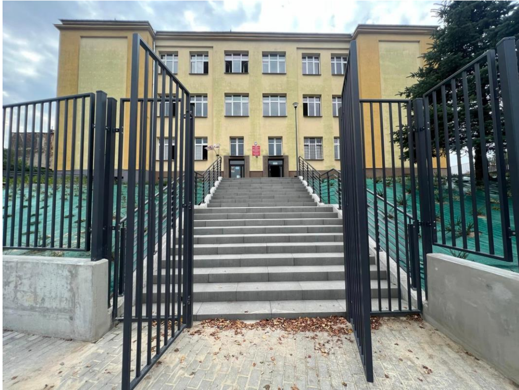
Fot. nr 5 – Zespół Szkolno-Przedszkolny w Wąwolnicy