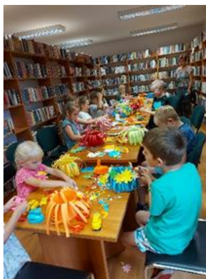
Fot. nr 24 – warsztaty plastyczne w Gminnej Bibliotece Publicznej w Wąwolnicy

Każdego roku w bibliotece organizowane są zajęcia feryjne i wakacyjne, zapraszane