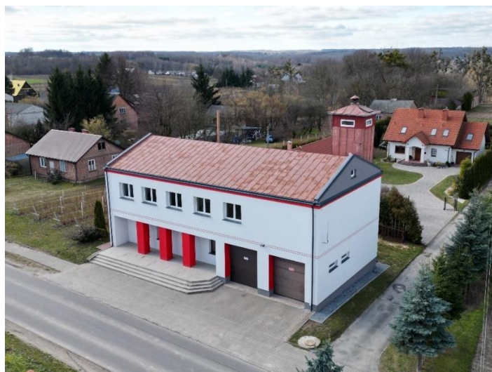
Fot. nr 39 – budynek OSP Karmanowice

Remont budynku OSP w Karmanowicach wykonano ocieplenie i elewacje budynku, odnowiono salę na piętrze wykonano gładzie, nową podłogę i zamontowano klimatyzatory. Koszt gminy 90.000,00 zł.