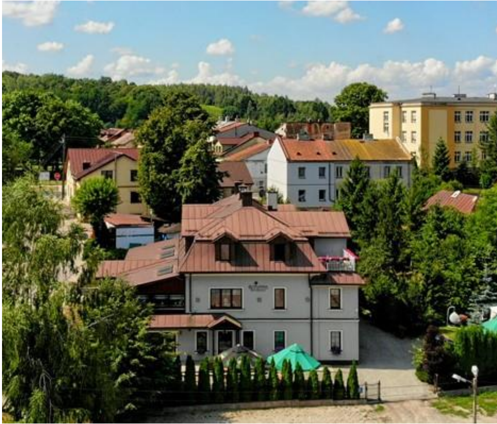
Fot. nr 3 – Restauracja i Pensjonat Rozanna

W miejscowości Wąwolnica swoją siedzibę ma Oddział Banku Spółdzielczego oraz Oddział Poczty Polskiej. Na terenie Wąwolnicy znajdują się również dwa paczkomaty.