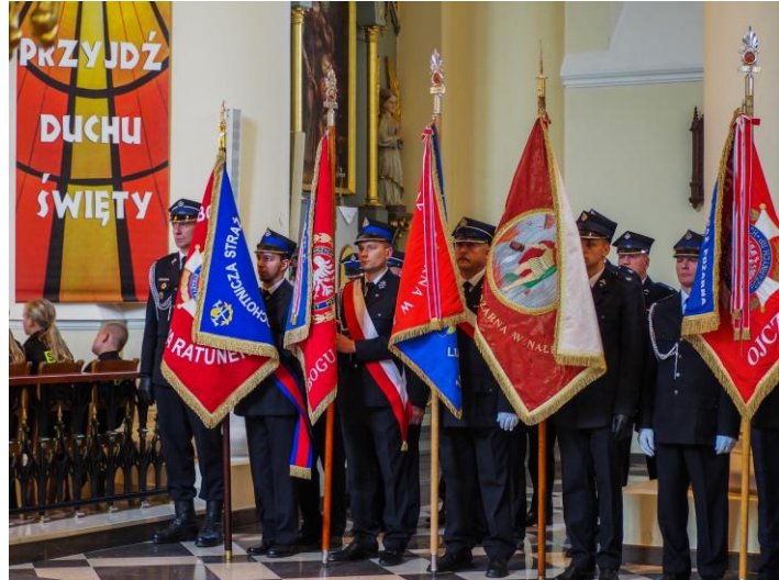
Fot. nr 32 – uroczystość 110-lecia OSP Wąwolnica

Pod koniec 2023 r. oddano do użytkowania budynek remizy OSP Wąwolnica, w którym dokonano gruntownego remontu, a także dobudowano dodatkowy garaż dla samochodu strażackiego oraz przebudowano plac manewrowy wokół budynku remizy strażackiej.