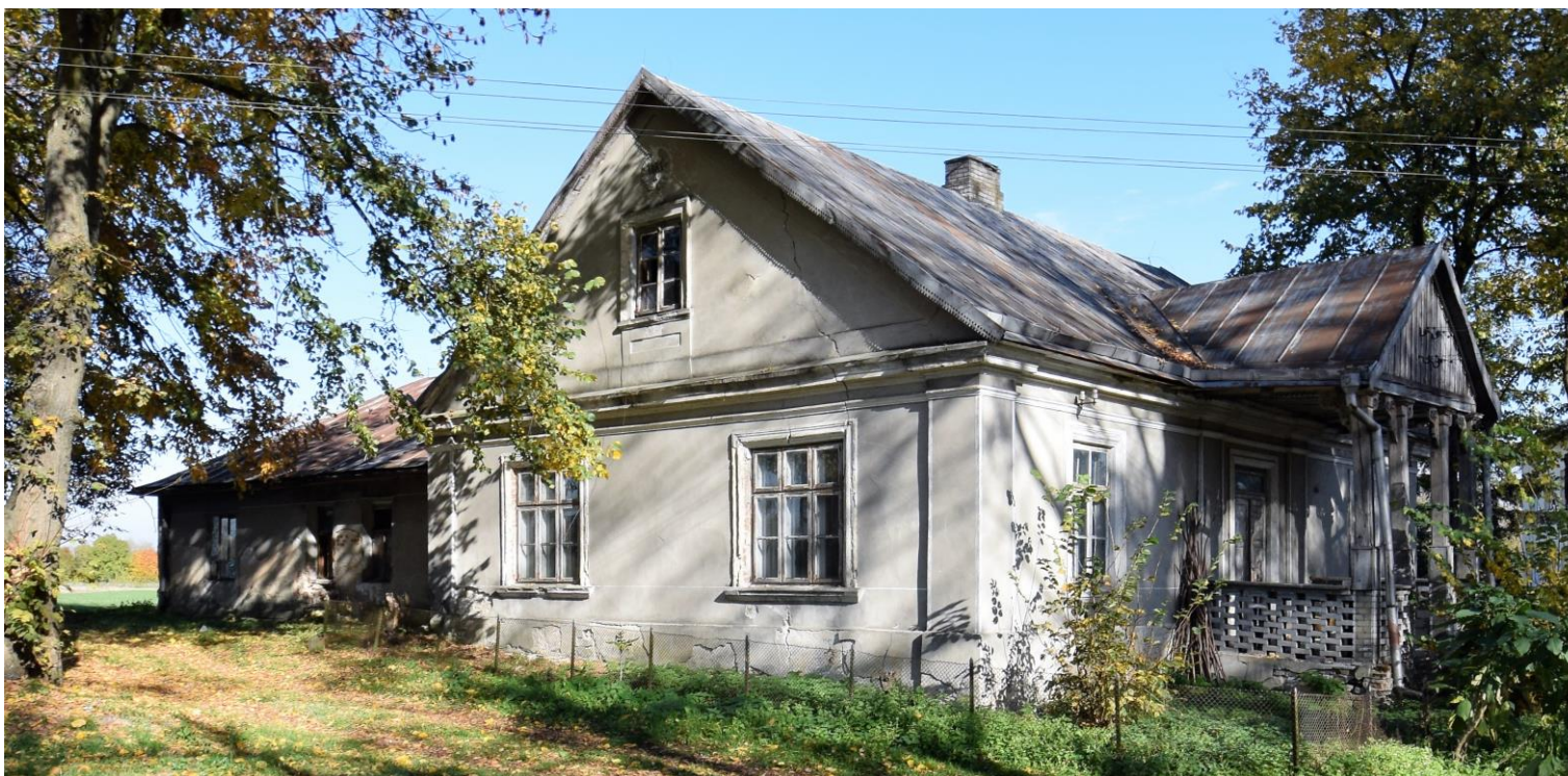
Widok od południowego zachodu

8. Fotografia z opisem wskazującym orientację albo mapa z zaznaczonym stanowiskiem archeologicznym